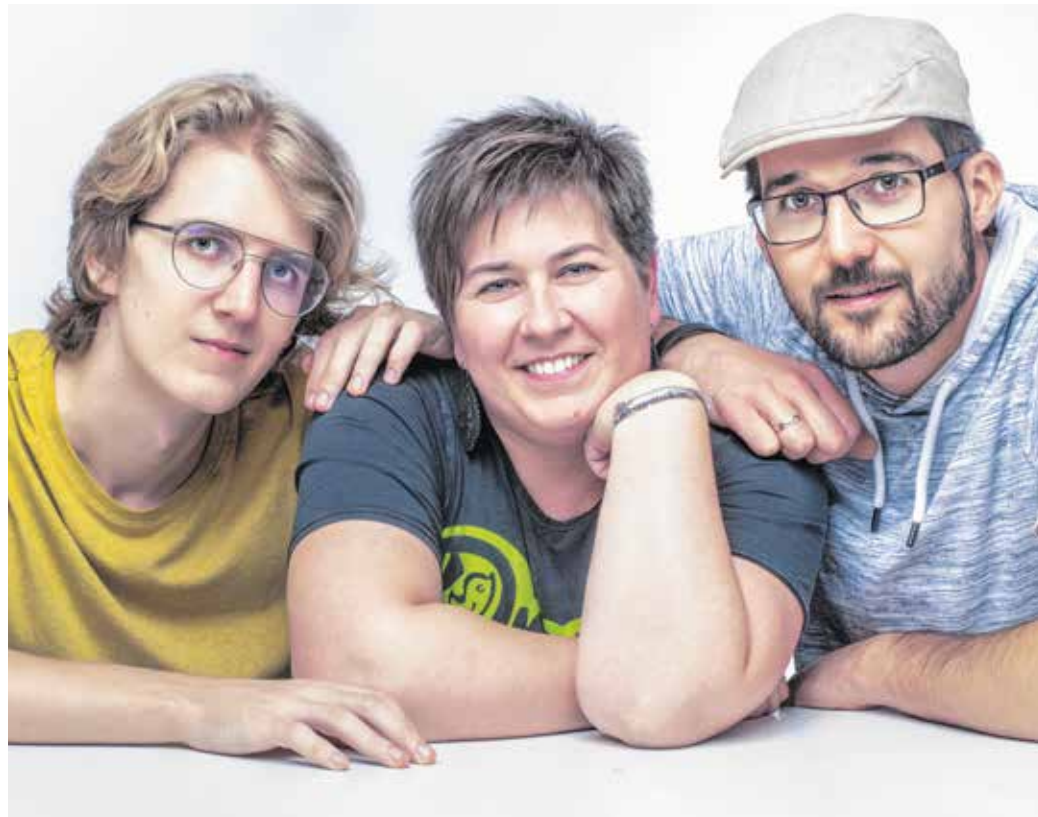
A Drazsé zenekar négy új dalt is rögzített – ezeket előadják majd koncertjeiken is.

– Szinte végtelen mennyiségű animációs, 3D-s profi videót találni manapság az interneten. Épp ezért inkább visszakanyarodtunk a klasszikus megjelenéshez: a vers minden sorát festővásznonra vitte Bucsányi Endre barátunk, a képek abszolút visszaadják a dal kedves hangulatát.