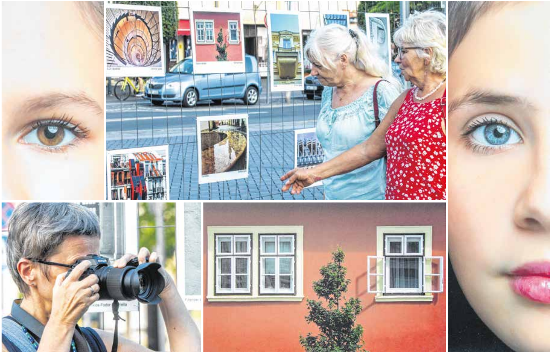
Közel kétszáz fotót mutattak be a Várkerületen – a Soproni Fotóklub 15 tagja is válogatott az elmúlt egy évben készült alkotásaiból.