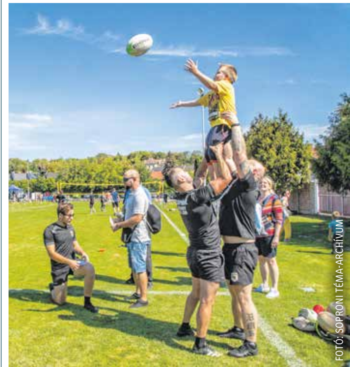
Tavaly is rengeteg érdeklődőt vonzott a sportágválasztó.

Városunkban az idei év szeptemberében is rendezik a méltán népszerű sportágválasztó eseményt. A Sportolj Sopron! immár 6. alkalommal várja az érdeklődőket szeptember 2-án, szombaton 10 és 13 óra között.