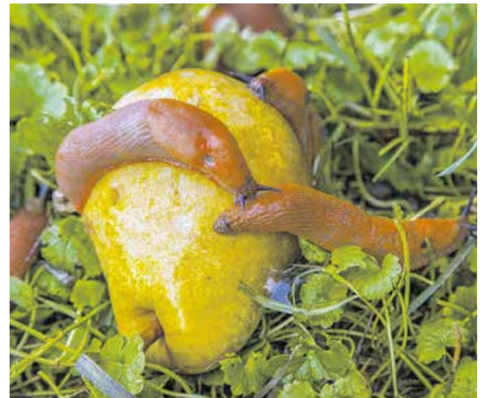
A spanyol csupaszcsga 15 éve jelent meg tömegesen hazánkban, leginkább a Dunántúlon fordul elő.

A kerttulajdonosoknak gyakran gyűlik meg a bajuk a csigákkal. Valamilyik fajtájuk kifejezetten hasznos, ám a kártékonyak ellen is megvannak a vegyszermentes megoldások.