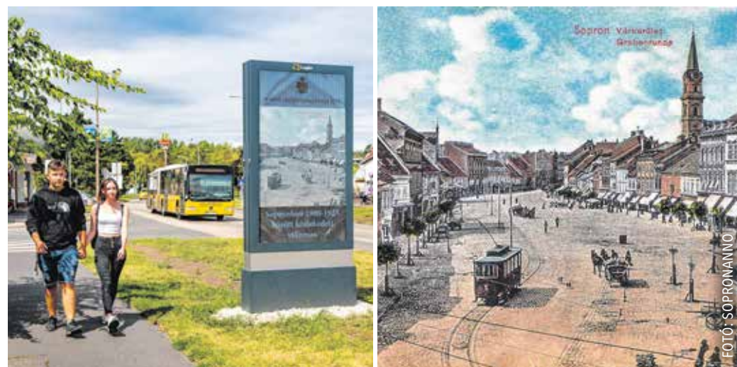
Jelenleg három digitális táblán láthatóak a Sopron anno korabeli felvételei.

Sopron város múltjáról mesélnek a képek, a hozzájuk kapcsolódó szövegekből pedig sok mindent megtudhatunk a készítés körülményeiről, a korabeli viszonyokról. Idén lett tizenegy éves a Sopron anno, a civil kezdeményezés először közösségi oldalra került, majd egy honlapot ( www.sopronanno.hu ) is létrehozta. (Lapunkban is többször írtunk a sikereikről, például: Élménygazdag netes böngészés, 2020. április 1., Soproni Téma .) Most viszont elmondhatjuk, hogy