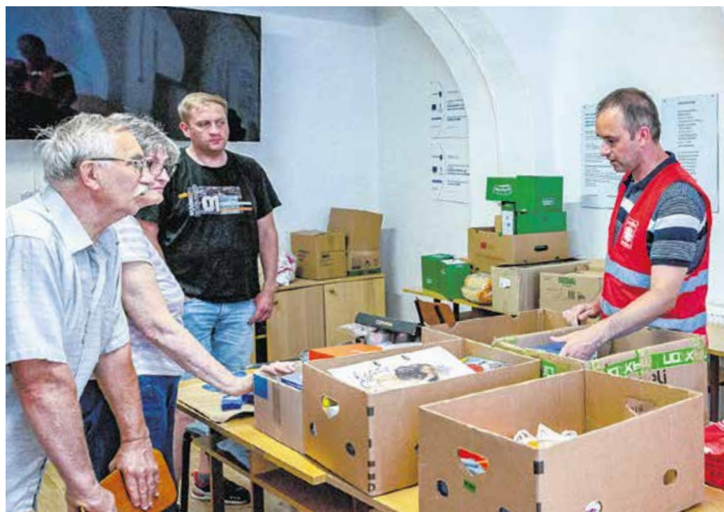
Március óta a 17. szállítmány indult Sopronból az ukrajnai rászorulókhöz.

A felajánlások egy része az alapítvány által felkarolt, rászoruló soproni családokhoz kerül, a többit a Nyiregyházi Karitászs segítségével a kárpátaljai Csongorra juttatják el a háború elől odamenekült gyermekek részére.