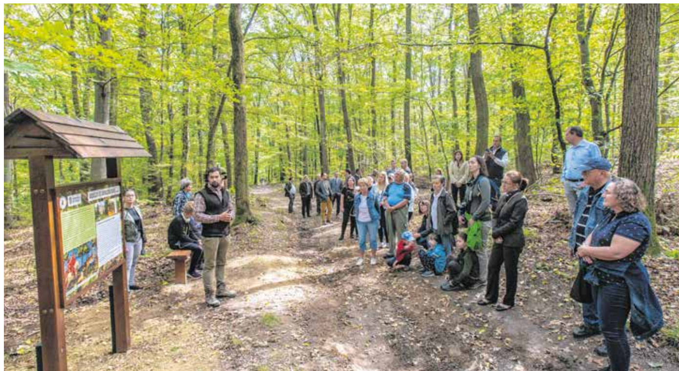
Az új, 3,5 kilométer hosszú út a Károly-magaslati parkolótól vezet a Muckra, az Erdő Házához. 10 interaktív tábla, valamint a vadászárral és vadgazdálkodással kapcsolatos eszközök és berendezések teszik érdekessé.

Ünnepélyes keretek között adták át múlt szerdán a Károly-magaslatot és a Muckra található Erdő Háza Ökoturisztikai Látogatóközponttól összekötő Vadgazdálkodási és vadászati tanösvényt. Az új attrakció a Tanulmányi Erdőgazdaság (TAEG) Zrt. és a Soproni Egyetem közös projektjeként, a Kisfaludy 2030 Turisztikai Fejlesztő Non-profit Zrt. támogatásával jött létre. A 3,5 kilométer hosszú útvonalat 10 interaktív tábla, valamint a vadászárral és vadgazdálkodással kapcsolatos eszközök és berendezések teszik érdekessé. Az utat a fehér négyzetben található zöld T betűs nyomjel mutatja a túrázóknak.