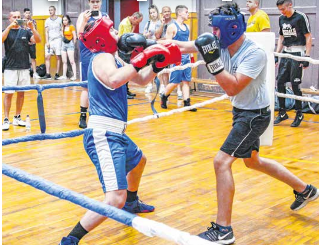
A pofonparti komoly versenyekre készítette fel a fiatal öklözőket.