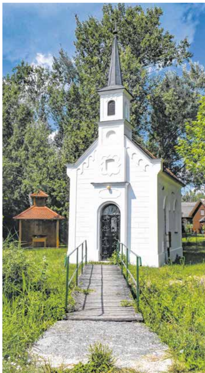
A virágosmajori kápolna a Fertő 1869-es kiszáradásának állít emléket – a fertőrákosiak ekkor száraz lábbal keltek át Boldogasszonyba a búcsúba. FOTÓ: PLUZSIK TAMÁS