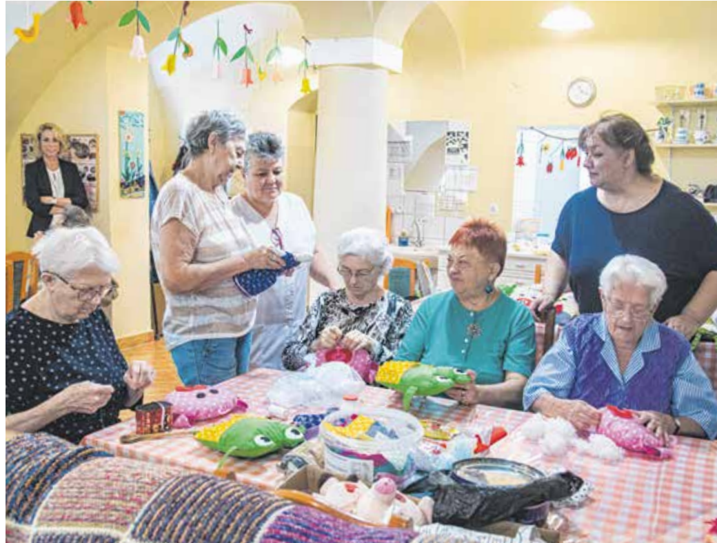
A Lila Akác Idősek Klubjának tagjai kedves figurákat varrnak, amelyeket gyerekek foglalkoztató intézményeknek adnak ajándékba.