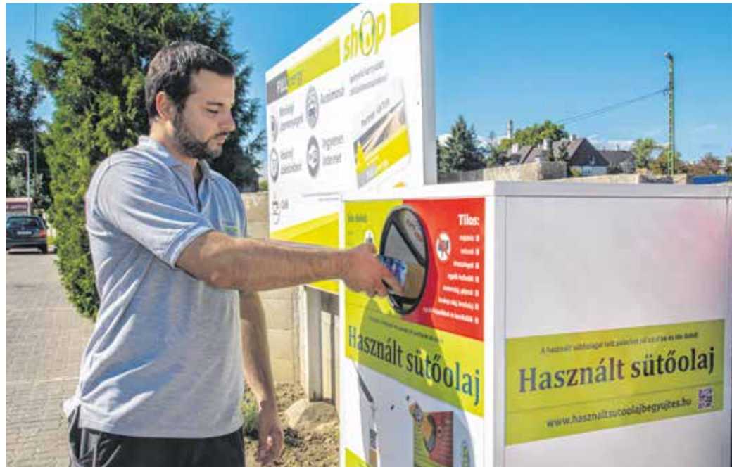
A Bánfalvi úti benzinkúton sokan leadják a használt étolajat – a szakember szerint a legjobb, ha műanyag palackban helyezük a konténerbe a veszélyes anyagot.