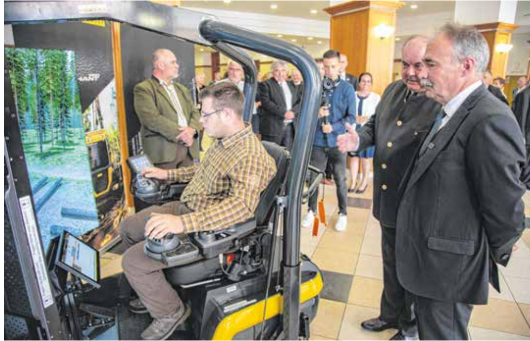
Az új erdészeti szimulátorok közül az egyik a soproni iskolába került, amelyet megtekintett dr. Nagy István (j) agrárminiszter is.