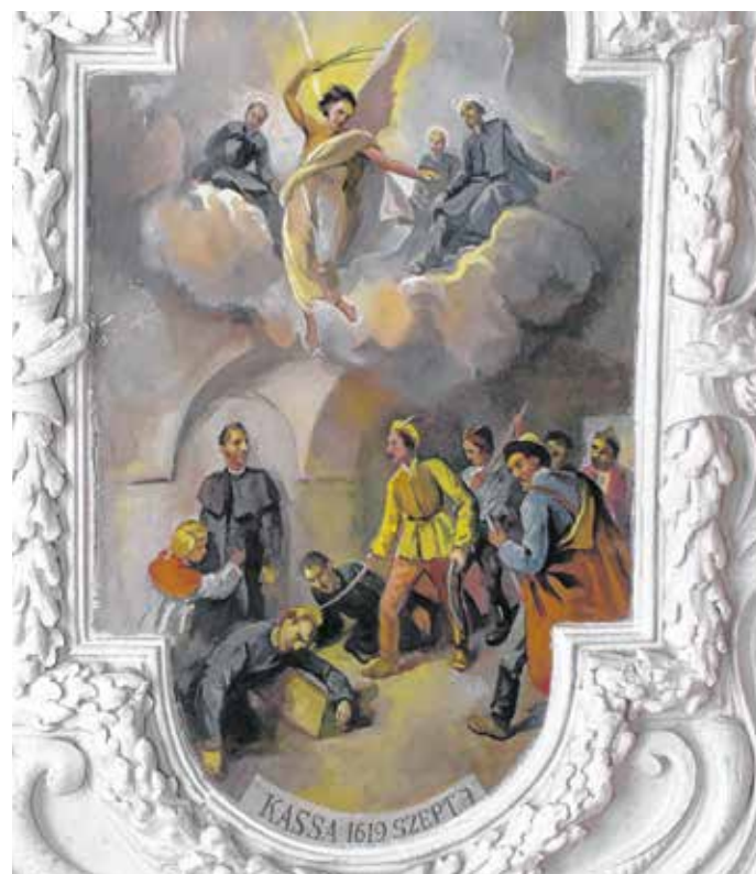
Wosinszky Kázmér falfestménye a kassai vértanúkról – a Szent György-templomban látható a kép.

Az eseményt a soproni Szent György-templom Borgia Szent Ferenc-kápolnájának mennyezetén lévő falfestményen Wosinszky Kázmér soproni festőművész örökítette meg.