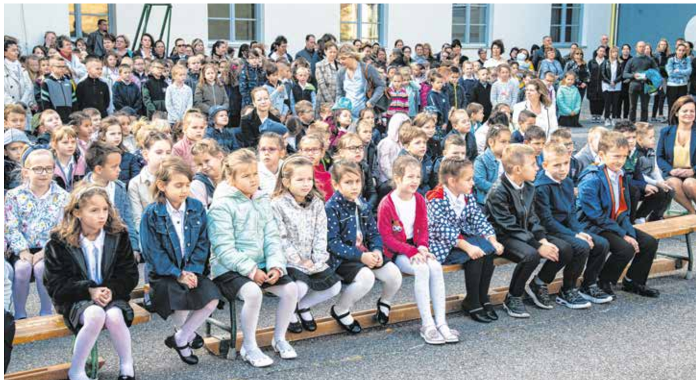
A Petőfi-iskolában 23 osztályban 605 diák kezdte az idei tanévet – nyáron több tanterem is megújult itt.