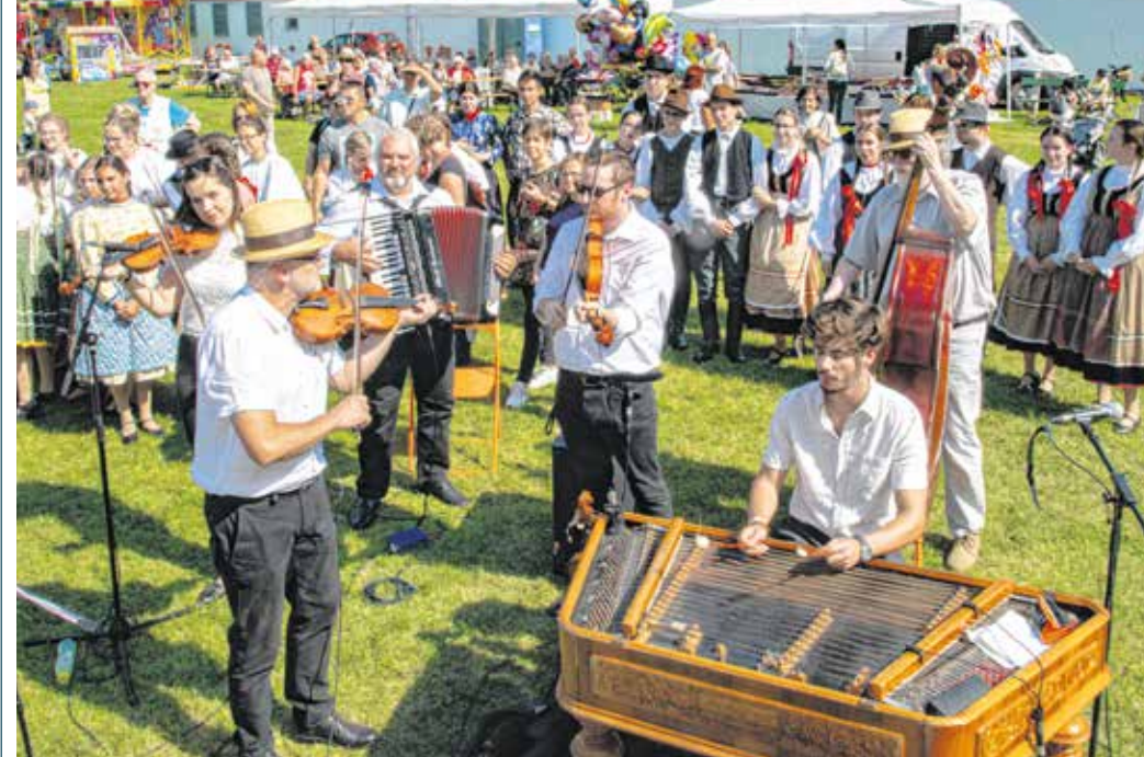
A népzene és a néptánc legkiválóbbjai léptek fel az Együtt a Jereván! programon.