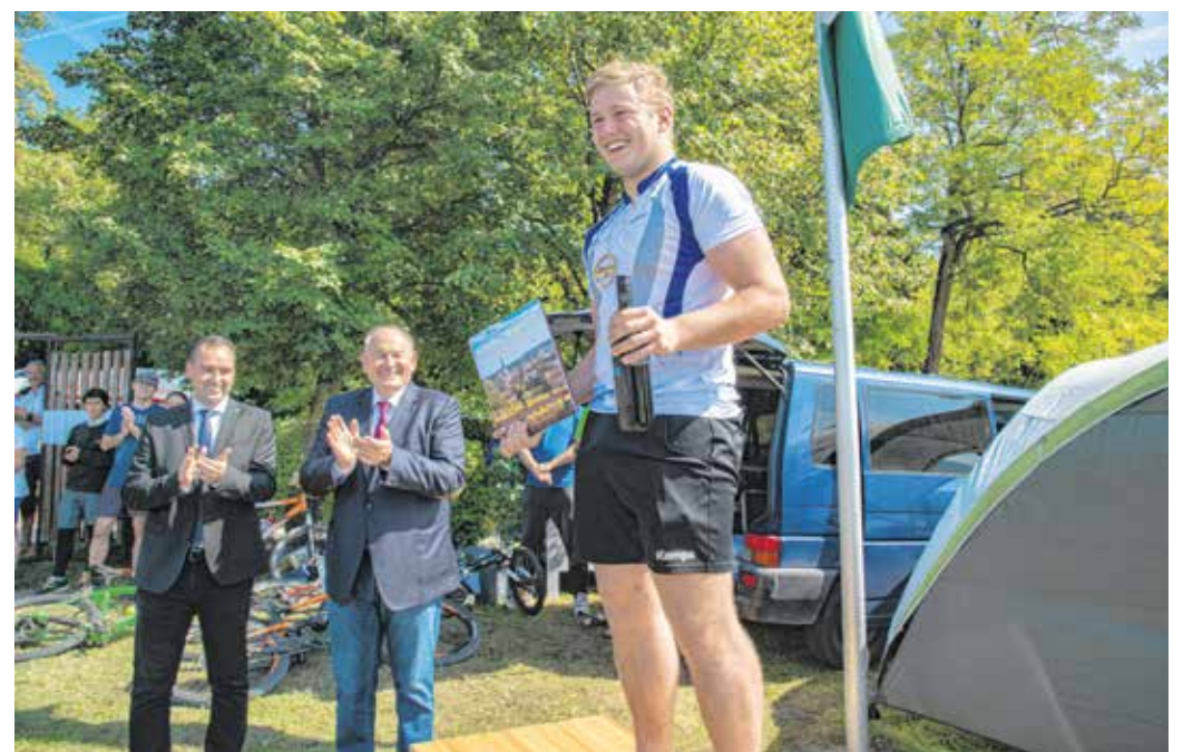
A Dudlesz-erdő kétnapos a tájékozási kerékpárversenynek adott otthont, Magyarországról és Ausztriából összesen százhusz versenyző érkezett.