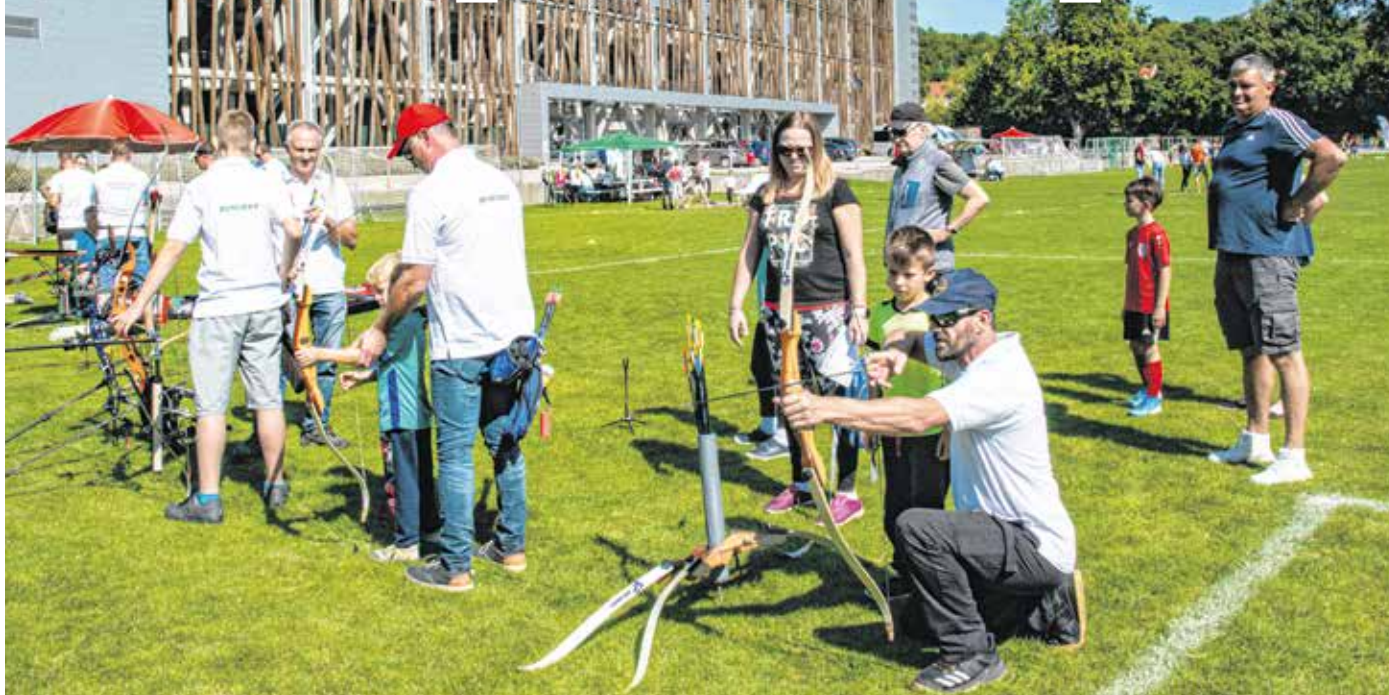
A Sportolj Sopron 2021-es rendezvényén összesen 32 sportág képviselői várták a fiatalokat.