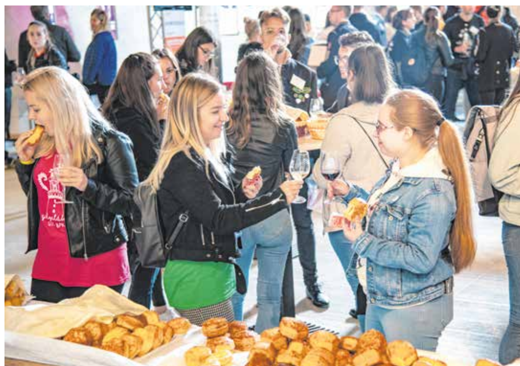
Az elsőéves egyetemisták megismerkedtek a soproni borászokkal és boraikkal.