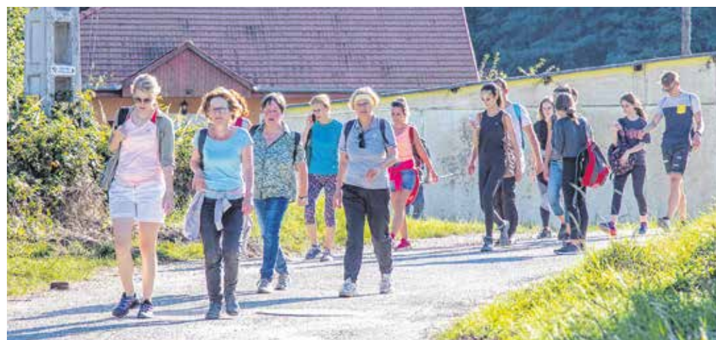
A gyalogtúra mind a három távja Brennbergbányán ért véget.

– A Perkovátz-Ház Baráti Köre 2004 óta minden évben az egykor volt Sopron vármegyei hagyomány szellemében rendez meg a