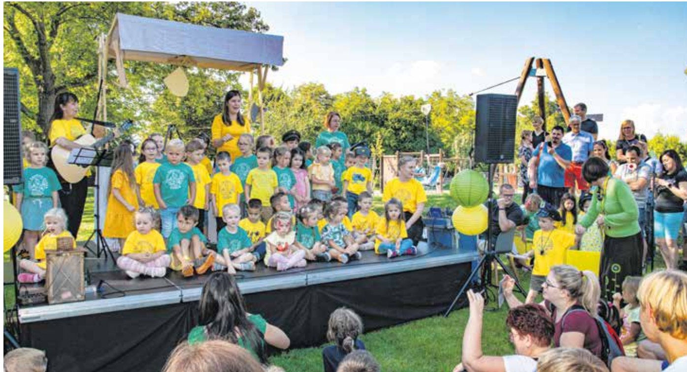
A családi napon a biztonságos közlekedésre is felhívták a gyerekek figyelmét.