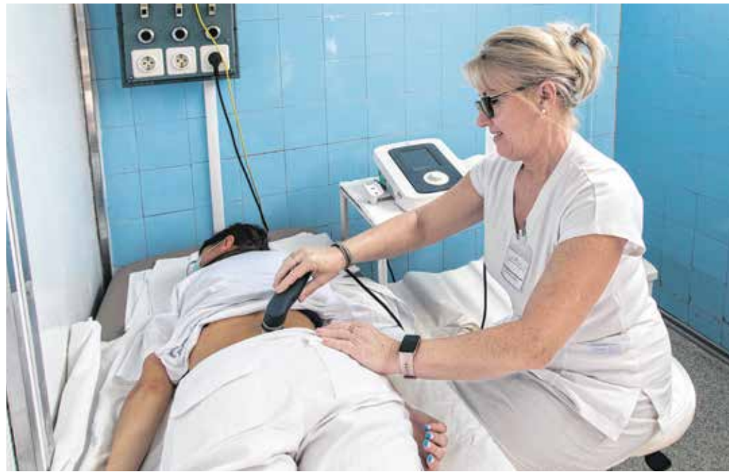
Ultrahangkezelés a balfi mozgásrehabilitációs osztályon – a szakemberek általában több fajta technológiát kombinálnak.

A fizioterápia az orvoslás egyik ősi ága. A szó a görög fűzosz kifejezésből ered, amelynek jelentése természet. A kezelések során a természet energiáit használják, így a fény, a hő, a víz, a környezet jótékony hatását. Fontos terület lett az elmúlt évtizedekben a mechanoterápia, amelyhez a gyógytorna, a masszázs, az ultrahang és a különféle trakciós (húzó) kezelések is tartoznak. Látványos eredményeket érnek el az elektroterápia különféle fajtáival, melyek többféle hatásmechanizmus mellett az izomműködést is stimulálják. A Soproni Gyógyközpontnak Balfon működik két mozgásszervi rehabilitációs osztálya, itt a fizioterápia nagy múltra tekint vissza.