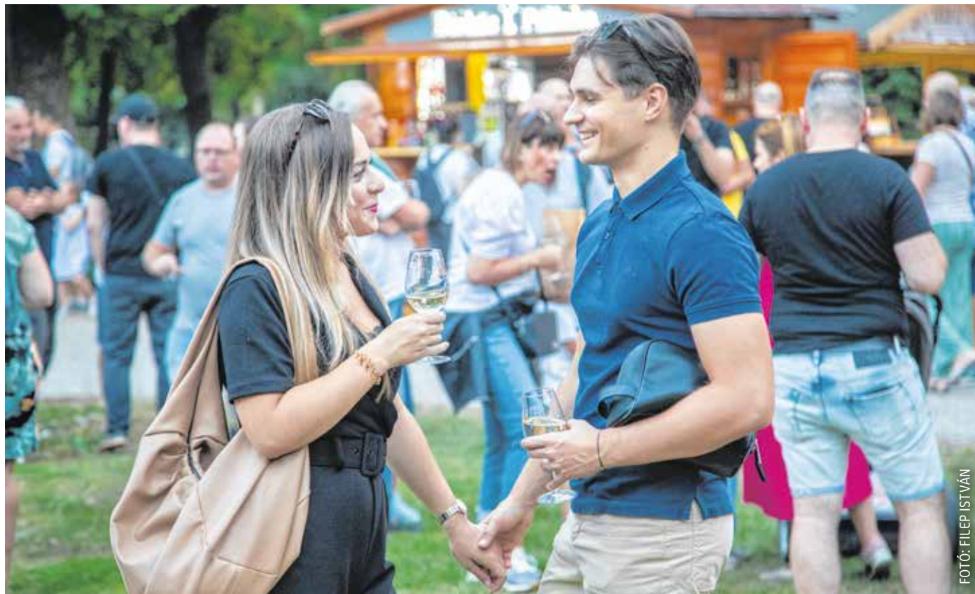
Harmadszor rendezték meg az Erzsébet-kertben a szüreti napokat – több mint 20 soproni borász kínálta portékáit a hétvégén.