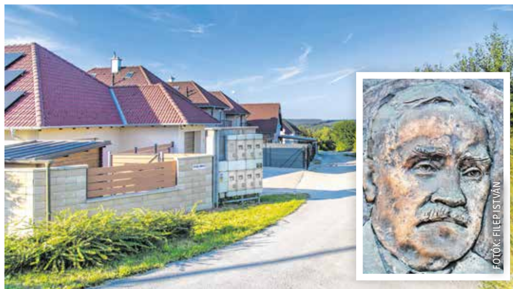
A Vendel Miklós utca az Aranyhegyen található, a Tárczy-Hornoch Antal utcáról nyílik.

A város északkeleti peremén 1988–1992 között épült fel az Ív utcai lakótömb. Az Aranyhegyen az első lakóépületek aztán az 1990-es években jelentek meg, a 2000-es éveket követően pedig, miután az utolsó téglagyár is bezárt, felgyorsult a terület beépítése. A gyárak megszűnésével a terület átalakult, az új utcák, útvonalak nem őrizték meg régi helyüket, inkább kis- és