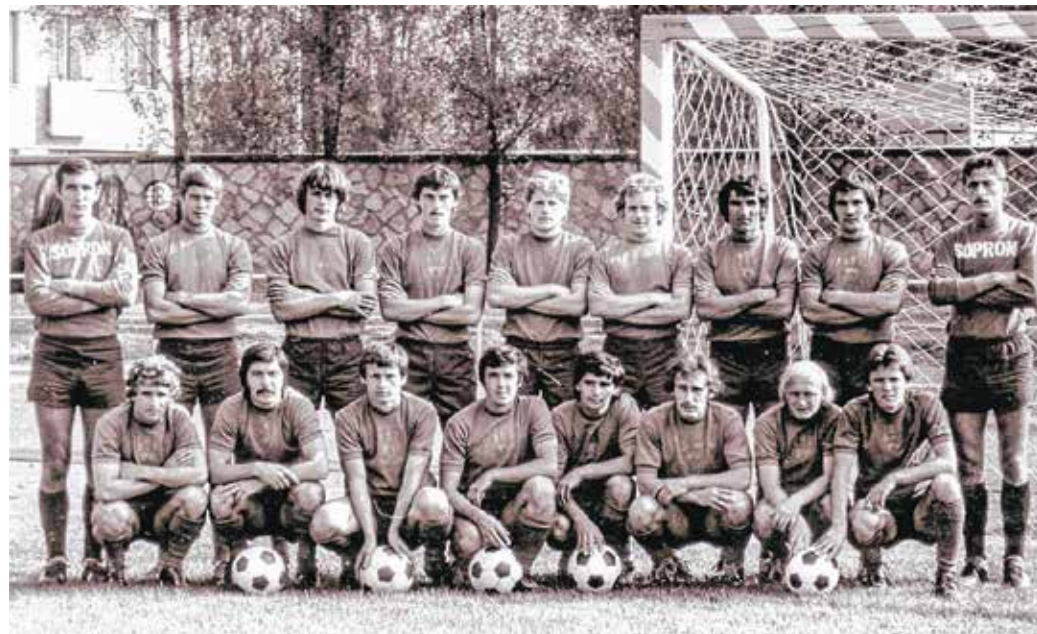
A Soproni SE megalakulása után az NB II-ben szerepelt a csapat.

„Ma délután négy órakor az STC pályán a soproni labdarúgás fejlődését minden bizalommal évekre meghatározó párvialdal kezdődik a Körmeny Dózsa FMTE és a soproni Textiles labdarúgói között. A tét nem kicsi: a két találkozó összehasonlított győztese ősszel a magyar labdarúgás második vonalában szerepel. Az STC játékosai most már nem kizárólag a klub,