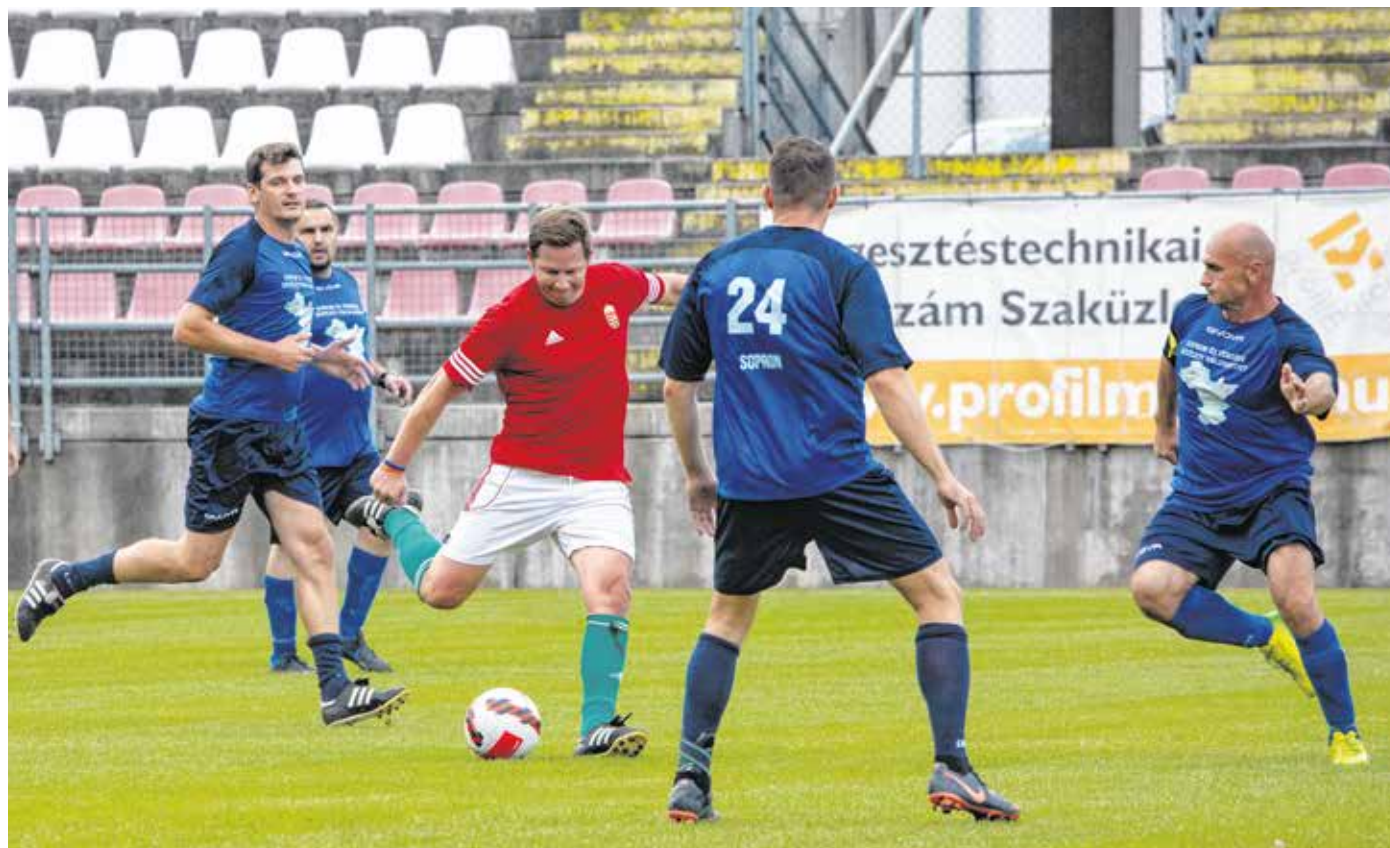
Izgalmas mérkőzésen 1-1-et játszott Sopron Közéleti Válogatottja és a Magyar Országgyűlés Válogatottja.

A mérkőzés ugyan barátságos volt, azonban már az első pillanatól kezdődően bővelkedett izgalmas helyzetekben. Végül a hazai csapat juttatta át először a labdát a gólvonalon – a közönséget