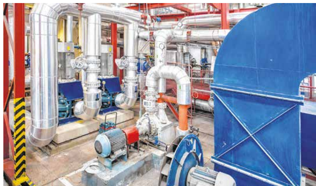
A távfűtés ára a lakossági fogyasztók számára nem változik – felvételünk a Sopron Holding Zrt. Hőközpont utcai telephelyén készült.

– A lakosság tekintetében a legnagyobb támogatási rendszer Magyarországon van. Ez azt jelenti, ha ma piaci áron kellene gázt vásárolni, az az átlagfogyasztásig 180 ezer forintba kerülne, ezzel szemben mintegy huszonezer forintba kerül – hangsúlyozta Gulyás Gergely.