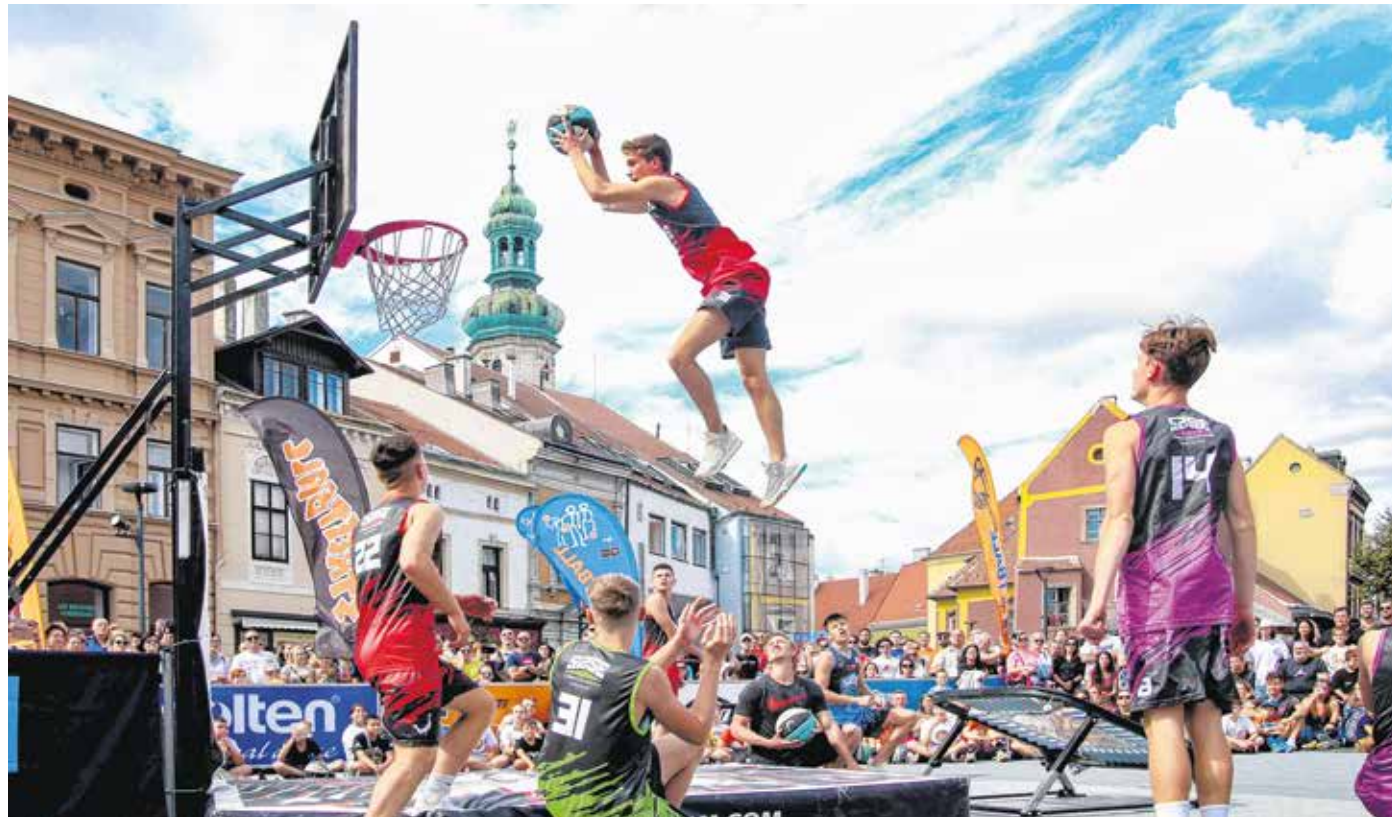
A délelőtti streetballmeccsek után akrobatikus bemutatót tartott a Face Team a Várkerületen.

A játékosok több korcsoportban mérhették össze tudásukat. Fehér Edit a Soproni