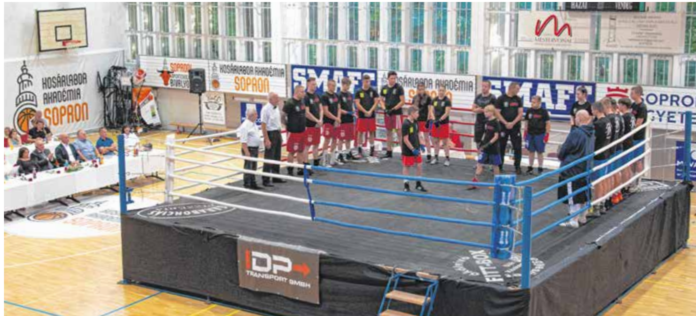
A Gyevát Gyula ökölvívó emlékgálán bemutató jellegű mérkőzéseket láthatott a közönség a Krasznai csarnokban.