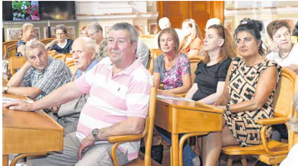
Idén is töbttucatnyian neveztek a Virágos Sopronért versenyre.

Évek óta hagyomány, hogy öt kategóriában (intézmények, lakóközösségek, családi házak, balkonok-erkélyek-teraszok, vállalkozások)