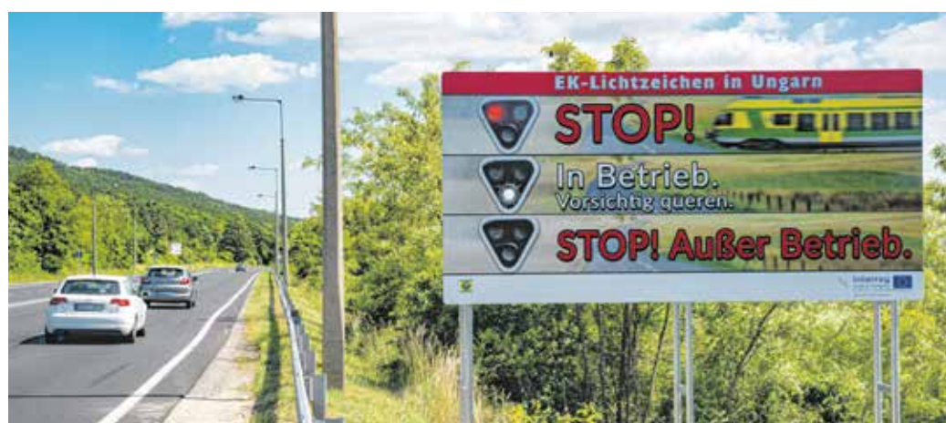
A villogó táblák hátoldalán napelem van, így önfenntartóak. Sötétben viszont nem világítanak, hogy ne zavarják a sofőröket.