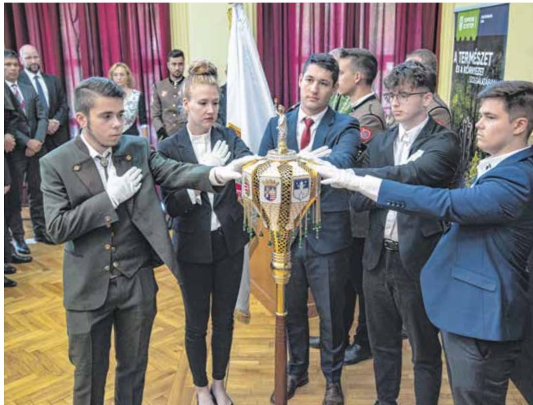
Az egyetemi tanévnyitó legünnepélyesebb része az elsőévesek esküvétele.

A tanévnyitón dr. Farkas Ciprián ismertette az egyetem alapításának körülményeit, szólott dr. Sopronyi-Thurner Mihály szerepéről is. – A Soproni Egyetemnek a város mindig is igazi otthonát biztosított – hangsúlyozta a polgármester.