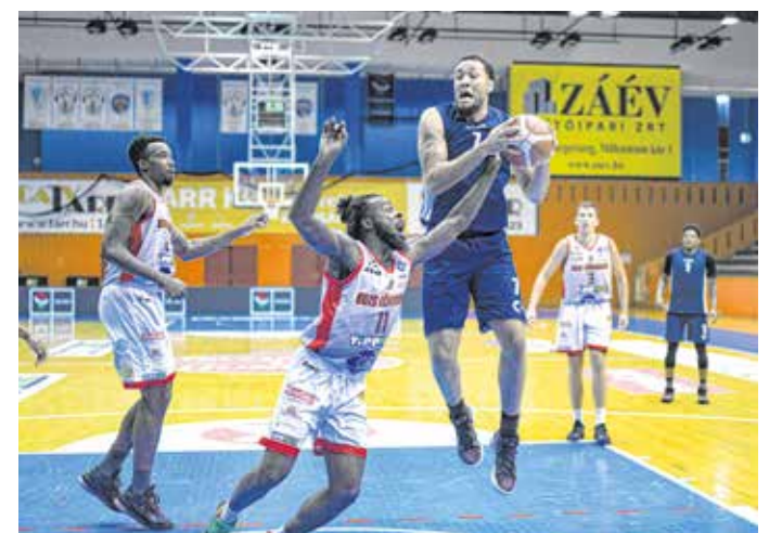
Múlt hétfő óta teljes kerettel dolgozhat az SKC edzői stábjá.