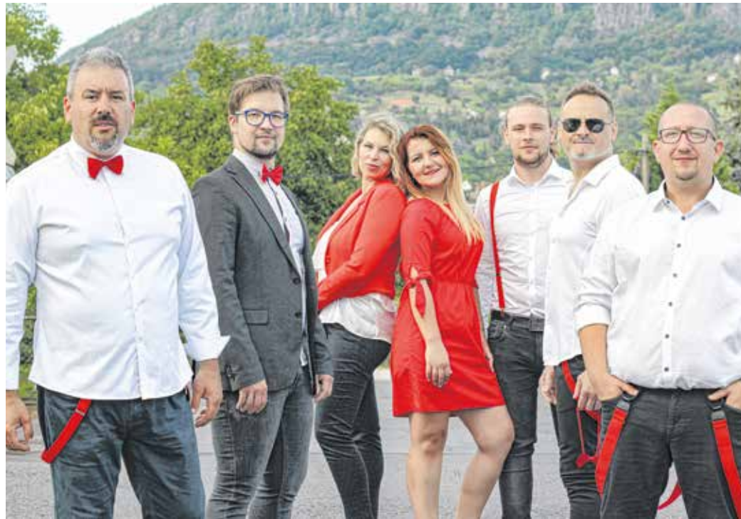
A tervek szerint november 20-án ismét Sopronban lép fel a HayDM Street.

– Számomra – de úgy gondolom, hogy a tagok is hasonlóan vélekednek