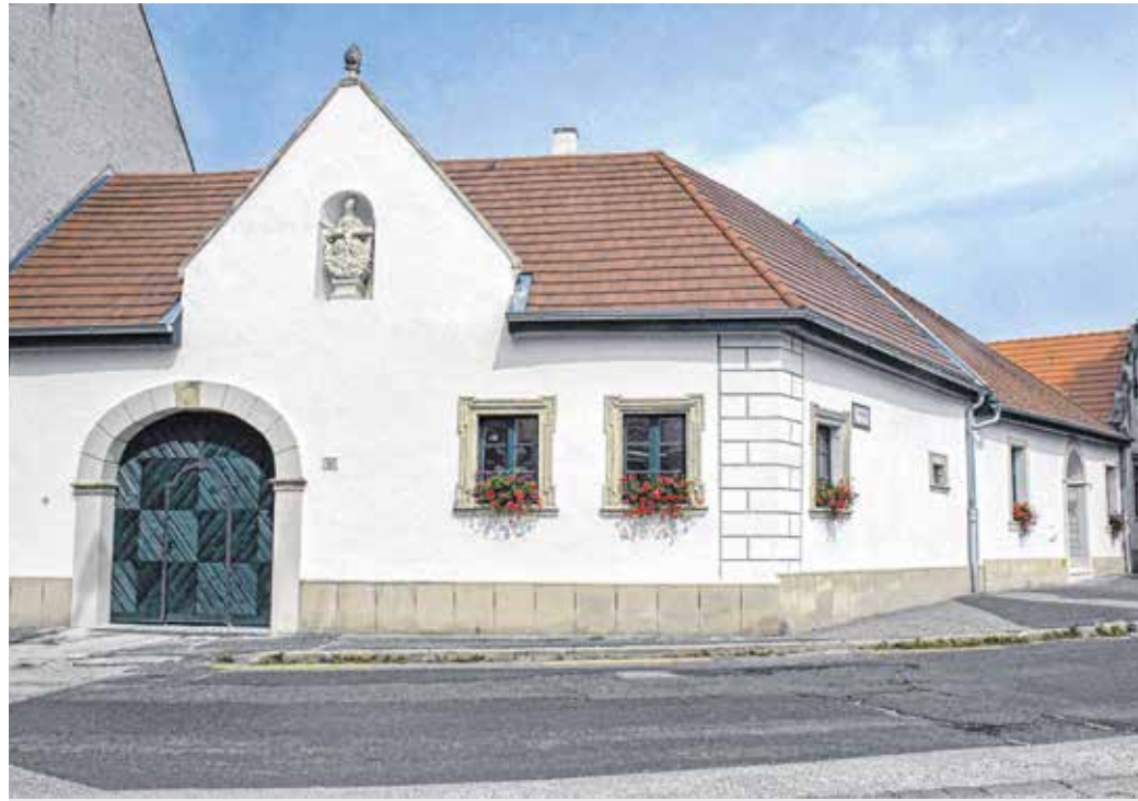
A Fövényverem utca 29. szám alatti házra kerül idén a Winkler Oszkár- emléktábla. Nemcsak a homlokzat újult meg, hanem a Szentháromság-szobrot is restaurálták.