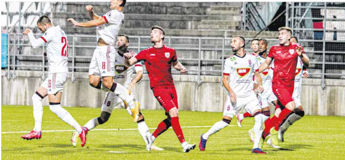
Bátran játszottak a soproniak az elsőosztályú Fehérvár ellen, de a bravúr nem sikerült.