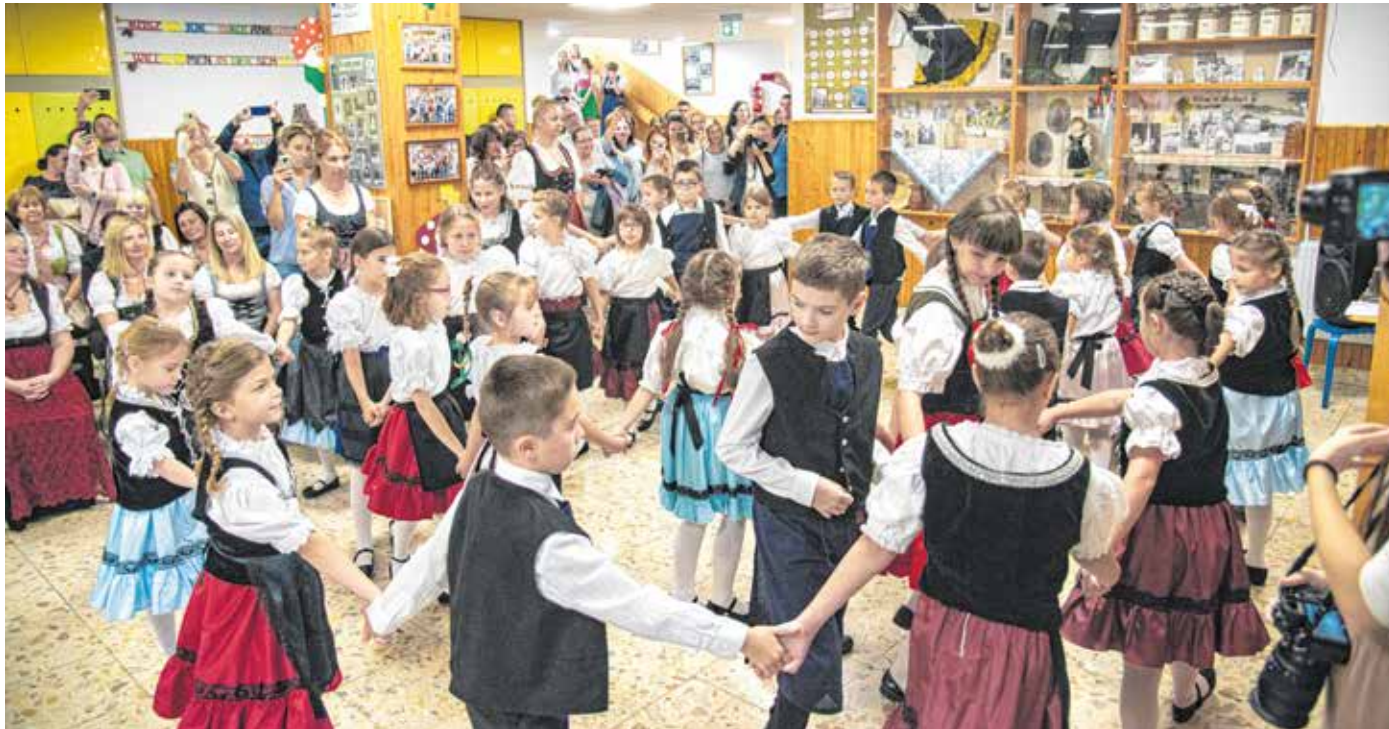
Az ünnepélyes átadón az iskola diákjai német nemzetiségi énekeket és táncokat is előadtak.