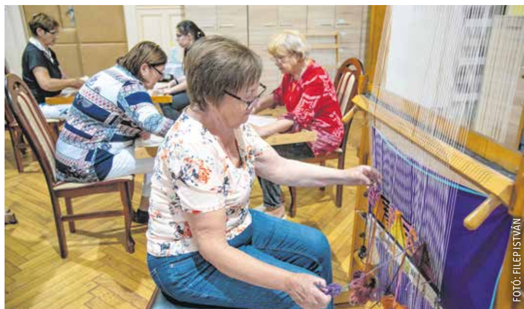
A Soproni Gyapjűzővők Alkotó Körének tagjai a pedagógusok művelődési házában gyűlnek össze.