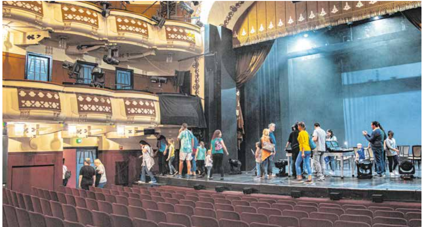
Felmehtek a színpadra, betekinhtek a kulisszák titokzatos, varázslatos világába a színházi nyílt nap résztvevői.