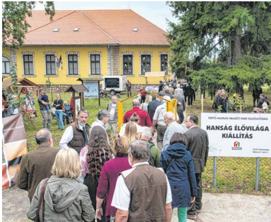
Öntésmajorban családi nappal ünnepelték, hogy 30 éves a nemzeti park.