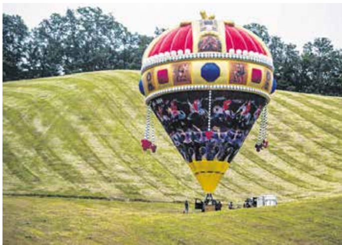
A Szent Korona hőlégballont a Mária-szobornál lehet majd megcsodálni vasárnap.