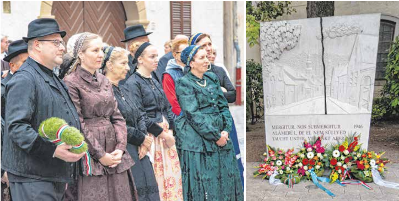
A kétnyelvű megemlékezésen több mint százán vettek részt, sokan német nemzetiségi öltözetben.