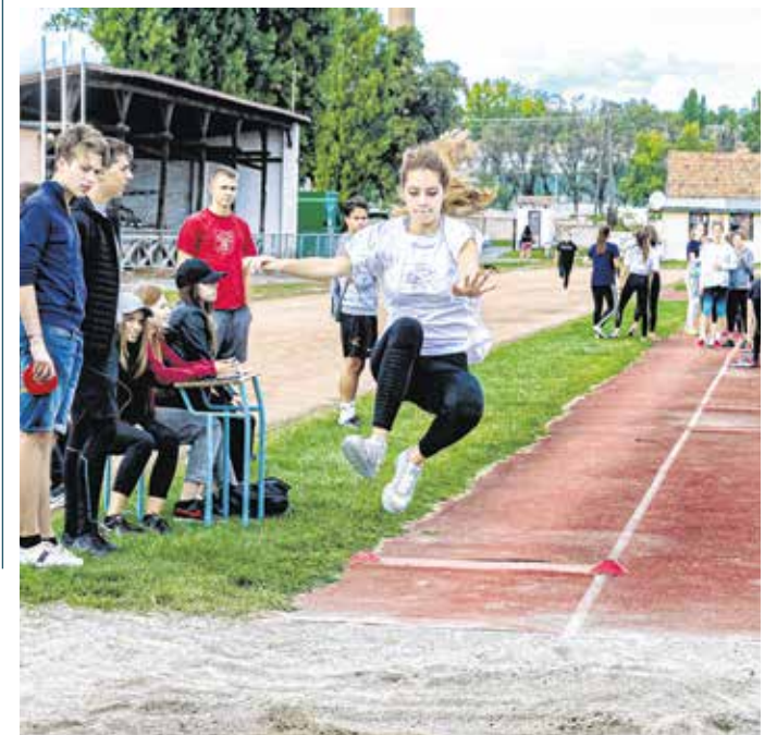
A Széchenyi István atlétikai emléktalálkozóra a város összes középiskoláját meghívta a szervező Széchenyi-gimnázium.