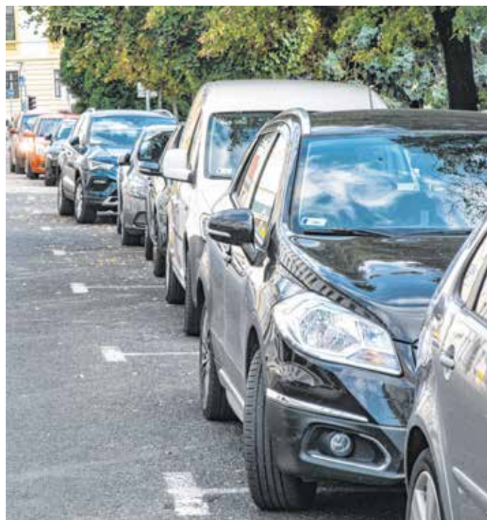
Parkoló autók a soproni belvárosban – októberben 1700 darab 2020-as bérlet jár le.

Az ingyenesség első szakasza tavaly július elsejéig tartott, a nyári hónapokban, illetve kora ősszel ismét fizetős lett a parkolás. Szeptember-októberben azonban ismét emelkedtek az esetszámok, így 2020. november 4-én újra bevezették a díjmentességet, amely idén május 25-ig tartott.