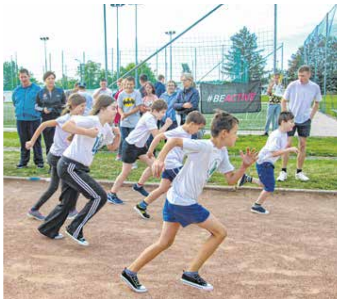
Az európai sporthét programjai csütörtöktől szerdáig tartottak Sopronban, a Kozmutza Flóra-iskola diákjainak kihelyezett testnevelés órát tartottak a Kurucdombon.