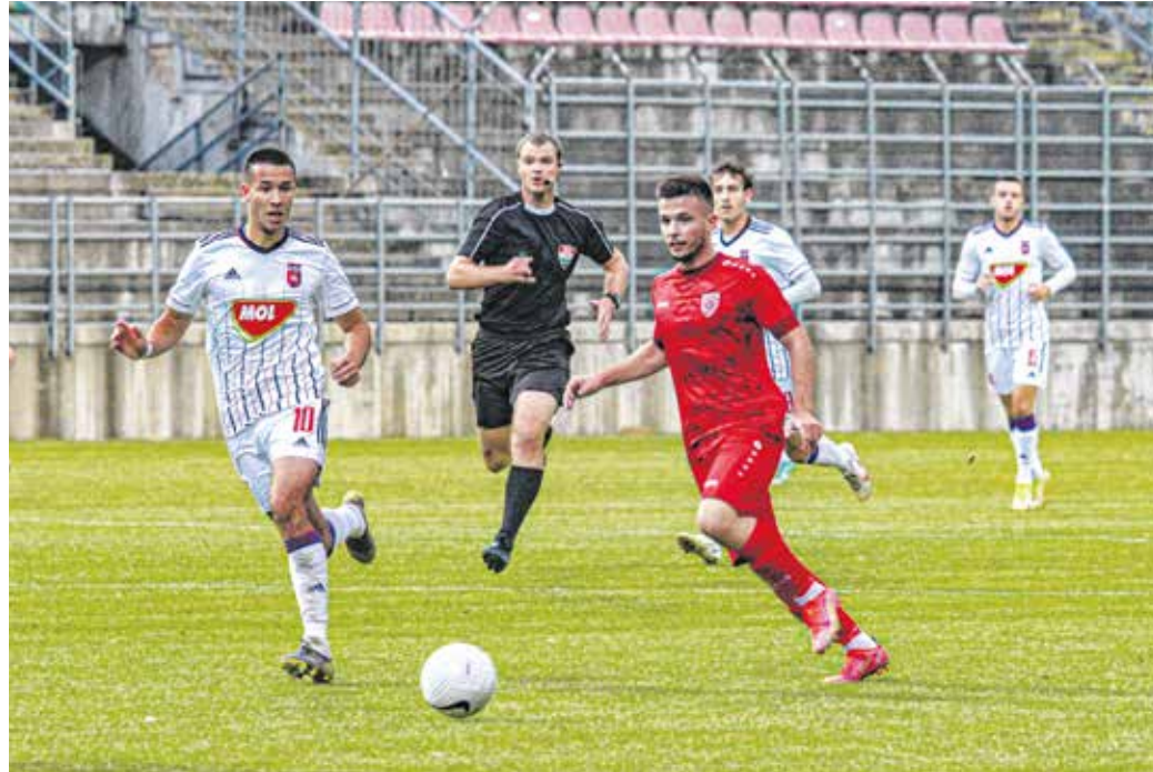
2–2-es döntetlennel zárult az SC Sopron Fehérvár II. elleni hazai mérkőzése.

A hétfői érdei mérkőzésre aztán sikerült átmenteni a gólerős formát, ami mellé a