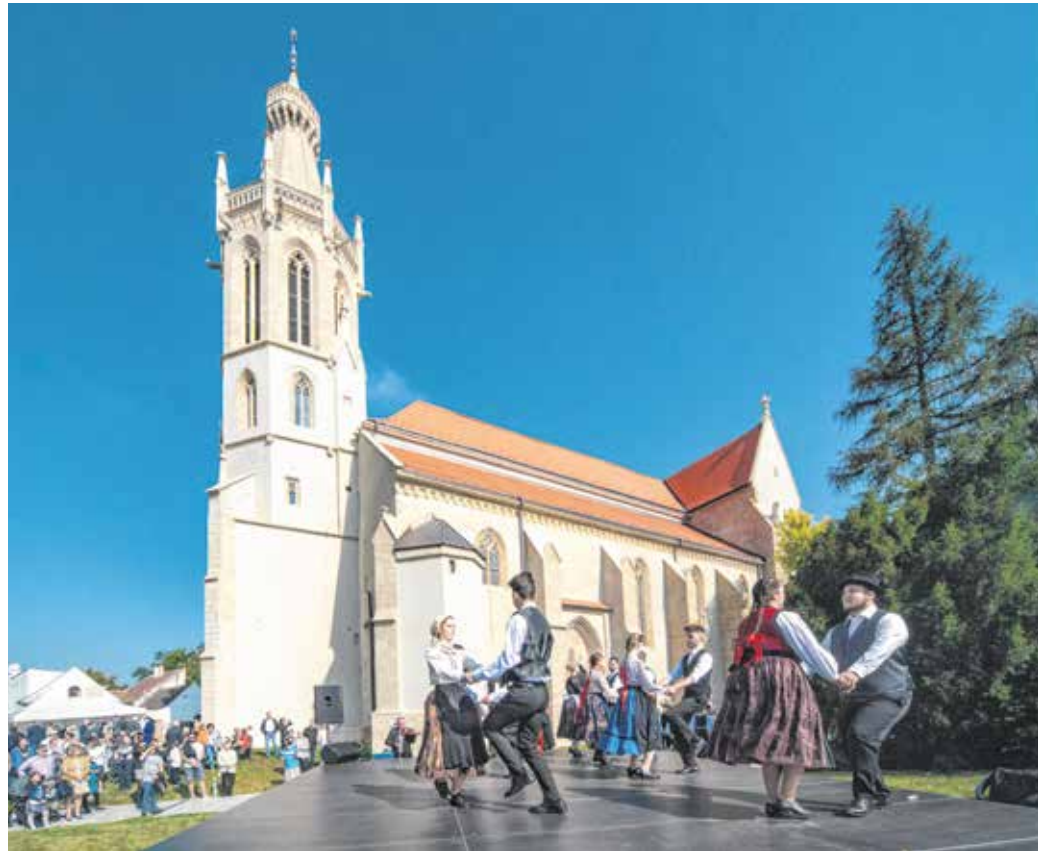
A Szent Mihály-napi búcsún a templom melletti színpadon felléptek a Petőfi-iskola, a Soproni Táncgyűttes és a Pendelyes táncosai, a zenét a Fajkus Banda szolgáltatta.

Barcza Attila kiemelte: az elmúlt időszak kihívásai ellenére bátran állítható, hogy Magyarország egy biztos