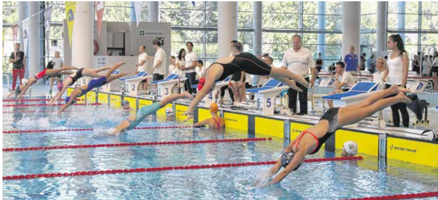
A soproni Lóver Uszoda első tesztversenyén 250-en álltak rajtköre.