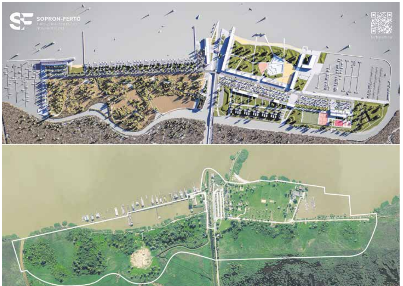
A felső látványterv a Fertő-parti beruházást mutatja be, az alsó a korábbi víztelepet, amelyen jelölik a felül is látható új csatornát.