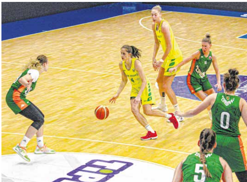
A Krasznai emlékmérkőzésen a Brno ellen nyert a Sopron Basket, a csapat szombaton 16.30-tól játssza első hazai bajnoki meccsét.

– Szívós csapat a Vasas Akadémia, kiváló játékosai vannak, akik ma is bizonyították, hogy ha nem kellő