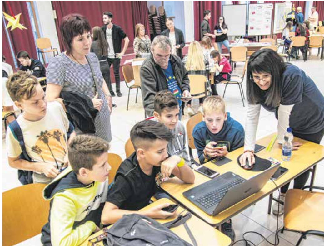
A rendőrség bűnmegelőzési foglalkozásain is sokan vettek részt az egyetemen.

A Széchenyi-gimnázium idén is csatlakozott a