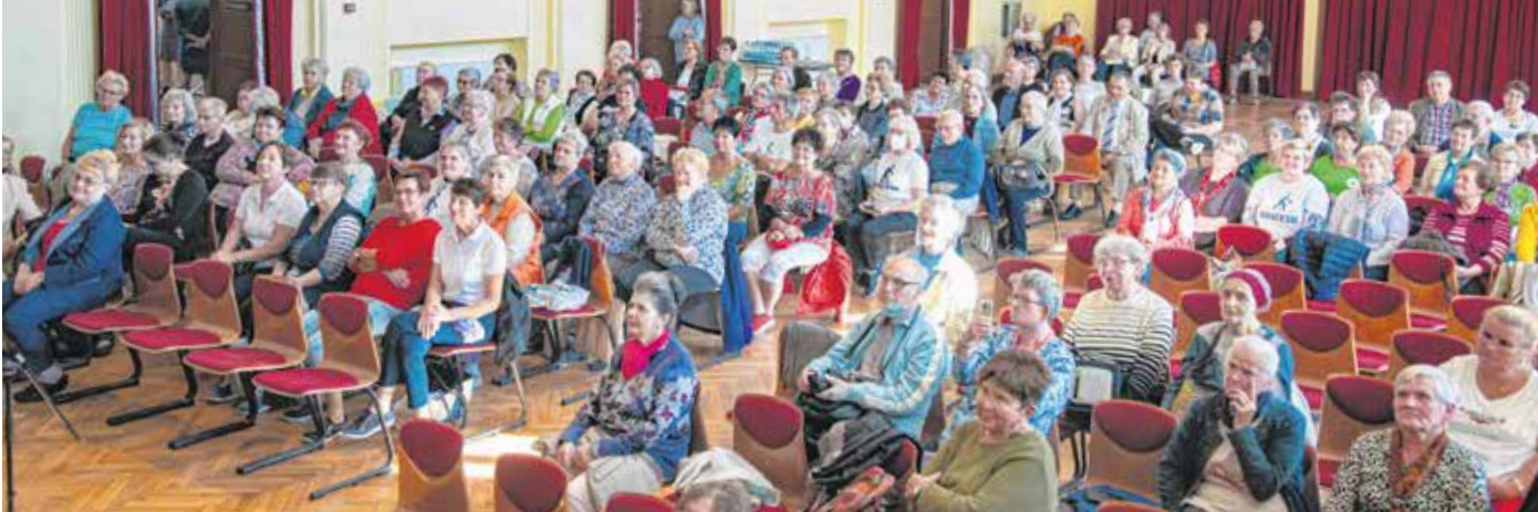
Népszerű volt a múlt heti nyugdíjas piknik – a GYIK Rendezvényházban sokan részt vettek a kulturális programokon.