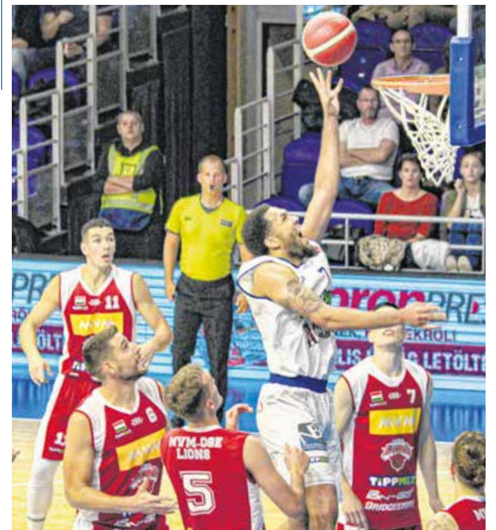
Az Oroszlány ellen győzött az SKC, a héten szerdán Szombathelyen lép pályára a csapat, majd szombaton a Paks látogat Sopronba.

A Falco KC – Sopron KC mérkőzést szerda este 6 órakor rendezik, szombaton pedig hazai pályán az Atomerőmű ellen lép pályára az SKC. Az ASE elleni találkozót október 2-án 19 órától rendezik meg.