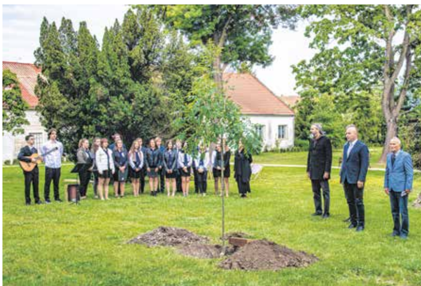
A Lenck-villa kertjében a Soproni Széchenyi István Gimnázium Öregdiák Társasága ültetett emlékfát, a Széchenyi-gimnáziumban pedig megkoszorúzták a gróf mellszobrát.