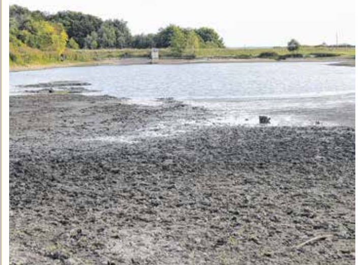
A száraz idő miatt kevés a víz a Gida-pataki tóban

Az ügyben megkerestük a tó fenntartóját, a Sopron és Vidéke Horgászegyesületet. Megtudtuk, 2007 nyarán építették ki a tavat, a kissé szélsőségesen viselkedő Gida-patak völgyének zsilippel ellátott keresztöltésével.