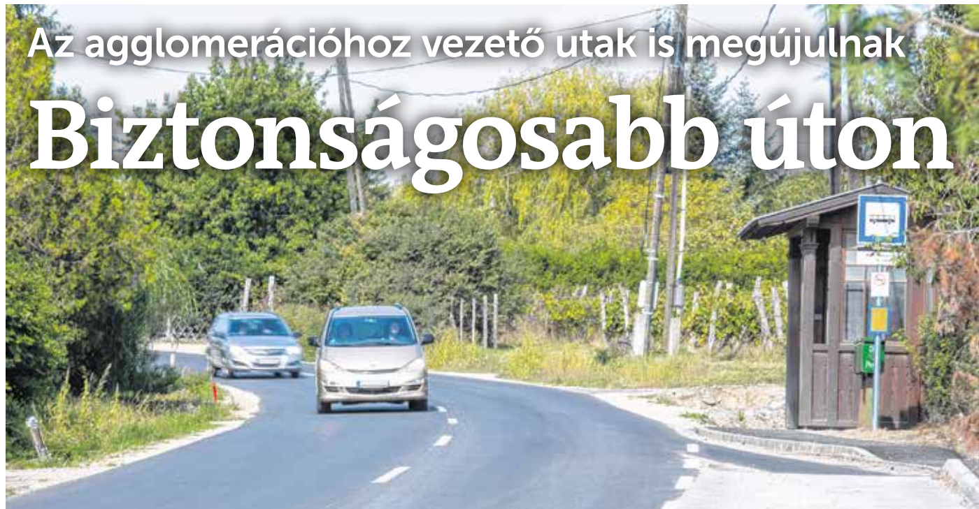
Nagy a forgalom Sopron és Balf között, ezért is fontos a mostani felújítás

A kitüntetéssel járó emléktáblát minden évben Sopron védőszentjének, Szent Mihálynak a napján helyezik el. Idén szeptember 29-én a vírushelyzet miatt nem tartottak ünnepélyes díjátadót.