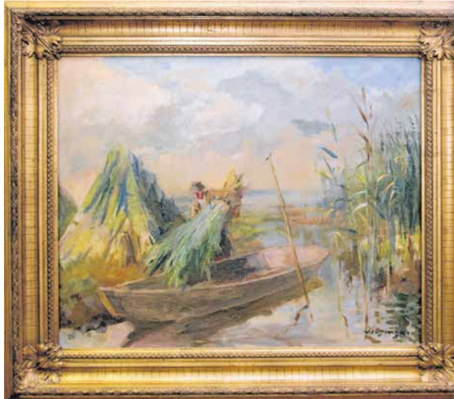
Wosinski Kázmér Nádatartás a Fertőn című képe