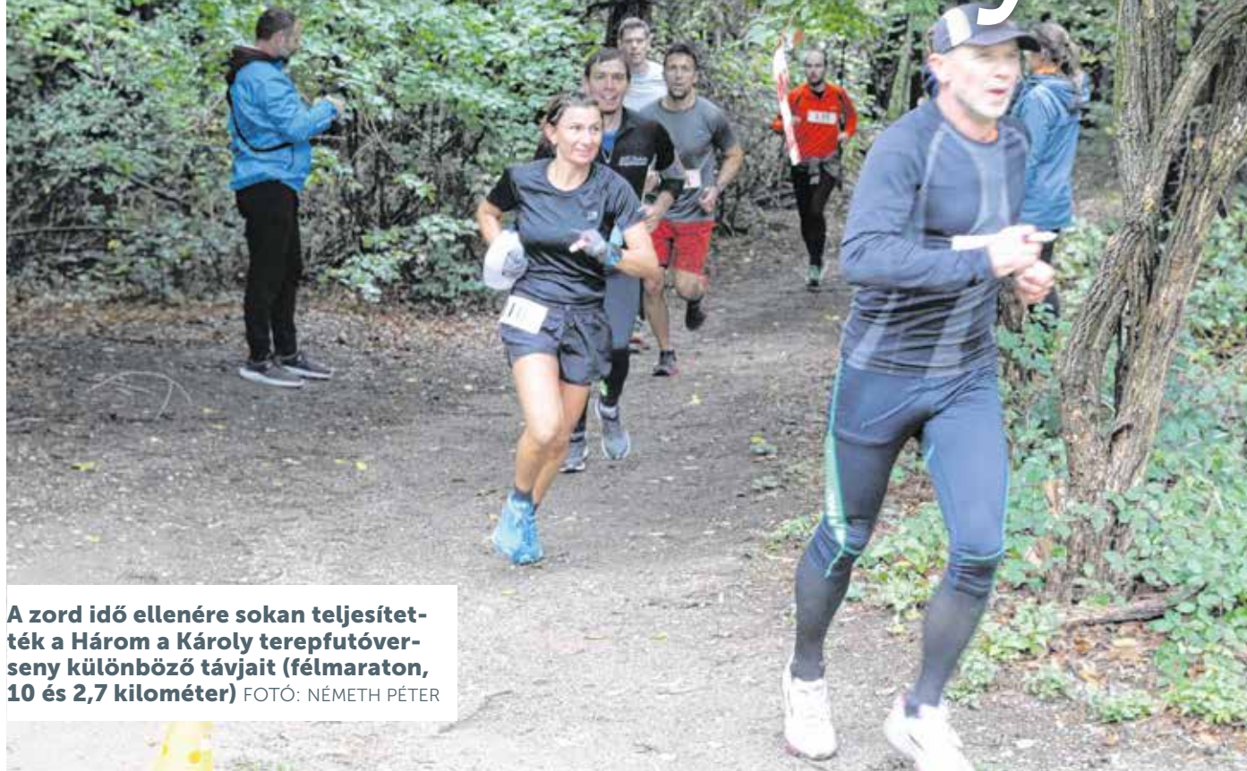
A zord idő ellenére sokan teljesítették a Három a Károly terepfutóverseny különböző távjait (félmaraton, 10 és 2,7 kilométer)