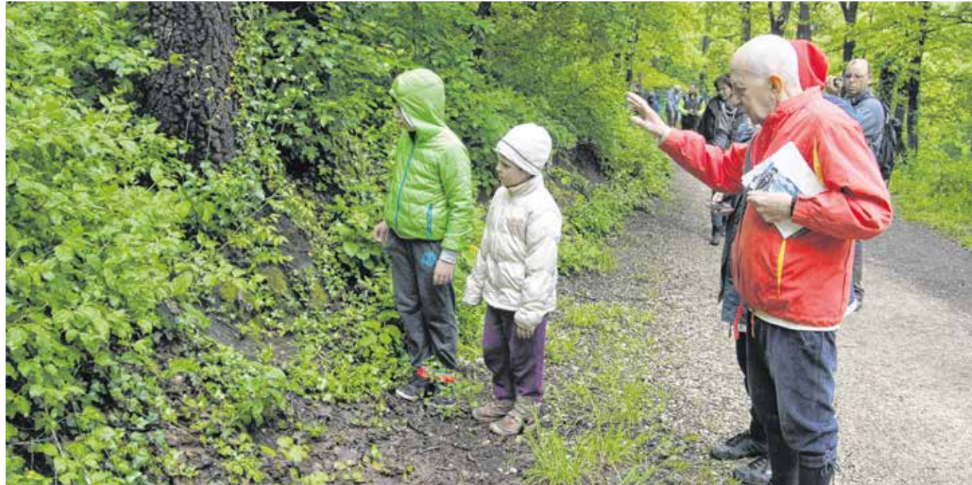
A Tanulmányi Erdőgazdaság Zrt. és a Soproni Városszépítő Egyesület 2008 óta minden év májusában szakvezetéssel hirdeti meg a Szárhalmi-erdőbe az orchideaturát. Az esemény idén a koronavírus-járvány miatt elmaradt.

A védett terület különlegessége, hogy élővilága a Keleti-Mészkö-Alpok és a Kis-Kárpátok mészhegyei között tölt be „hídszerpet”. Társulás- és fajgazdagsága kiemelkedő értéket képvisel. A virágos növényfajok