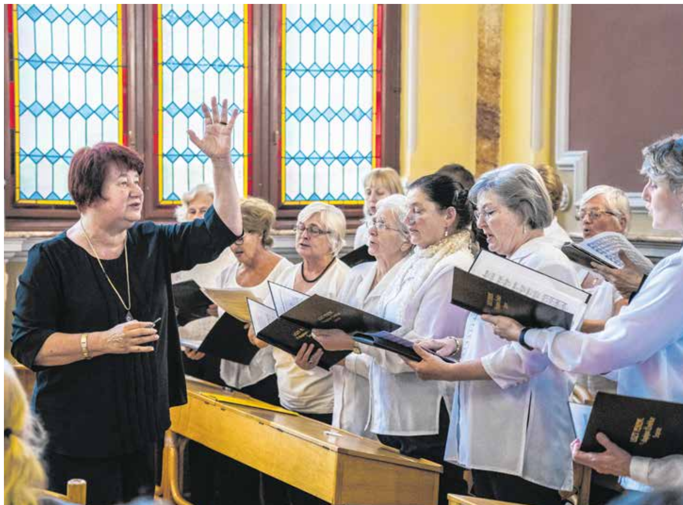
A Liszt Ferenc Pedagógus Énekkar legutóbb hétvégén, a testvérvárosi találkozón lépett fel – gőzerővel készül a kórus a jövő szombati jubileumi koncertre.