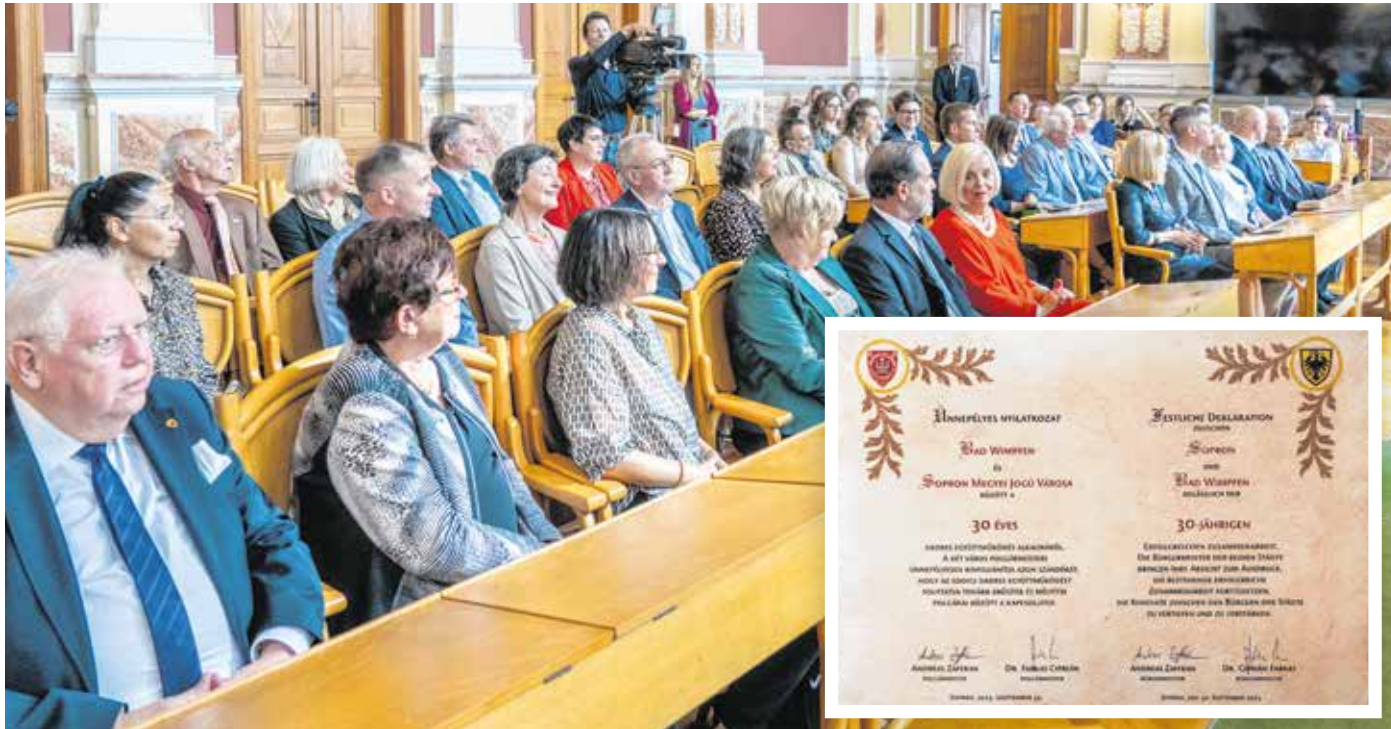
A Bad Wimpfen-i delegáció tagjai, valamint a soproni vendégek a testvérvárosi emléknapon.