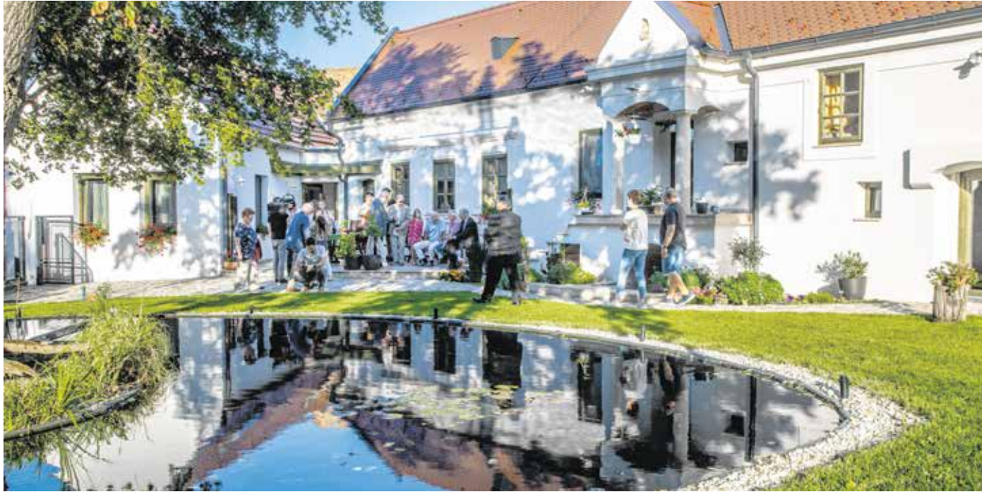
A Gesztenyés körút 9. szám alatti épületegyüttes Sopronbánfalva utolsó megmaradt népi építészeti emléke.