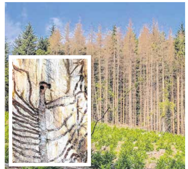
A Sopron környéki lucfenyvesekben végzett jelentős pusztításért a betűző és rézmetsző szű a felelős.

– A kilencvenes évek elején történt az első komolyabb pusztítás a környékünkön található lucfenyvesekben, amelynek az lett az eredménye, hogy a korábban az erdő mintegy egynegyedét alkotó lucfenyő napjainkra erősen visszaszorult, ma már csak néhány területen találkozhatunk vele – fogalmazott a rektorhelyettes. – A szűbogarak elsősorban a klímaváltozás miatt szaporodtak el. A jelenleg nem egyedülálló, a környező országokat, Ausztriát, Csehországot, Szlovákiát is érinti. A megmaradt soproni