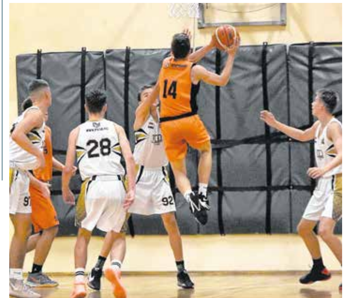
Az idei szezonban a Soproni Tigrisek SE U16-os csapata is a kiemelt bajnokságban szerepel.