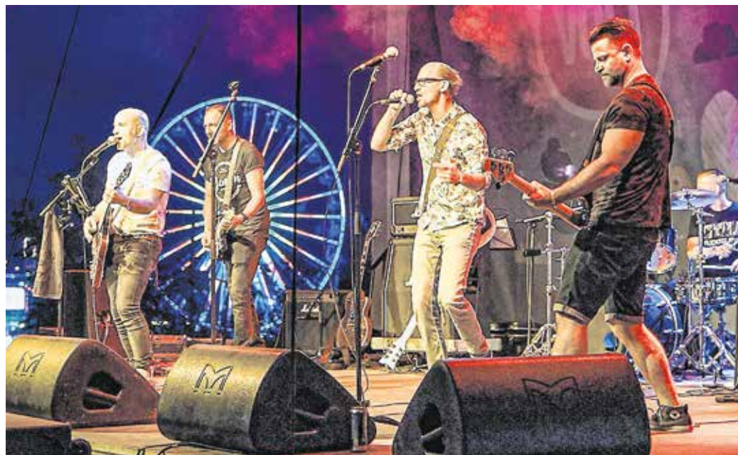
Az októberi koncerten a legnépszerűbb dalait adja elő a soproni Toolate.

– Ez sok zenész, zenekar életében így volt, de szerencsére azóta rendeződtek a dolgok. Így visszatekintve a pandémia viszonylag gyorsan eltelt a zenekar életében.