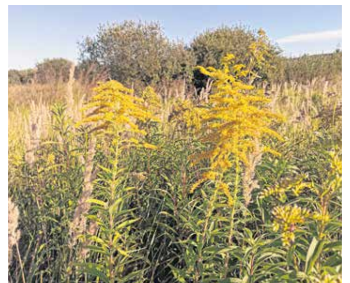
Az aranyvessző az egész országban jelen van, sokszor okoz problémát a védett területeken.

moly problémát védett területeken. A nemzeti park facebook-oldalán kiemelték: hazánkban a magas aranyvessző és a kanadai aranyvessző fordul elő. A növény hatékony, vegyszermentes visszaszorításának három módja lehetséges: a kaszálás, a szárhúzás és a legeltetés.