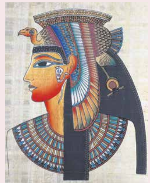
A legenda szerint Kleopátra rajongott a síma, bársonyos bőrért. FOTÓILLUSZTRÁCIÓ

Az ipari forradalom idején jelentek meg az első borotvák, amelyek megteremtették az otthoni kényelmes borotválkozás lehetőségét, így