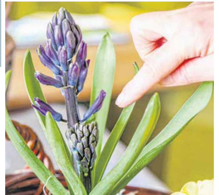
Ahhoz, hogy tavasszal ilyen szép legyen a jácint, most fontos a hagymák gondozása, ültetése.