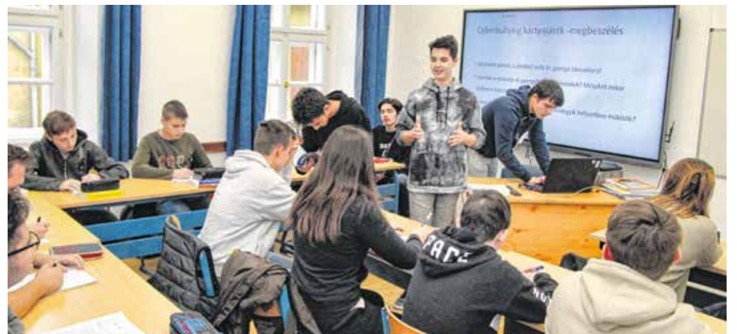
Az önkéntesek először a saját iskolájukban adják át a szükséges információkat.