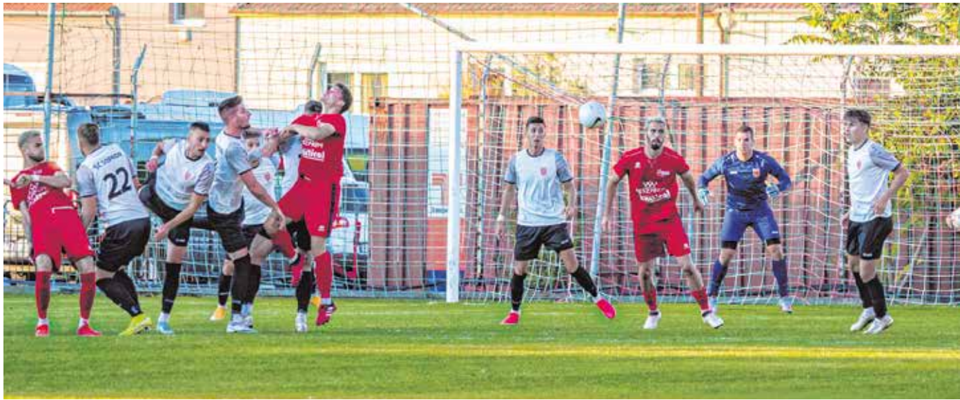
A jóval esélyesebb Veszprém ellen nyert hazai pályán az SC Sopron, jelenleg a nyolcadik helyen áll a tabellán.