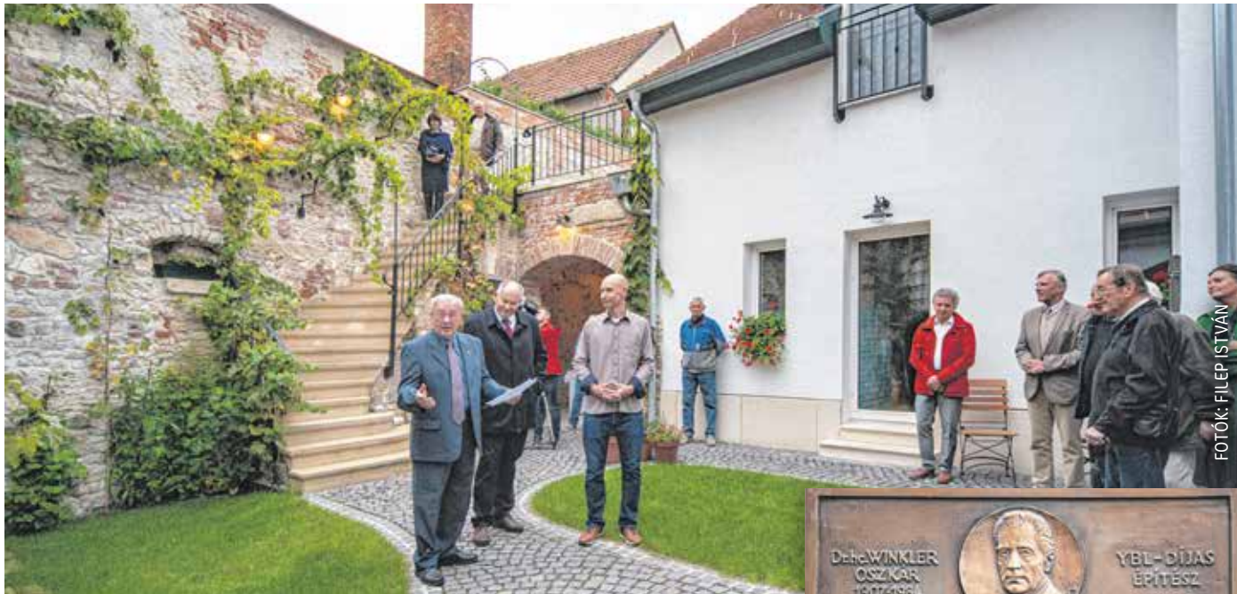
A felújításkor nagy hangsúlyt fektettek az eredeti stílusjegyek megőrzésére.