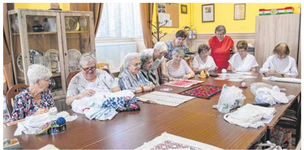
A Népi Díszítő Alkotó Körének tagjai a történelmi Magyarország területén megtalálható szinte összes népi hímzés készítésével foglalkoznak.