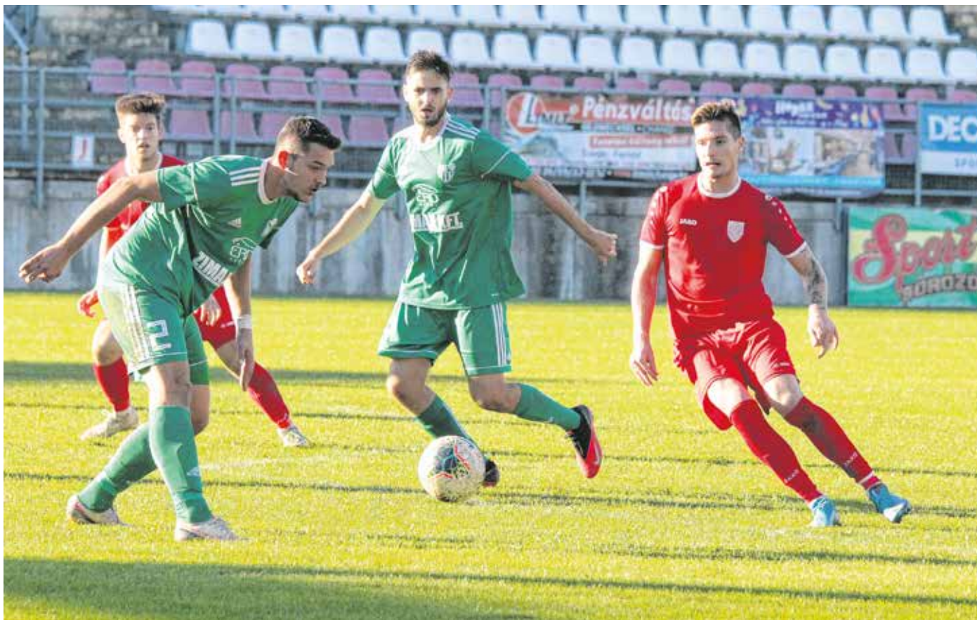
Végig magabiztosan játszva, az ellenfelet a mérkőzés egészében nyomás alatt tartva 2–1-es győzelmet aratott az SC Sopron az érdekek ellen