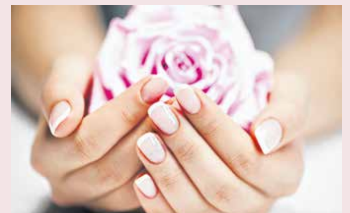
Minden alkalomra elegáns egy fehér francia manikűr