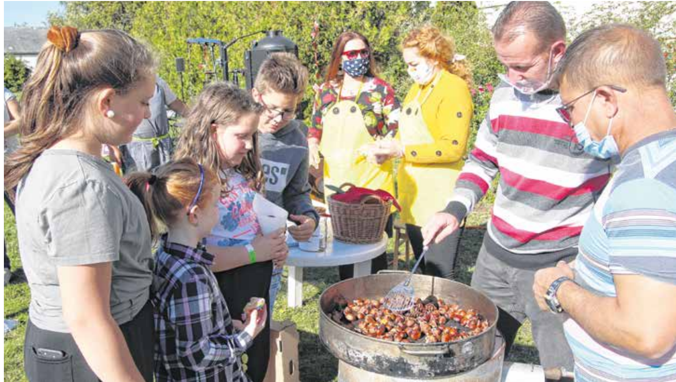
Népszerű volt a gesztenyesütés a bánfalvi hagyományos tökök gesztenye délutánon

A soproni és a környező erdőkben őshonos tiszta állományú gesztenyések nem egészen százhektári területet tesznek ki, ám ennél jóval nagyobb területen találkozhatunk szelídgesztenyefákkal, hiszen remekül megférnek a bükkösök és a tölgyesek mellett, illetve számos magánkert feltett növényei – tudtuk meg dr. Varga Mária növényvédelmi szaktanácsadótól. A gesztenyésekben a 90-es években komoly károkat okozott a kéreggrák elnevezésű betegség, ám egy hatékony biológiai védekezésnek köszönhetően a soproni állományban sikerült a járványt megfékezni. A hazai gesztenyésekben 5–6 évvel ezelőtt jelent meg a Kínából származó gubacs-darázs, amely szintén megtámadta az állományt. Sopronban tavaly találtak néhány fertőzött példányt a szakemberek, a további szaporodásukat megakadályozására a természetes ellenségét, a fűrészdarazsot telepítették be.