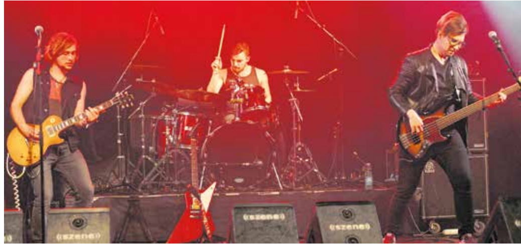
A Simple Mindset legtöbb dala angol nyelvű – a banda tagjai külföldön is szeretnének bizonyítani

– Jelenleg nagy elánal demókat készítünk azokról a dalokról,