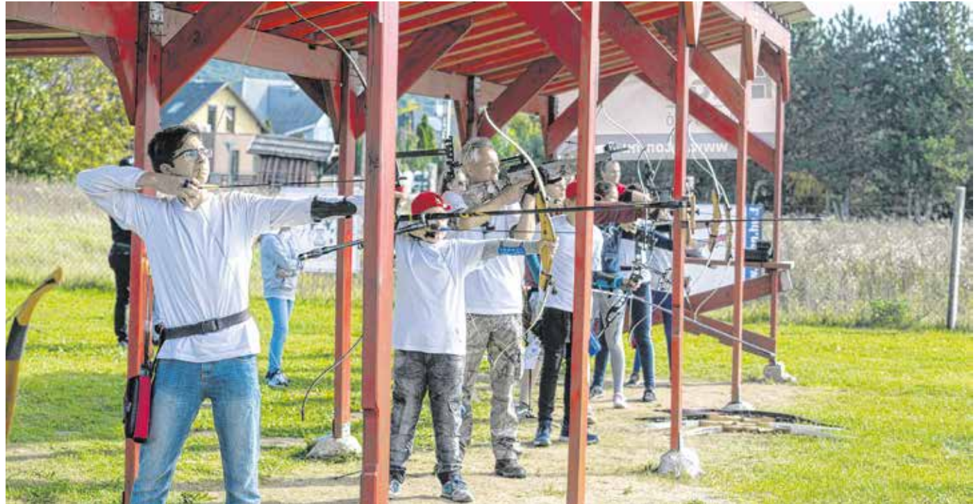
Az ünnepélyes megnyitó után azonnal birtokba vették az íjások az új pályát

– Az íjászat a nemzeti kulturális örökségünk része. Emellett azt is tudjuk, hogy Sopron igazi polgárváros, nemzeti sportváros, és arról híres, hogy nagyon erős a civil háló, amelyben rengeteg alkotó energia rejlik – tette hozzá