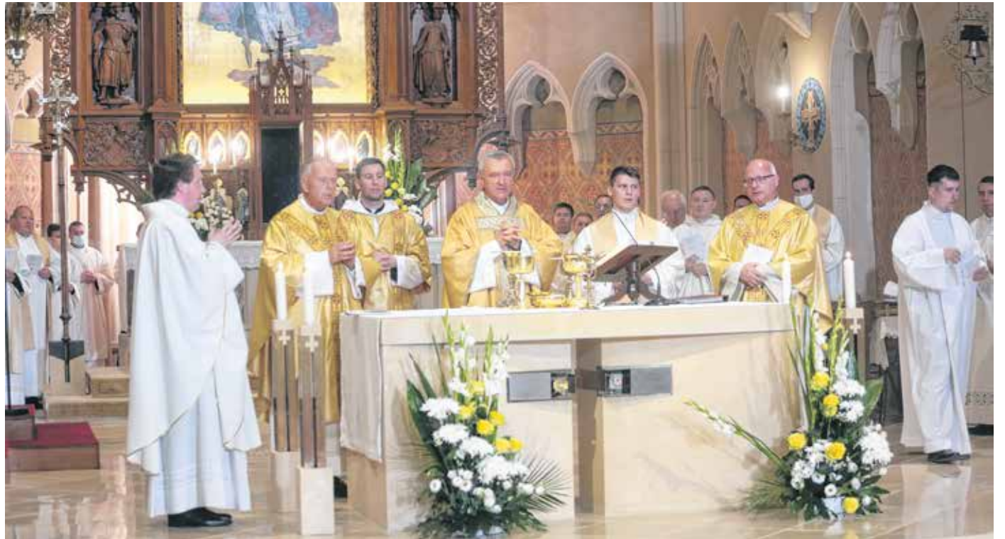
A templomot a város papságának közreműködésével dr. Veres András szentelte újra

HORVÁTH TAMÁS: Még csak kívülről láttam a felújított templomot, de az biztos, hogy igazán pompás lett. Főként sötétedéskor, illetve éjszaka szép, amikor a díszkivilágításnak köszönhetően „új arcát” mutatja. Talán más városokból, településekről is érkeznek majd vendégek Sopronba, hogy ezt megnézhessék. A város turizmusának is jót tehet, hogy koncerteket is rendeznek majd itt.