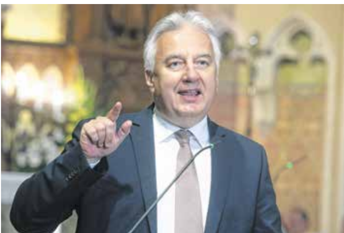
Semjén Zsolt miniszterelnök-helyettes ünnepi gondolatai után felolvasta a miniszterelnök levelét