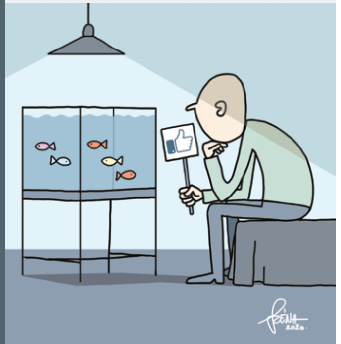
Szénási Ferenc (Széna) soproni karikaturista alkotásai hétről hétre.