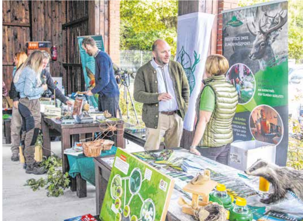
Az erdőpedagógia iránt érdeklődő óvónők, tanárok a standokon természetközeli játékok, programlehetőségek közül válogathattak a múlt csütörtöki rendezvényen.