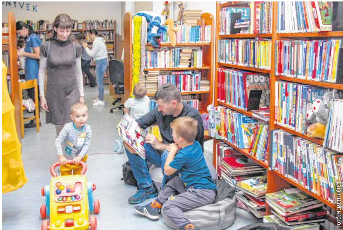
A könyvtárban rendszeresen szerveznek interaktív gyermekprogramokat is, hogy megszerettessék az olvasást a legkisebbekkel.