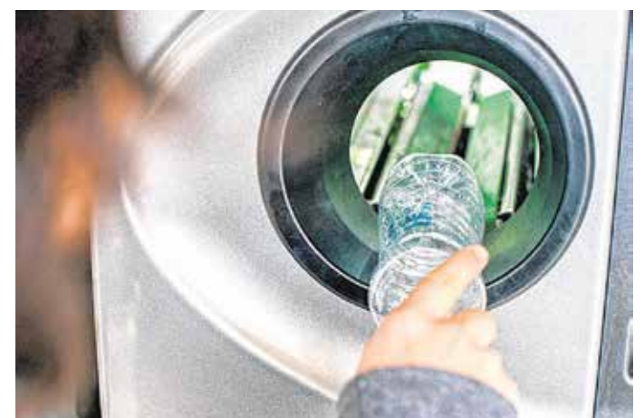
Az automatákba PET-palackok, sörösdobozok, italosüvegek is kerülnek 2024. január 1-jétől. FOTÓILLUSZTRÁCIÓ

Január elsejétől Magyarországon is működik a kötelező visszaváltási rendszer – közölte az Energiaügyi Minisztérium. Az üres palackokat automatákba dobhatjuk majd.