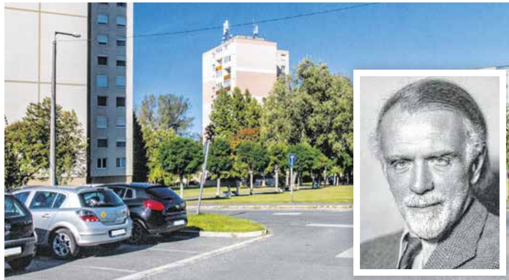
A Jereván-lakótelepen az épületek kivitelezése 1971-ben kezdődött.

Sopron város újkori történetének legnagyobb méretű építőprogramja az északnyugati városrész-lakótelep létrehozása volt. A településrészt az örményországi testvérvárosról Jerevánnak nevezték el. A házgyári épületek mellett alagútzsalus (outinord) rendszerben épült lakótömbök egészítik ki. A korábban mezőgazdasági művelés alatt álló területre – még korábban Ziegel-dűlőre –, azaz az Ibolya rétre 1969-ben hirdettek tervpályázatot. A terület alatt húzódtott viszont az úgynevezett Bánfalvi-galéria, ami biztosította a város vízellátásának egy részét. A lakóépületek kivitelezése 1971-ben kezdődött, majd kicsivel később a soproni vízellátó rendszerbe bekapcsolták a fertőrákosi vízművet. A földmunkavégzés és terprendezés során régészek