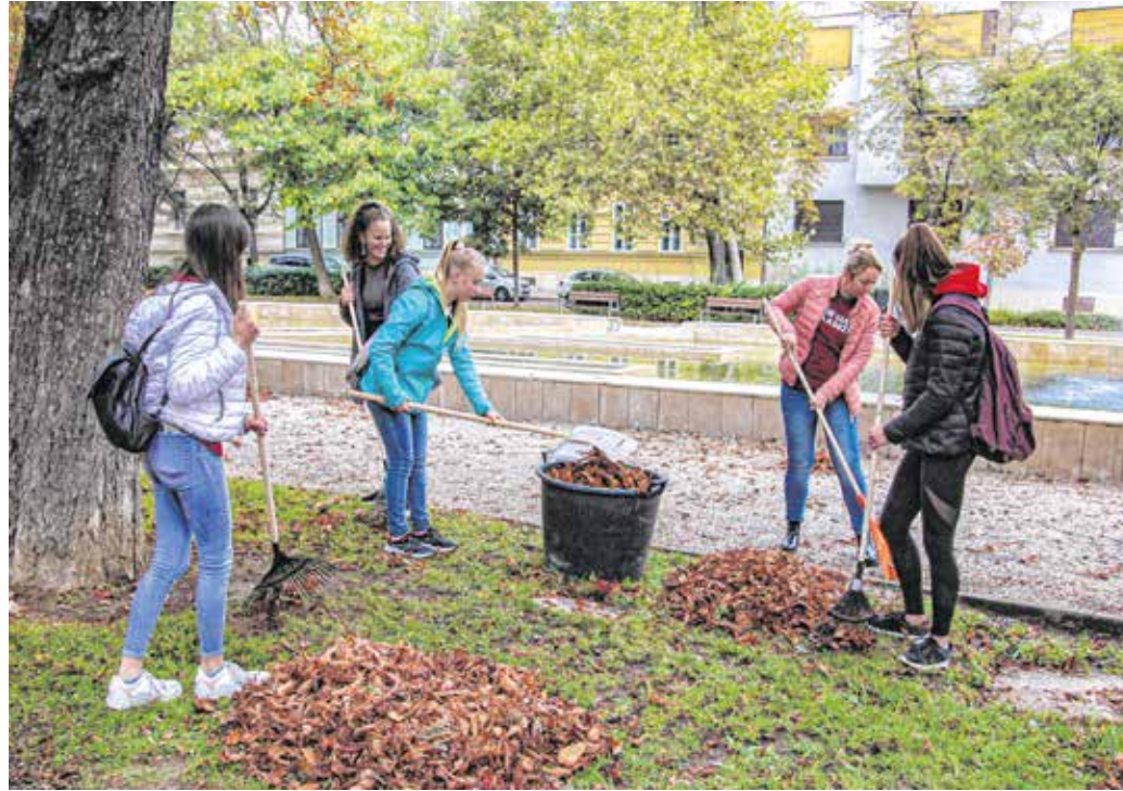
A Deák teret is megtisztították szombaton az Eötvös-iskola diákjai.

A 72 óra kompromisszum nélkül egy szociális önkéntes akció, amelyet a három történelmi keresztény egyház szervez. Magyarország fiatalosságát hívták közös összefogásra, hogy együtt tegyenek másokért, környezetükért. Az országos kezdeményezéshez Sopron 14. alkalommal csatlakozott, a program főszervezője a kezdetek óta Barcza Attila, Sopron és térsége országgyűlési képviselője. Az idei munka péntek délután vette kezdetét: közel ötven önkéntes plébánialomtalanítást végzett, illetve egy szociális intézmény kerítését festette. Szombaton kora reggel az Eötvös József Evangélikus Gimnázium, Egészségügyi Technikum és Művészeti Szakgimnázium 140 diákja gyülekezett a Deák téren, hogy munkájával szebbé