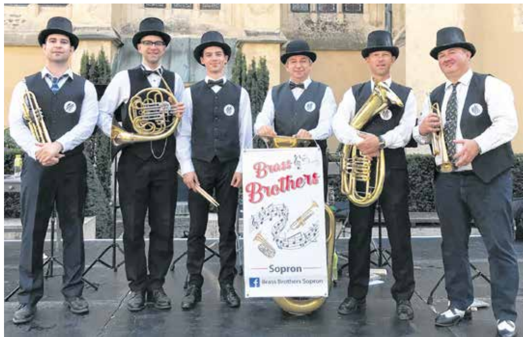
A Brass Brothers már tizennyolc éve játszik a közönségnek, azzal a céllal jött létre, hogy megőrizze a környék fúvószenéi hagyományait.

A Brass Brothers már a karácsonyi koncertre készül, amit idén talán ismét élőben