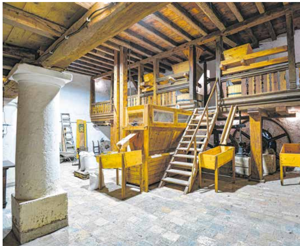
Minden szögből lefotózták a Kárpáti malom belsejét és külsejét is – így készült el a 3D-s képtár.