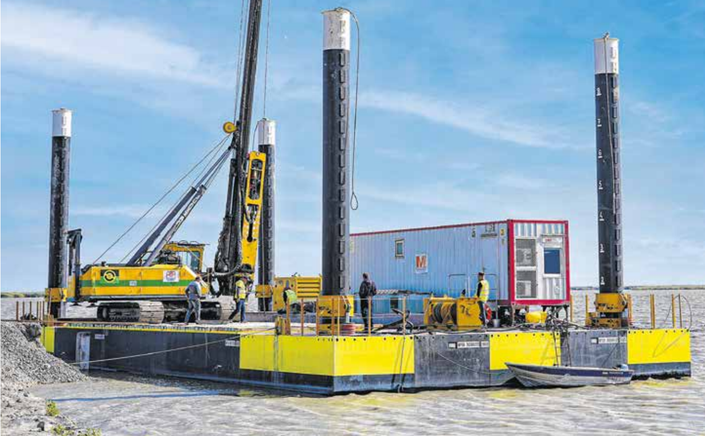
Az úszómű négy sarkán több méter magas oszlopok láthatók. Ezek a berendezés rögzítésére, kihorgonyzására szolgálnak.

A vitorlás- és horgászcsónak-kikötők védőmólóit alakítják ki jelenleg a Fertő-parti fejlesztés déli részén. Ezek a kikötők védelmére szolgálnak, hogy a szél és a hullámok ne tegyenek majd kárt az ott lévő hajókban. A móló alapját adja az a cölöpsor, amelyet most építenek. Összesen mintegy háromszáz vasbeton