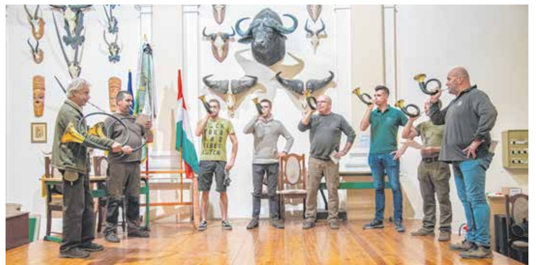
A vadászkürtösök keddenként találkoznak a Kísalföldi Agrárszakképzési Centrum Lackner Kristóf utcai kollégiumában. Itt autentikus környezetben gyakorolhatnak.