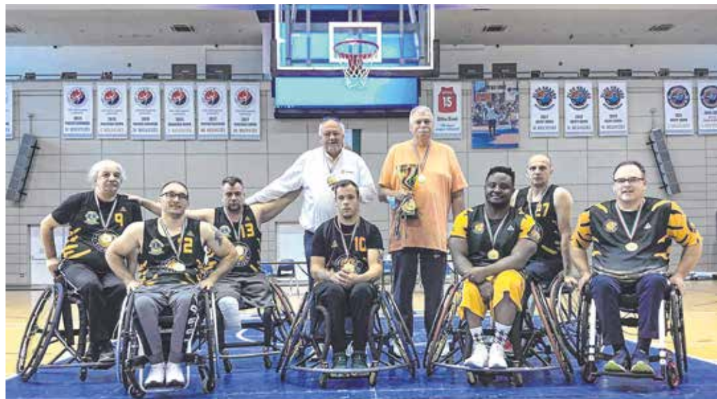
A Soproni Tigrisek kerekesszékes kosárlabdacsapata sorozatban negyedik alkalommal szerezte meg az elsőséget a Magyar Kupában.