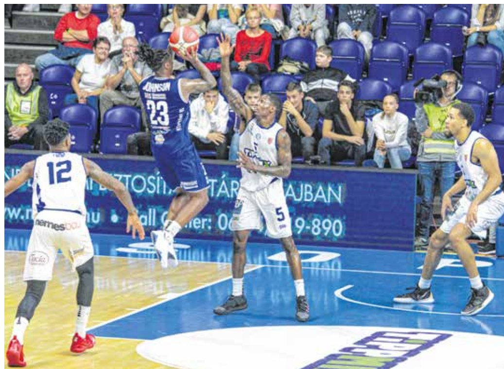
Az SKC a Nyíregyháza ellen kikapott hazai pályán, a védekezésen javítania kell.

– Csak gratulálni lehet a Nyíregyházának, megérde-