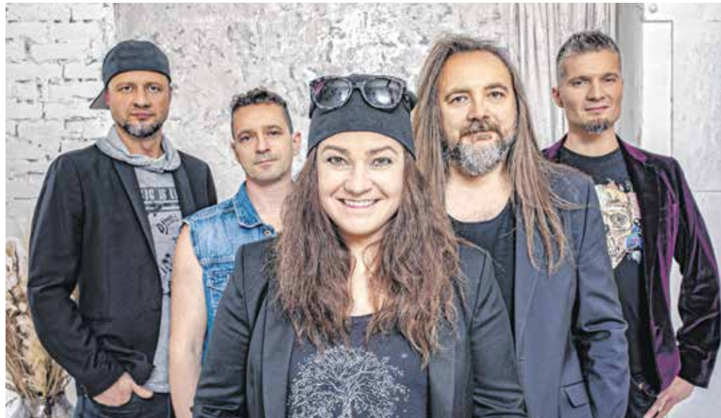
A Zanzibar együttes tagjai folyamatosan próbálnak és készülnek a soproni koncertre.

– Nagyon izgalmas volt összeválogatni a műsort: természetesen játszunk azokat a „kötelező” dalokat, ami nélkül nincs Zanzibar koncert. Így aztán lesz a „Szólj már”, a „Szerelmemről szó sem volt”, de két olyan dal is felszendül, amit évek óta nem játszott a