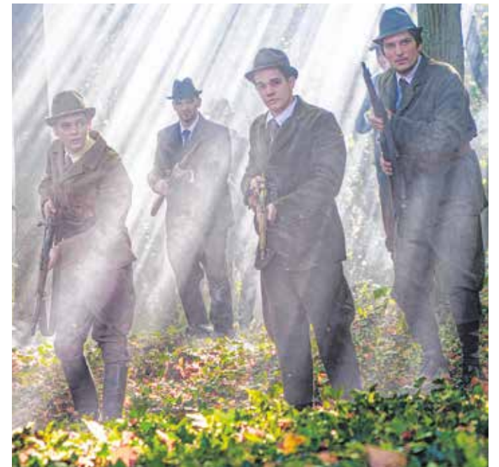
A népszavazásról szóló dokumentumfilmben színészek, statiszták, katonai hagyományörzők szerepelnek.

A stúdió a Magyar Nemzeti Levéltár Országos Levéltárában is tervez forgatást, itt az 1921-es velencei egyezmény eredeti iratát őrzik, amely a népszavazás kulcsdokumentuma. A dokumentumfilm a Nemzeti Filmintézet támogatásával készül.