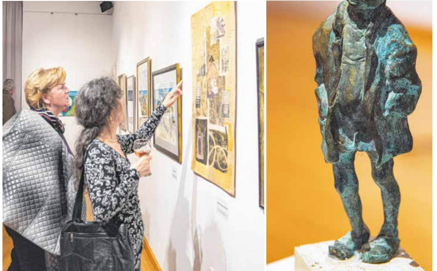
A XXI. Őszi Tárlaton festményeket, grafikákat, kisplasztikákat, textilre készült alkotást és fotókat állítottak ki.