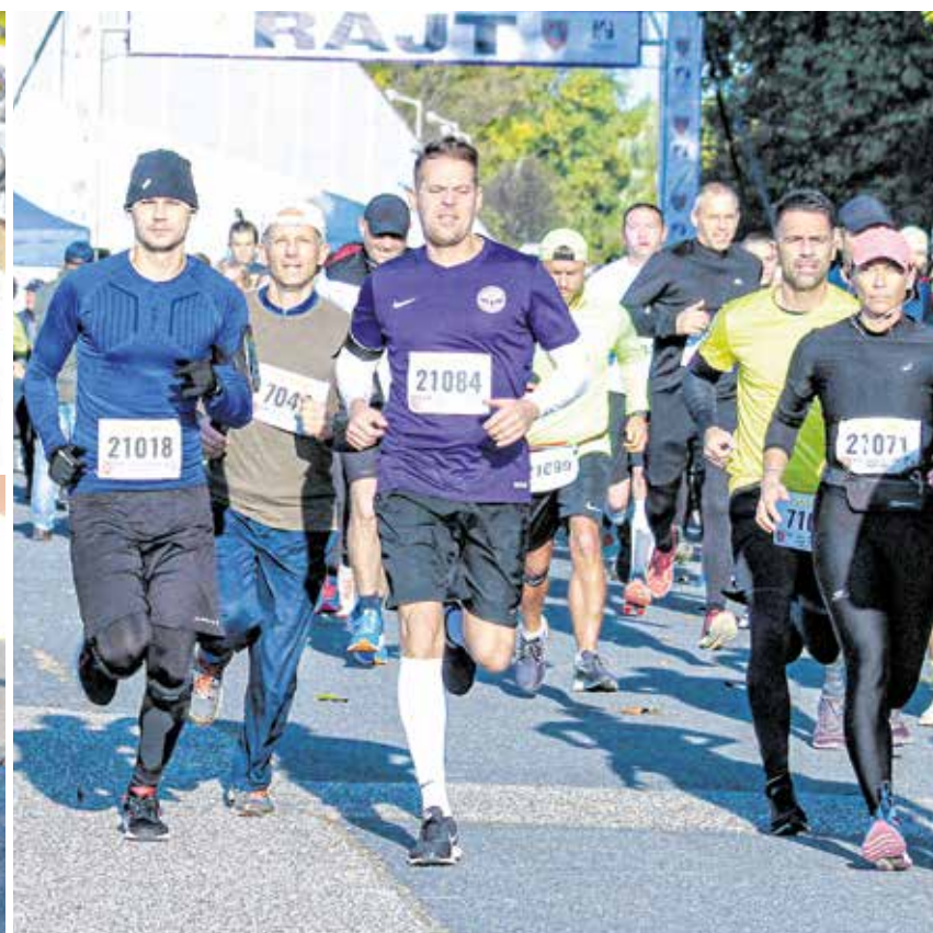
Az Európa-futás népszerűsége töretlen, idén is jó hangulatú versenyt rendeztek városunkban.