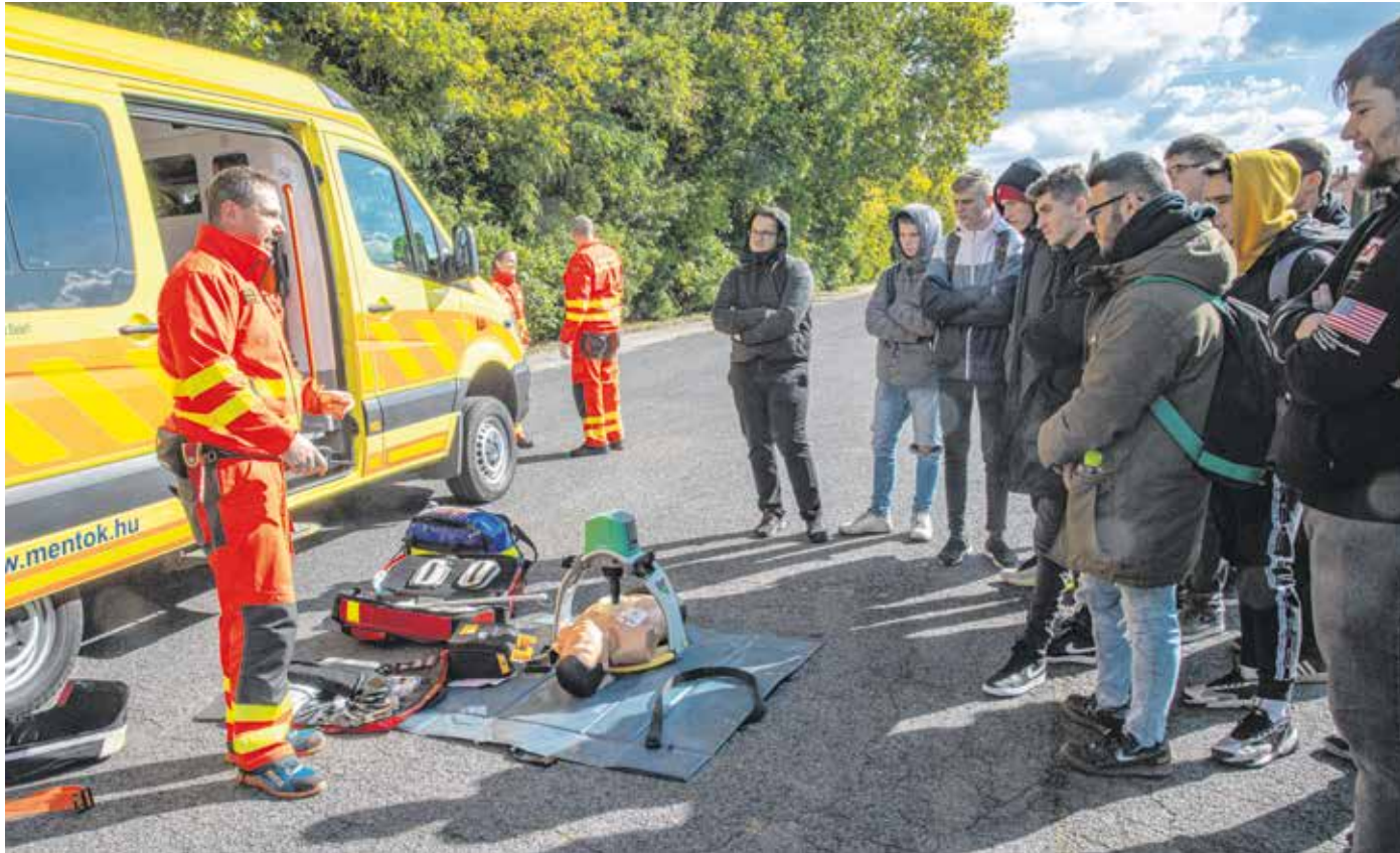
A mentők azt is bemutatták a középiskolásoknak, hogy hogyan kell újraéleszteni valakit.