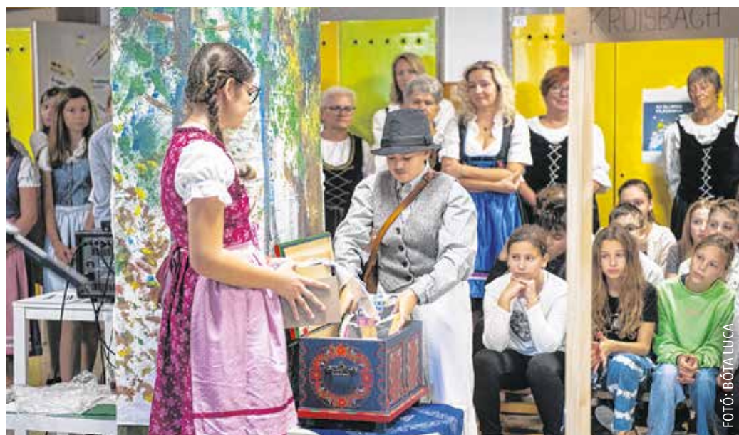
A Wanderschlüssel kampány ládáját ünnepélyes keretek között fogadták az iskolában.

A gyerekek által készített falvédőt, helyi tájszólást gyakorló dominót, egy lábasnyi, kartonból készült poncichter bablevest, valamint a projektet összefoglaló füzetet és pendrive-ot is elhelyeztek a Wanderschlüssel kampány ládikájában a Soproni Német Nemzetiségi Általános Iskolában. A programot a Magyarországi Németek Országos Önkormányzata hirdette meg: lényege, hogy egy díszes láda járja az országot benne egy régi kulccsal. Ebbe a ládába várják az adott települések németiségéről gyűjtött anyagokat.