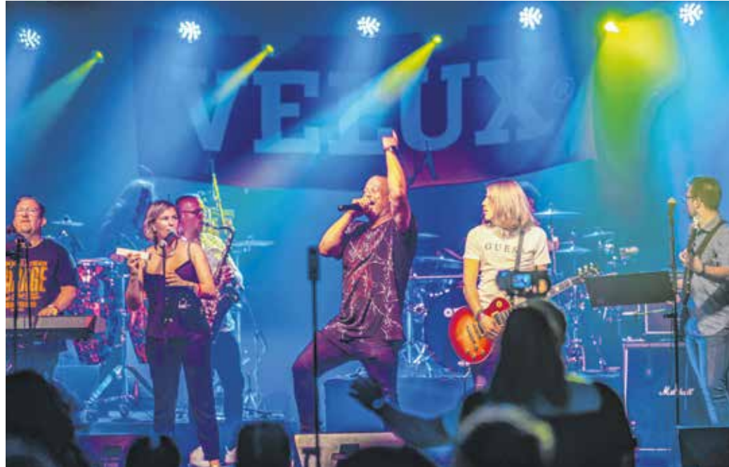
Bebe nyitottsága, közvetlensége, profizmusa teljesen lenyűgözte a HayDM Street tagjait, és hatalmas motivációt adott nekik.

A soproni zenészek nagy öröme Bebe teljes mellsz-