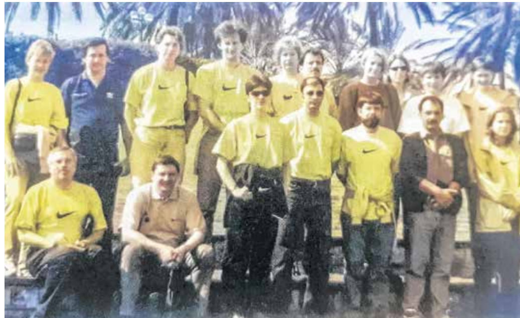
Jaffai kiránduláson a GySEV-Ringa csapata – a buszt hiába várták, végül taxikkal indultak.

márciusában, amikor a GySEV-Ringa női kosárlabdacsapata a Ronchetti-kupában az elődöntő visszavágójára érkezett meg az országba. A soproni diadal után ezúttal az Elitzur Ramla vendégeként lépett pályára.