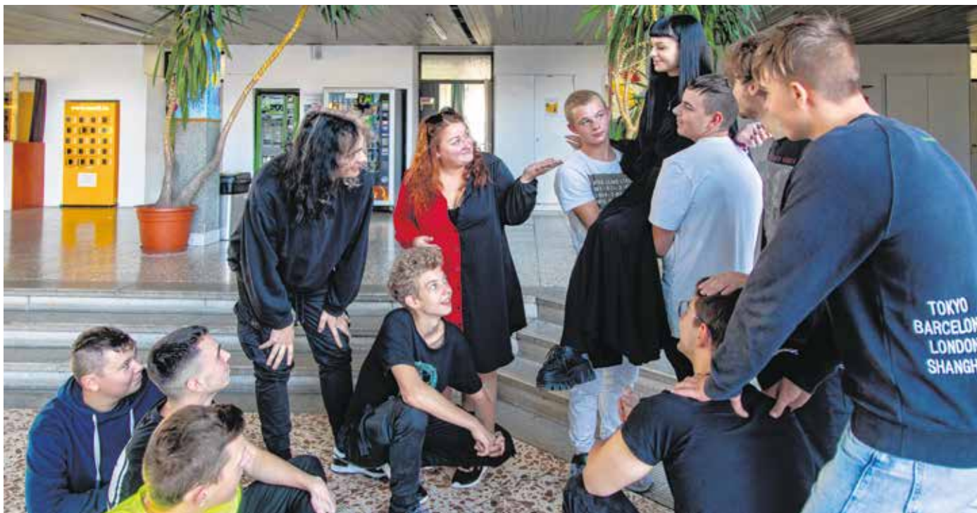
A Vasvillás diákok már most készülnek Az ember tragédiája jövő februári nagyszínházi premierére.

A program célja, hogy közös alkotómunkára hívja Sopron és környéke 7-12. osztályba járó diákjait, hogy saját élményeik alapján tapasztalhas- sák meg a színház varázsát. A projekt végére megszű- letik Madách Imre drámai