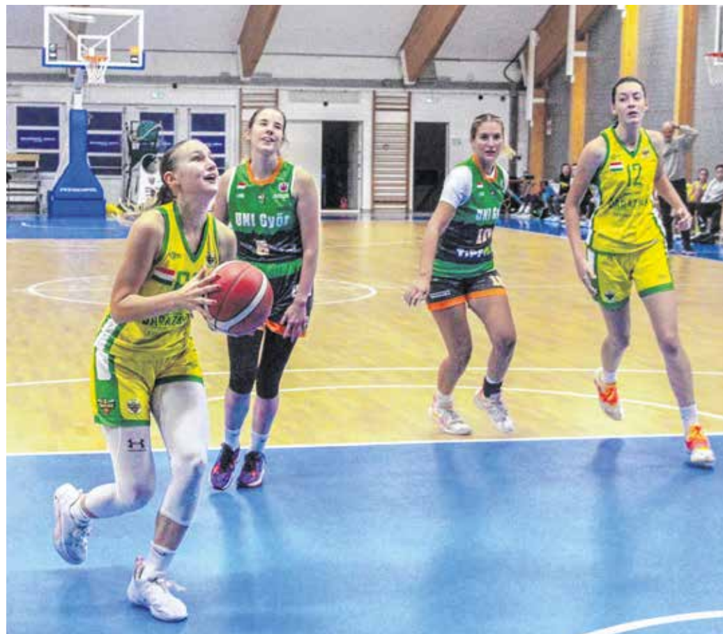
Női kosárlabdában idén a korábbinál nagyobb szerep hárul a soproni fiatalokra.

– Úgy gondolom, hogy a fiatalok mindent megtesznek, hogy megfeleljenek a legmagasabb osztályban szereplő felnőttcsapat elvárásainak – folytatta a szakmai vezető. – Akik a mérkőzéseken szerepet kaptak, tudtak is élni vele. Ugyanakkor nemcsak a meccsekről kell beszélnünk, hiszen éppolyan lényeges, hogy a heti edzőmunkát is kiválóan végezzék. Ez alapján tudják ugyanis stabilizálni a helyüket