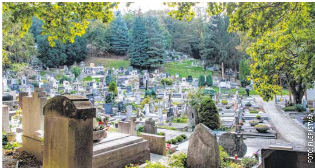
A sopronbálfalvi Hősi temetőben 3200 katona, hadifogoly és civil áldozat alussza örök álmát.

A soproni erdő ölelésében búvik meg a sopronbálfalvi Hősi