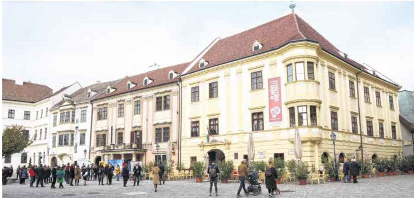
A Fabricius-ház, a Tábornok-ház és a Storno-ház (balról jobbra) összekötésével jön létre az új múzeumnegyed – a mintegy 3,2 milliárd forintos beruházás a nemzeti kastélyprogram része