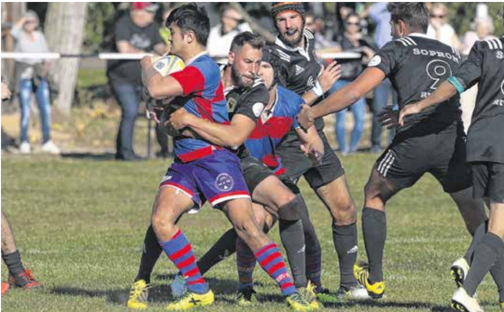
A soproni rögbicsapat az NB II. 15-ös bajnokságában szerepel