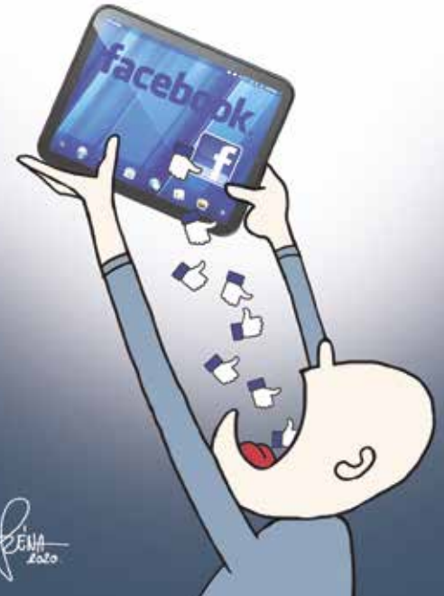
Szénási Ferenc (Széna) soproni karikaturista alkotásai hétről hétre.