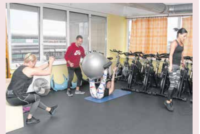
A mozgás biológiai szükségletünk – a lényeg, hogy rendszeresen sportoljunk!