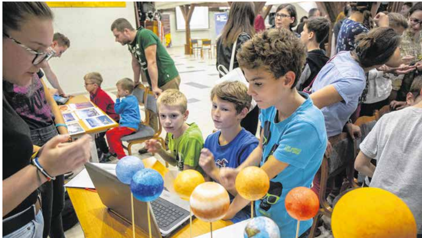
A Széchenyi-gimnázium évek óta résztvevője a kutatók éjszakája rendezvénysorozatnak, az intézményben fontosnak tartják a tehetséggondozást, illetve tehetségevelést.

A szág legjobb iskola közé – Sopronból egyedülként – a Széchenyi István Gimnázium került be. Tavaly hetvenhétedik volt, idén pedig már az ötvenkilencedikek.