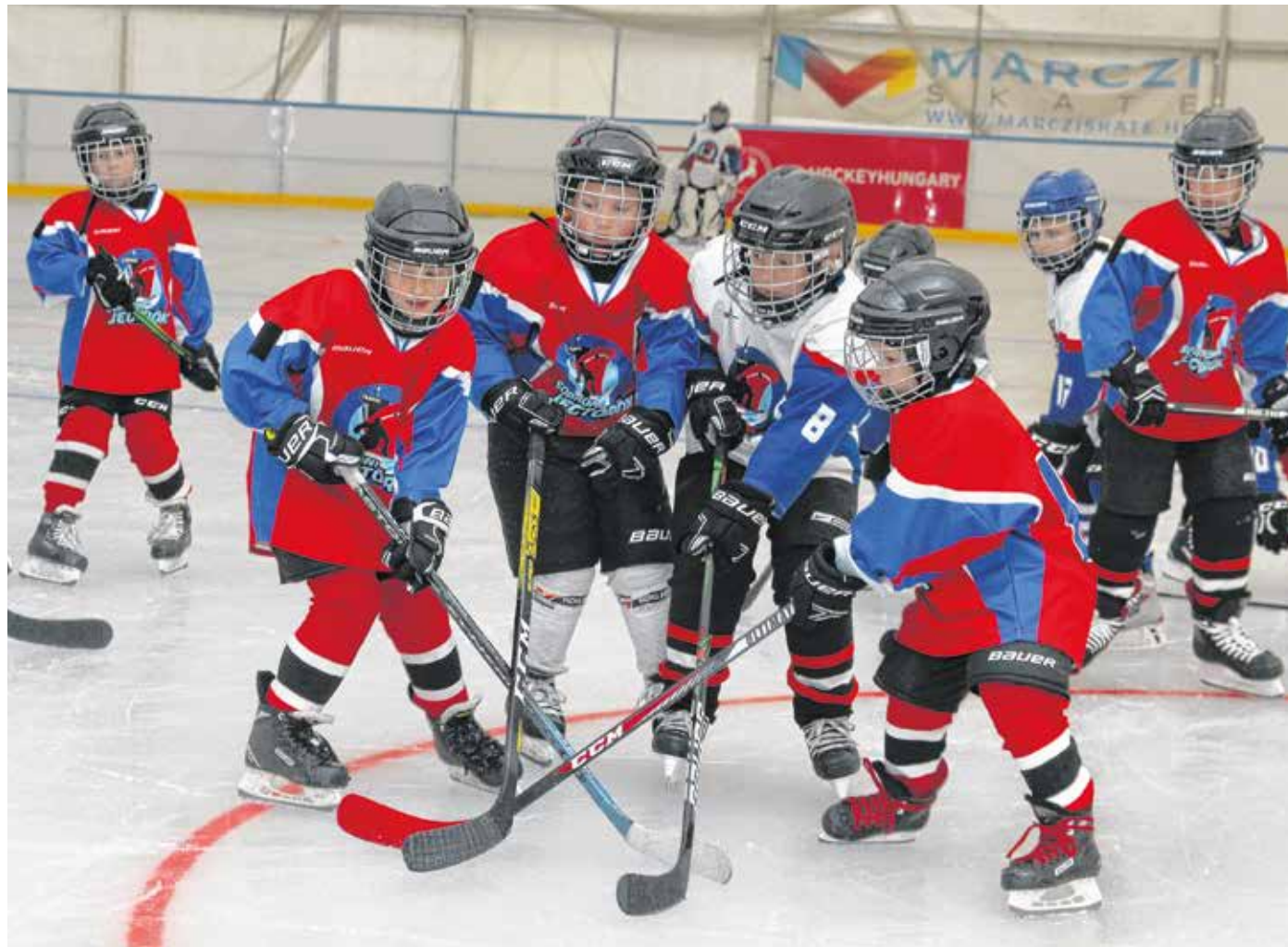
Megnyílt a műjégpálya, az első nap a Soproni Jégtörők U8-as csapata már edzett is FOTÓ: NÉMETH PÉTER

– November 2-től a téli szünetig visszaáll a korábbi években megszokott nyitvatartás – tette hozzá Koós Zoltán. – Hétfőn, kedden, csütörtökön edzéseket tartunk, a nagyközönség számára a pálya szerdán 18-20 óra, pénteken 17-20 óra, valamint a hétvégén 10-19 óra között tart nyitva. Árat idén nem emeltünk. Bárki – óvodás, iskolás, felnőtt – sportolhat. A belépés előtt és a jégen több előírást is be kell tartani, a járvány miatt kötelező például a testhőmérséklet-mérés.