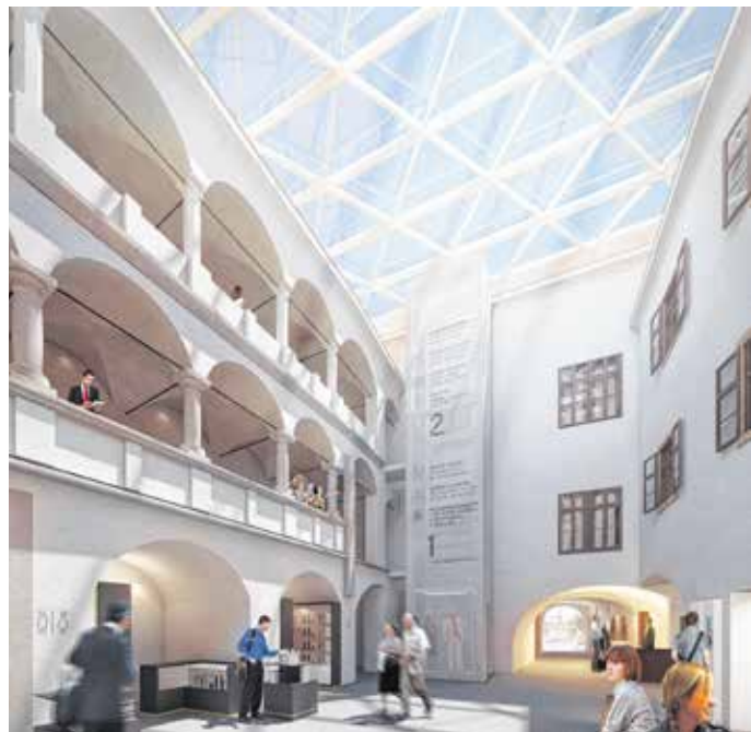
A fejlesztés fontos eleme a Tábornok-ház átalakítása, felújítása, valamint az udvar üvegkupalával való befedése LÁTVÁNYTERV

A belvárosi fejlesztés alapkövét az elmúlt csütörtökön tették le.