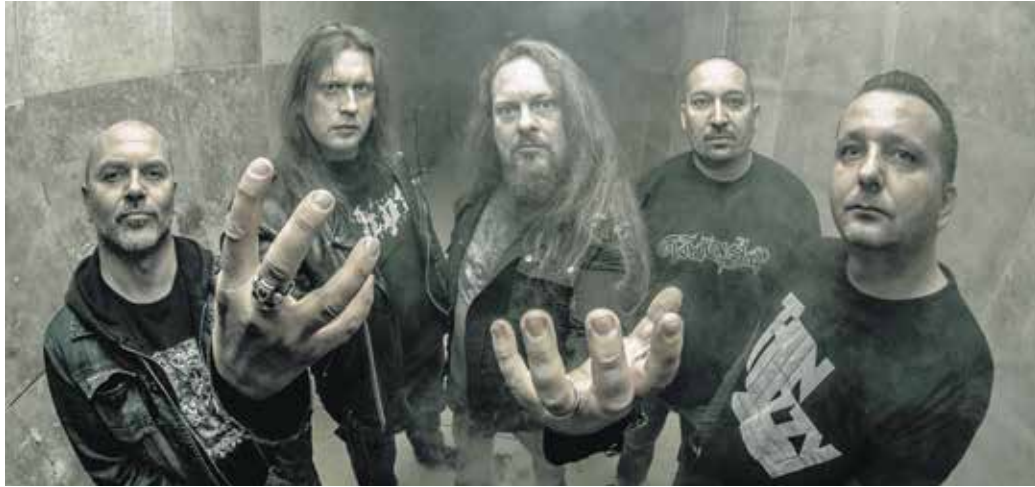
Jövőre lesz húszéves a soproni Wall Of Sleep, a jubileumra új lemezzel készül a banda

– A bulit a Spitfire nevű soproni formáció nyitja, majd a Leanderrel zajló turnéja közepette a szintén soproni gyökerű