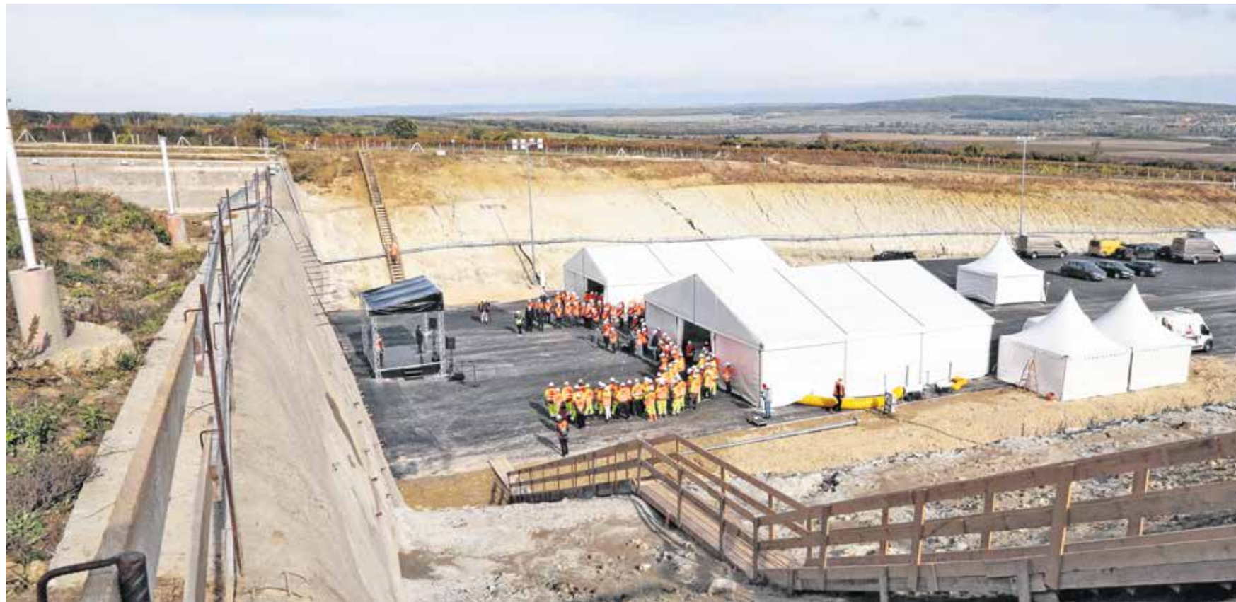
Napi 24 órás munka mellett 1,5–2 métert haladnak, így egy alagútjárat kifejtése nagyjából egy évig tart majd

A beruházó Nemzeti Infrastruktúra Fejlesztő Zrt. (NIF) vezérigazgatója, Nagy Róbert Attila köszöntőjében kiemelte, az M85-ös Csorna–Sopron kelet csomópont közötti szakaszát december 16-án adják át. A vezérigazgató emlékeztetett, a fertőrákosi csomópont (Pozsonyi út) és a Sopron országhatár közötti szakaszon – ennek része a bécsi-dombi alagútpár – 2019 tavaszán kezdődtek meg