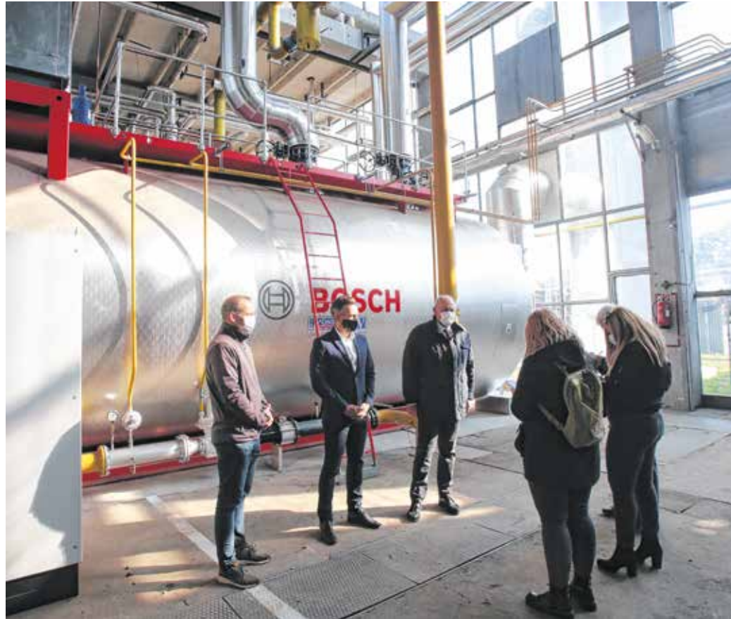
A Sopron Holding Zrt. új kazánja – a szobányi méretű szerkezet 17 megawatt teljesítményű, kétszer erősebb, mint a korábbi volt