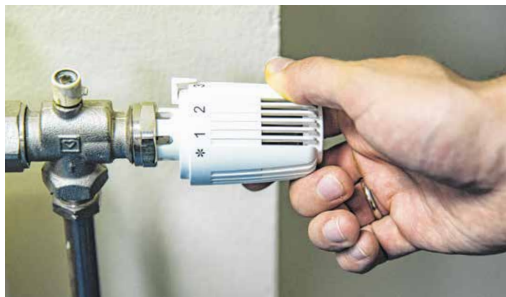
Ha a radiátor a szelep mellett nem melegszik, a legvalószínűbb oka a levegős fűtésrendszer.