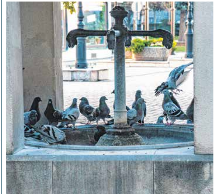
Sopron belvárosában is sok a galamb.