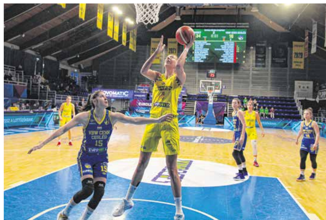
A Sopron Basket a Cegléd ellen nagy különbségű győzelmet aratott.

A bajnokságban aztán már egészen más sebességre kapcsolta a Sopron Basket: a Cegléd elleni mérkőzésen Brooks 17, Peddy 18 pontot szerzett. A Cegléd a 2. negyedben mindössze 8 pontot tudott dobni, ez a hazaiak védekezését dicséri. Sok kérdés nem maradt a második félidőre, a soproniak végül harminchat ponttal tudtak győzni. A végeredmény: Sopron Basket – VBW CEKK Cegléd: 92–56.