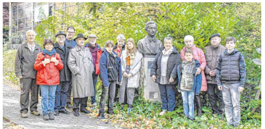
Modrovich Ferenc professzor szobra előtt az évfolyam-találkozó résztvevői.