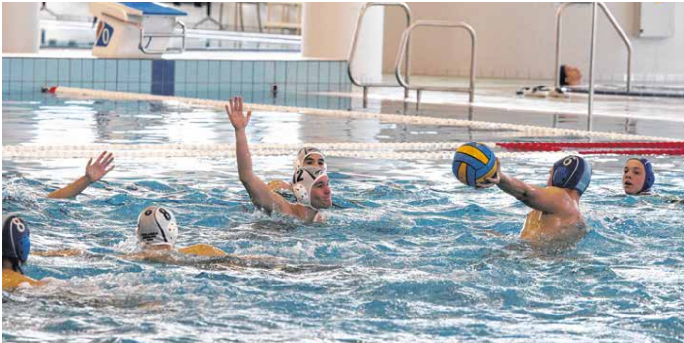
A Soproni Vízilabda Sport Egyesület három együttese játszott hétvégén az országos bajnokságban.