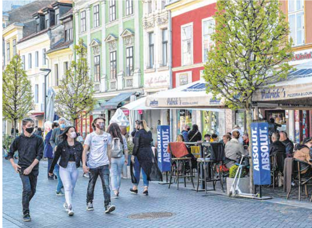
Egyre több helyen kötelező a maszkviselés Sopronban is – a kórházban, a tömegközlekedési eszközökön és az ügyfélszolgálatokon is előírták.

A kormány lehetővé teszi a munkáltatóknak, hogy a munkavégzés feltételeként előírják a koronavírus elleni védőoltás felvételét a dolgozóknak. Az első oltásra 45 napos határidőt állapítottak meg. Nem várható el a védőoltás felvétele attól, akinél az orvosi igazolással alátámasztottan ellenjavallt, de a gyese-