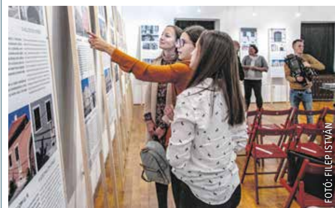
A Színek és rétegek című vándorkiállításon 14 épület helyreállítását, valamint 28 ház homlokzatfelújítását mutatják be.

A vándorkiállítást még Budapesten, Veszprémben, Nagyváradon, Kolozsváron, Győrben és Pécsen mutatják be – Sopronban november 26-ig látható, hétfő kivételével minden nap 10-től 18 óráig.