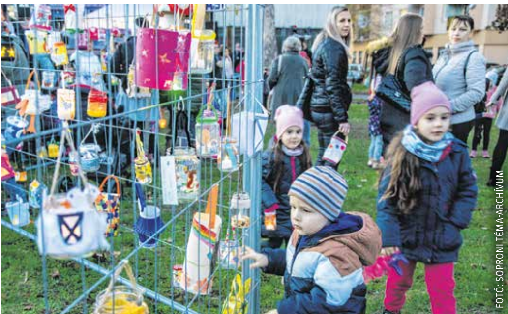
A Jereván-lakótelepen már hagyomány, hogy Márton-napon lampionos kiállítást rendeznek.

A lampionos felvonulásokat csak a 19. század elején vezették be egyházi rendeletre, hogy a fény – mely a jó cselekedetet jelképezi – mindenkihez eljusson. A szokás szerint sötétedéskor a gyerekek