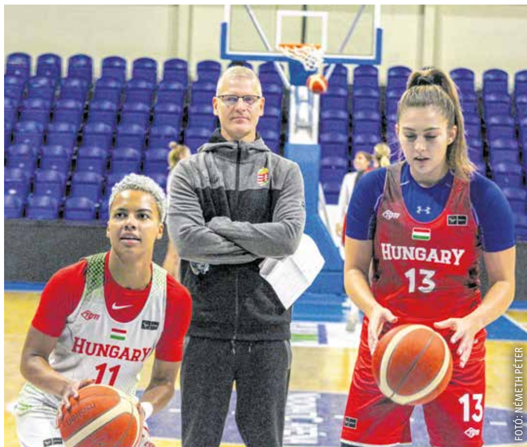
Sopronban készül a november 9-i meccsre a válogatott – a szövetségi kapitány Széky Norbert.

– A nyári Eb-n negyedik helyezést értünk el, ezzel pedig komoly sikereket tudhat magáénak a válogatott, én ezt a büszkeséget hordozom magamban – hangsúlyozta Széky Norbert. – Azonban már új kihívás áll előttünk. Jó és összetartó a csapatunk, amelyben van perspektíva. Nagyon vártam ezt az összetartást, és remélem, a csapat olyan magas szinten tud teljesíteni most is, mint az Eb-n. Mindkét meccs fontos,