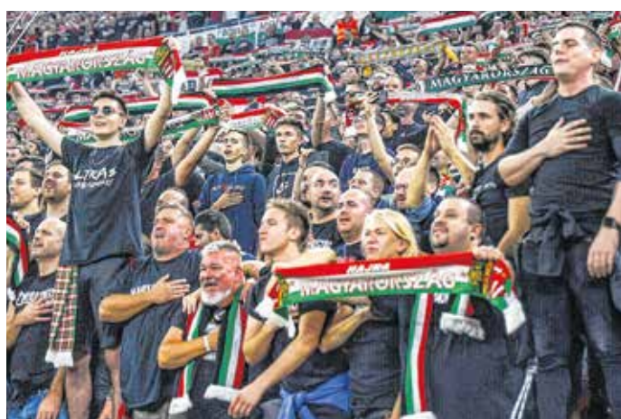
Magyar szurkolók az Eb-selejtezőn – november 19-én is telt ház lesz a Puskás-aránban.

Szófia helyett Plovdivban és nézők nélkül rendezik meg a válogatott bolgárok elleni Európa-bajnoki selejtezőjét jövő csütörtökön 18 órától. A rendező bolgár szövetség (BFU) biztonsági okokból megváltoztatta a mérkőzés helyszínét, időpontját, illetve úgy döntött, hogy nem léphetnek be szurkolók a stadionba.