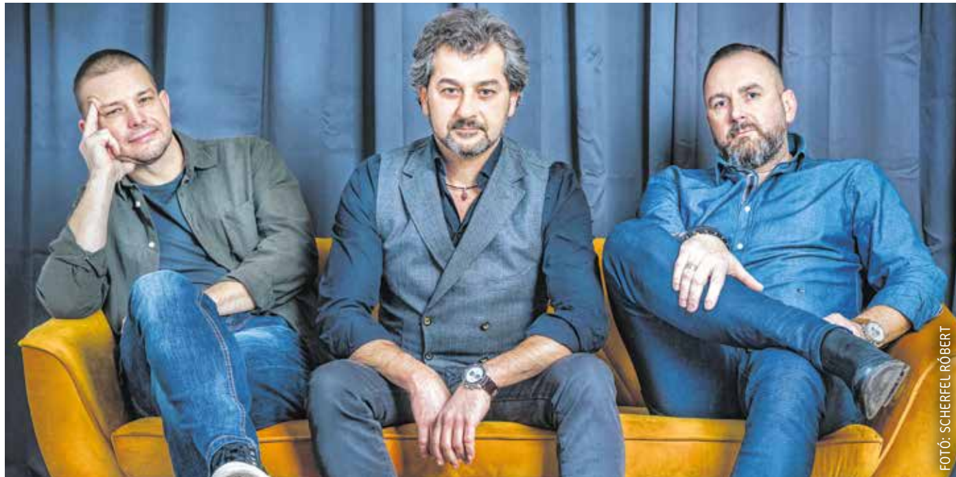
A Wasabi Case tagjai önálló műsorral készülnek a soproni koncertre, valamint vendégzenészek is fellépnek velük a Búgócsigában.