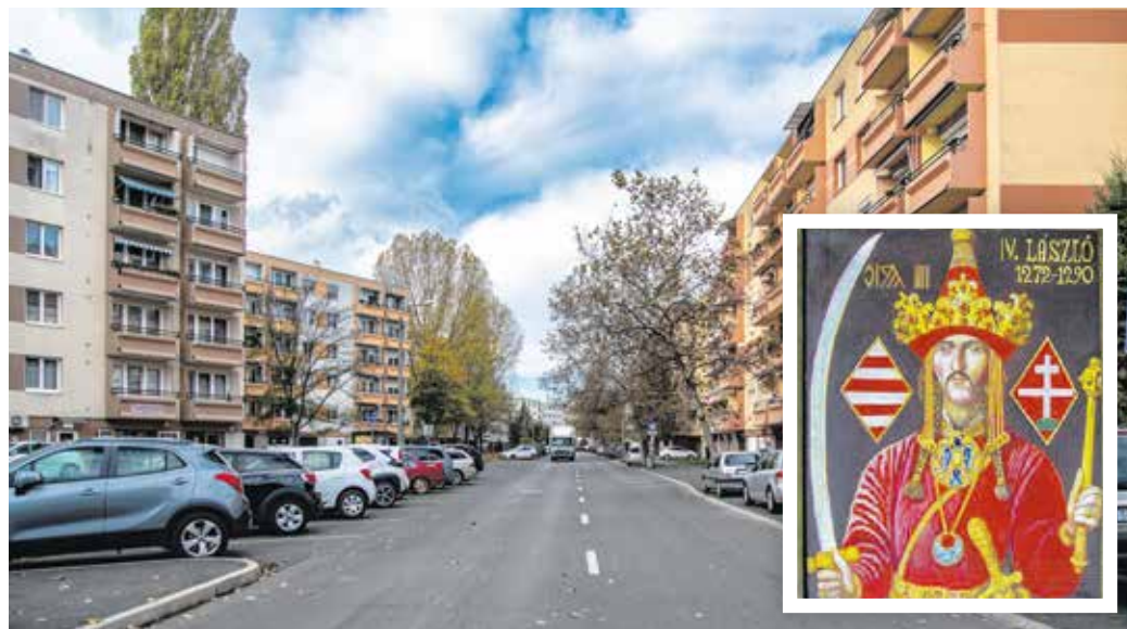
A Jereván-lakótelep leghosszabb utcája a IV. László király utca.

A mai IV. László király és a Juharfa utca között állt a városi faraktár és fűrésztelep, az agyagbánya és a téglafőgyártó épületei. A mai Faraktár utca felé is gazdasági épületek