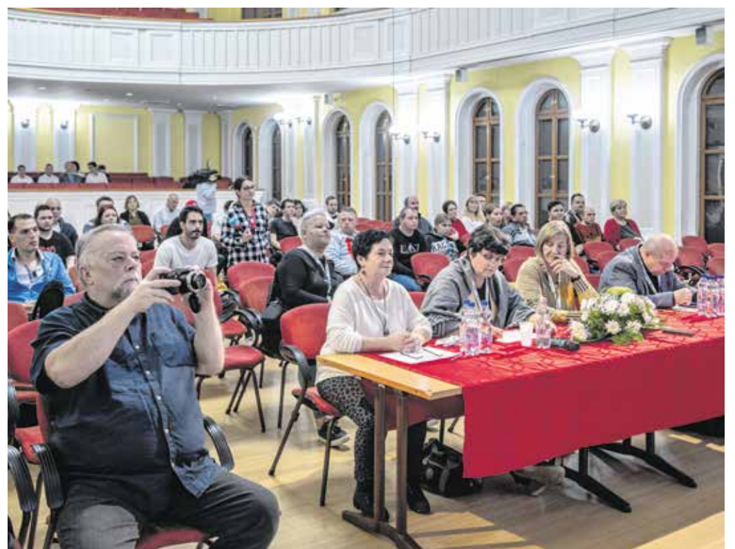
A speciális tehetségkutatón a produkciókat négytagú zsűri értékelt.