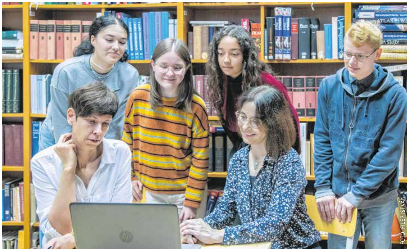
A széchenyis diákok a tíz emelt szintű angol érettségi témakört feldolgozták, majd erről felvételt is készítettek tanáraik segítségével.

– A projektünk lényege az, hogy a tíz emelt szintű angol érettségi témakört feldolgozták a diákjaink, majd erről felvételt is készítettek tanáraik segítségével.