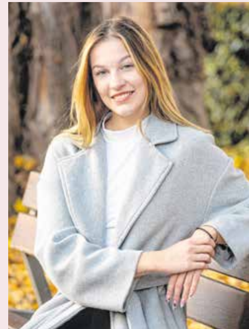
Idén is divatosak a hosszú fazonú téli kabátok.

Az sem mindegy, hogy milyen fazonú szoknyához milyen csizmát viselünk. A klasszikus, térdig vagy térd alá érő ceruzaszoknyához leginkább a magas sarkú bokacsizmák, cipőcsizmák illenek. A miniszoknya és a combcsizma párosa biztos befutó, de könnyen közönséges hatást kelthet. A miniszoknyákhoz a legjobban a bokáig érő, magas sarkú és talpú csizmák illenek.