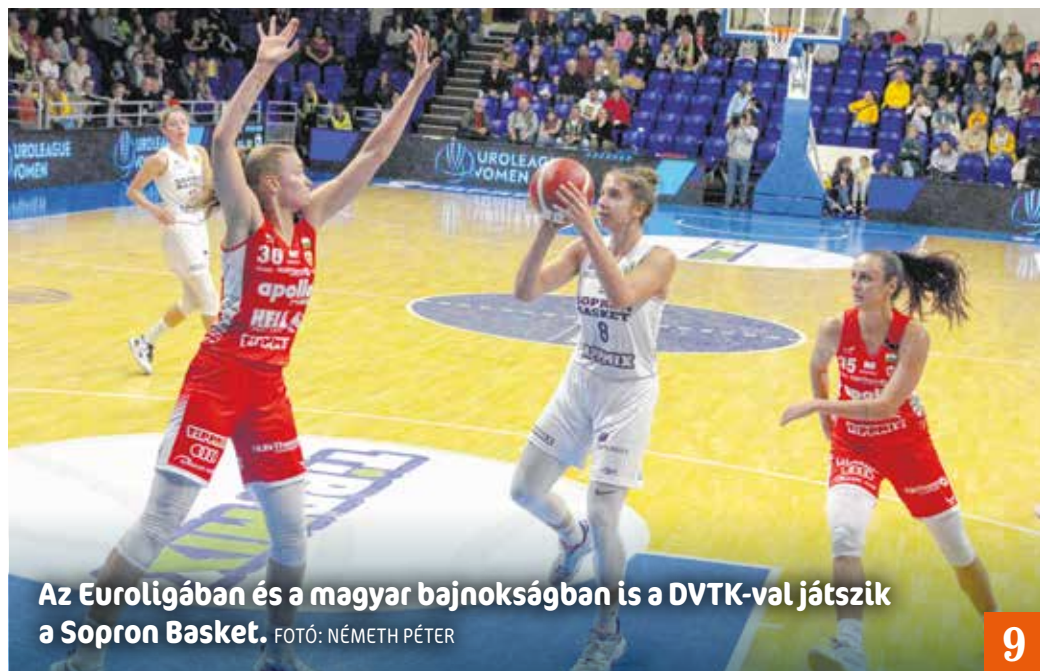
Az Euroligában és a magyar bajnokságban is a DVTK-val játszik a Sopron Basket.