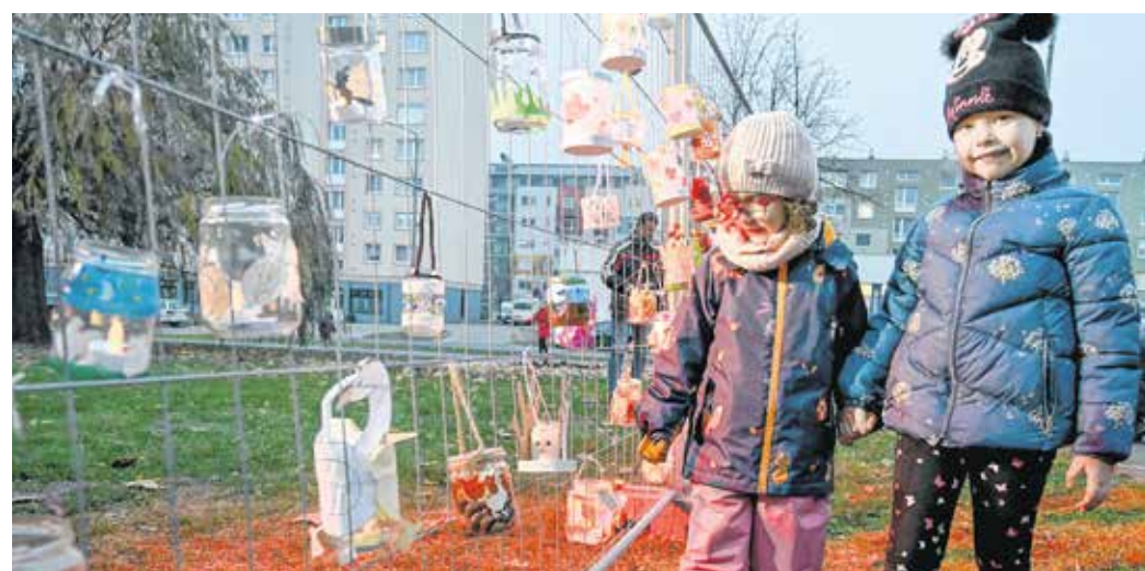
Az óvodások lámpásaiból idén is kiállítást rendeznek a Jereván-lakótelepen.

A Rotary Pannonia és a Hova Tovább Alapítvány november 12-én 18 órától Balfon tart jótékonyági libavacsorát a Panoráma étteremben. Az est folyamán támogatójuk, a Fényes Pincészet borait kóstolhatják a résztvevők, fellép a Helga Jazz, és jótékonyági árverés is lesz.