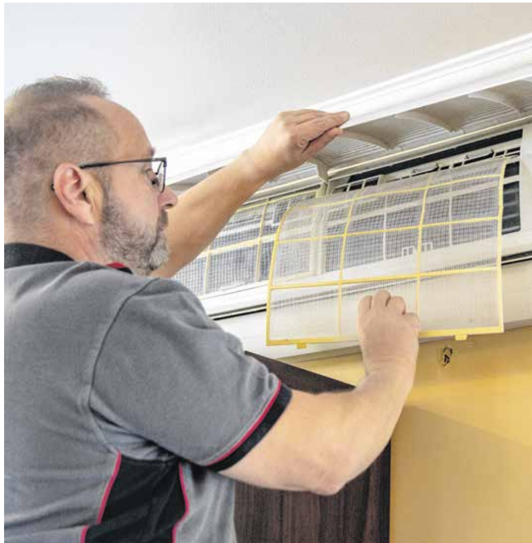
Amikor a kinti hőmérséklet 5–15 fok közötti, klímával a leggazdaságosabb fűteni.

Egy lakásba vagy kisebb családi háztartásba multisplit klímát érdemes szereltetni: ez azt jelenti, hogy kültéren egy, beltéren pedig szobánként egy készüléket telepítenek. A hálószobákban éjszaka kevésbé jó ezeket a berendezéseket használni, mert zajosak, és az áramló levegő is zavarhatja az álmunkat: alvás előtt célszerű felmelegíteni a teret, vagy egyéb módon fel-fűteni azt.