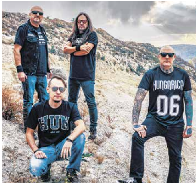
A Hungarica idén újra megrendezi a XIII. Hűség Napi Rock Estet.