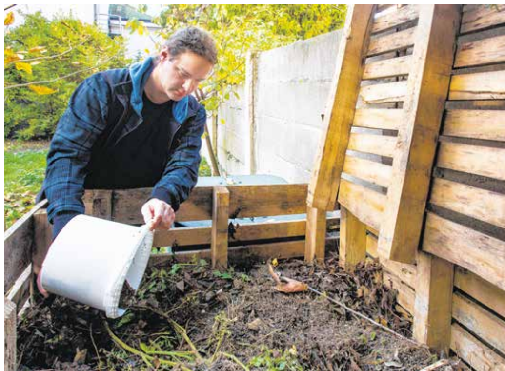
Komposztunkba kerülhet konyhai zöldség-, gyümölcshulladék, összezúzott tojásból, maradék virágföld, kávézacc és természetesen kerti növényhulladék is.