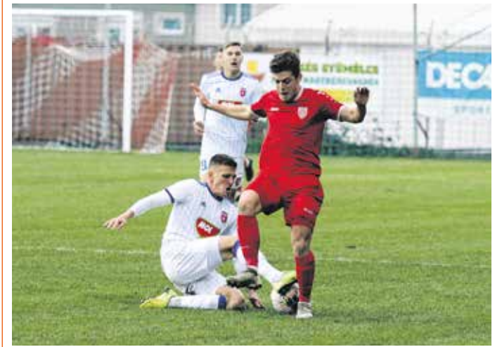
Az MLSZ bizonytalan ideig felfüggesztette az NB III-as bajnokságot is

Az eredeti tervek szerint az SC Sopron november 18-án a Bicske ellen lépett volna pályára. A mérkőzés elmarad, ugyanis Csányi Sándor elnök hétfőn bejelentette, hogy a MLSZ félbeszakítja az amatőr bajnokságait. A férfi NB I és NB II, valamint a női NB I folytatódik, a férfi NB III-at és a megyei bajnokságokat, illetve a női NB II-t, valamint az utánpótlás-sorozatokat felfüggesztik. Ennek értelmében valamennyi soproni futballcsapat pihenőre kényszerül – a koronavírus-járvány miatt bevezetett óvintézkedések értelmében ugyanis tilos az amatőr csapatport, így csoportos edzéseket sem tartanak a klubok.