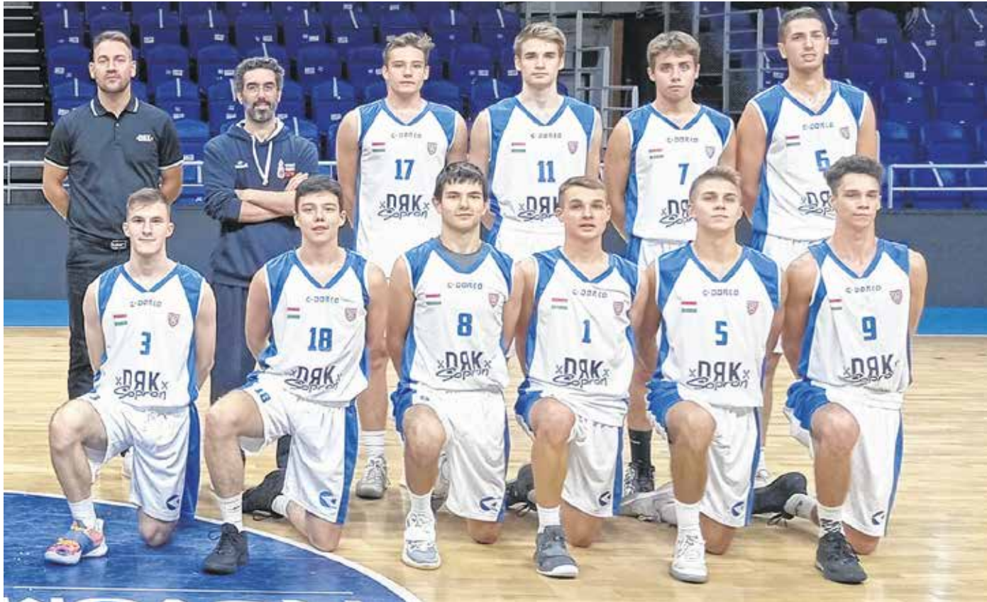
Az SKC U20-as csapata – a bajnokságban az ötödik–nyolcadik hely megszerzése a fiatalok célja