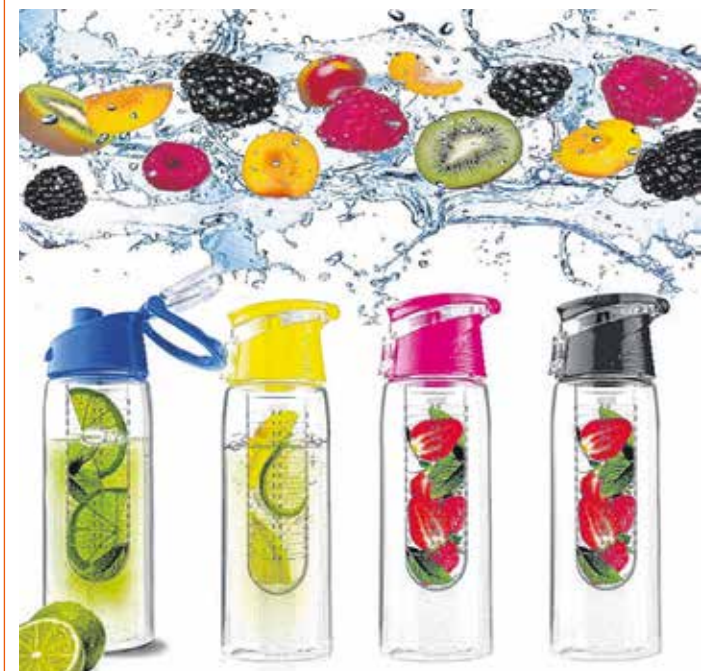
Divatosak, praktikusak, környezettudatosak az új kulacsok FOTÓ:ILLUSZTRÁCIÓ