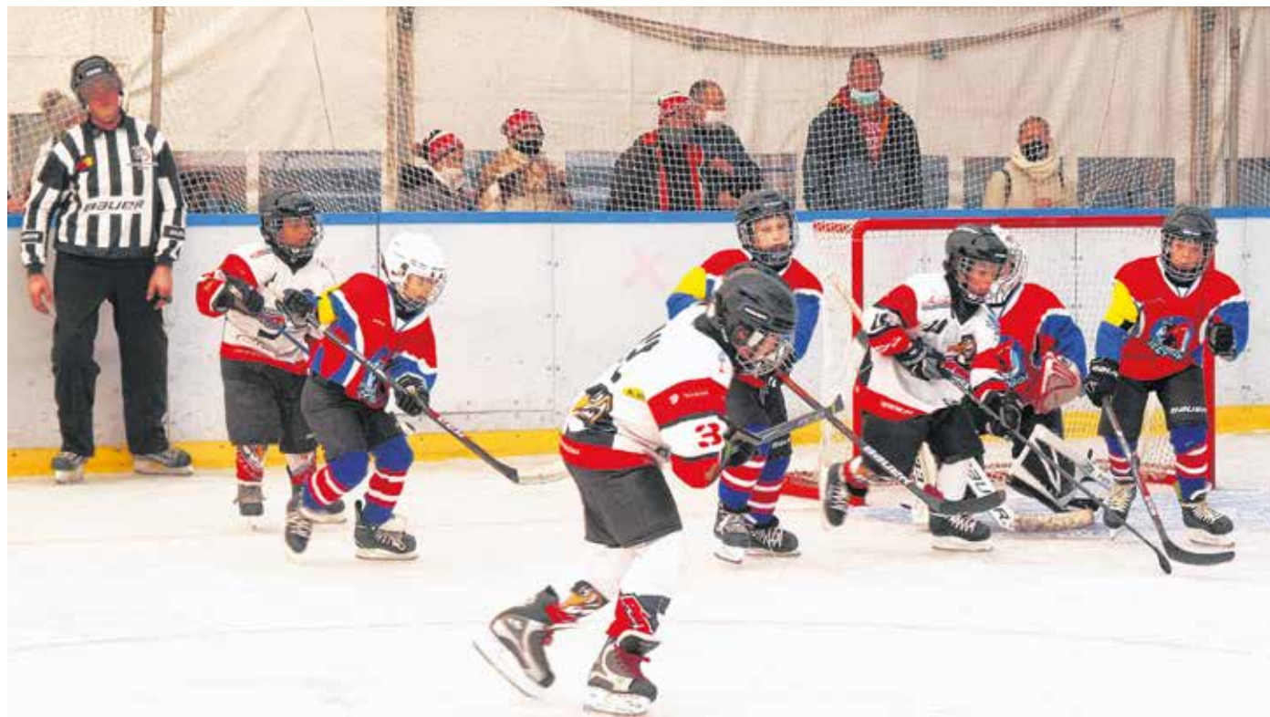
Lelkes kis hokisok a soproni műjégpályán – a hétfői U10-es tornát a szigorú járványügyi szabályok betartásával rendezték meg