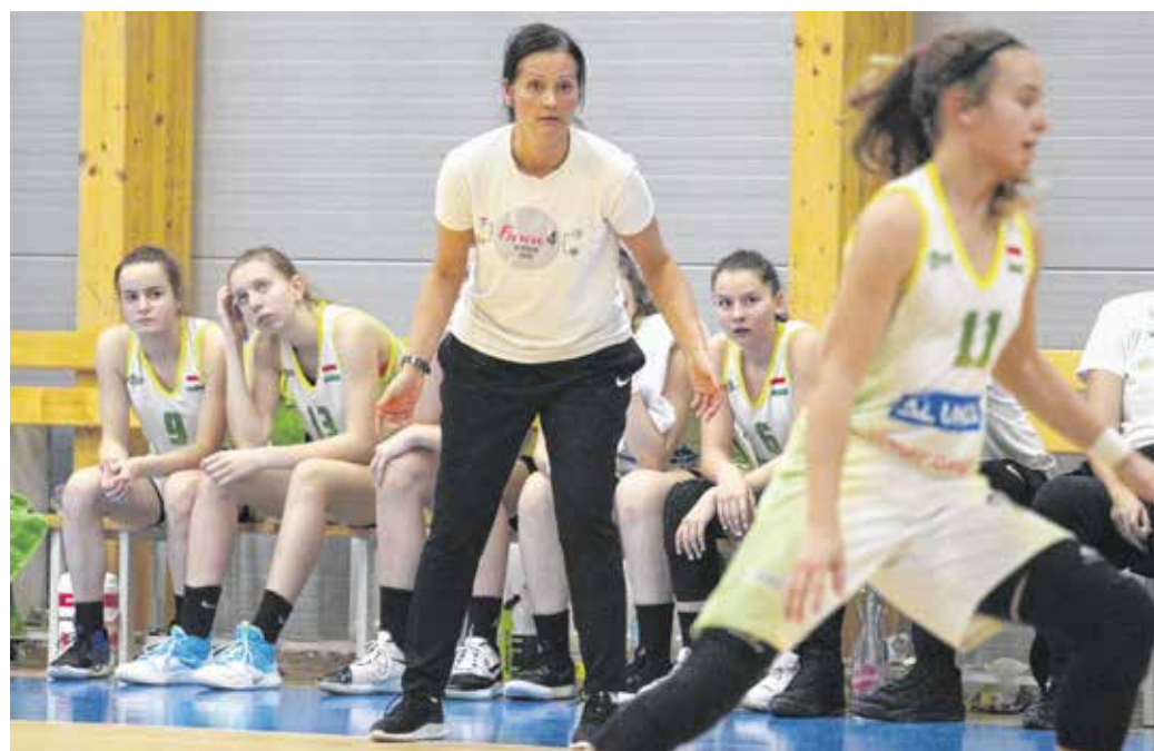
A Soproni Darazsak Sportakadémia fiataljainak fejlődését minden évben vizsgálják