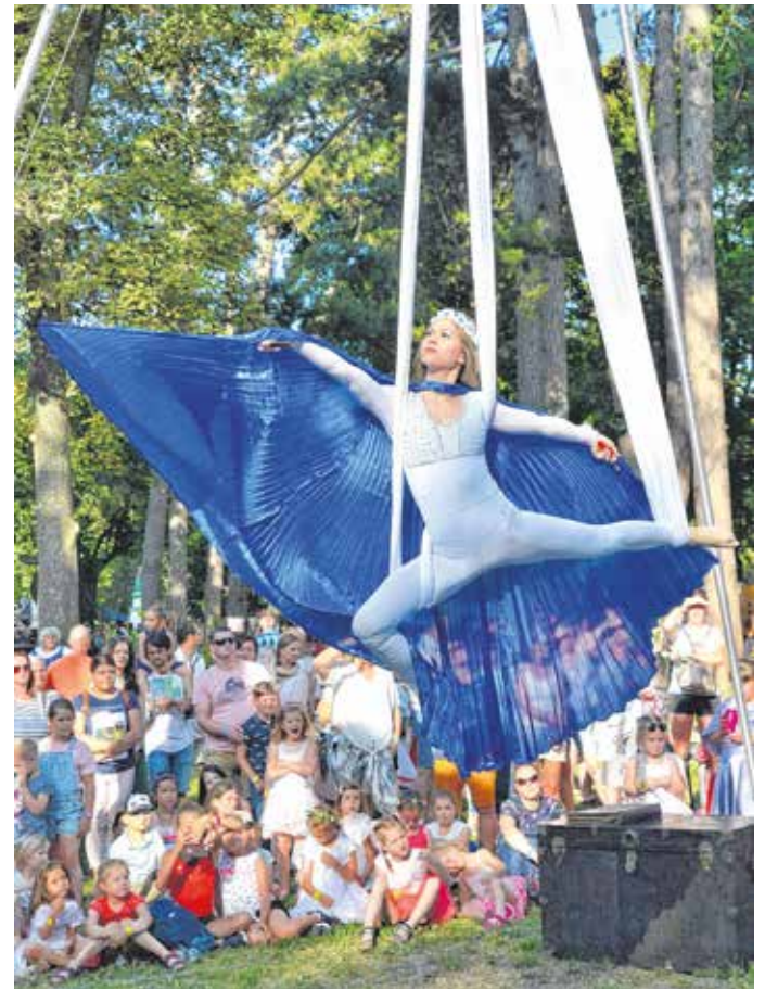
A légtánc világába a soproni nézők már több rendezvényen is beleszédülhettek.