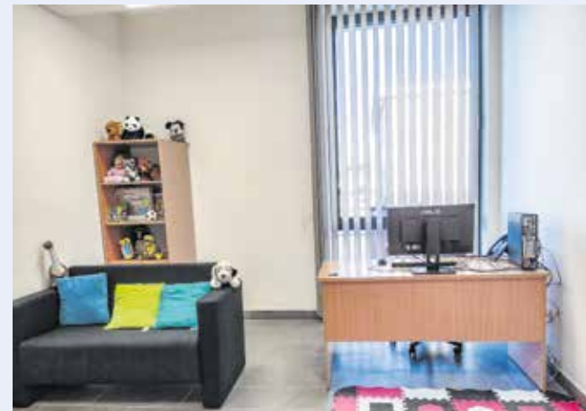
A 14 év alattiakat Sopronban ebben a speciális helyiségben hallgatják ki a rendőrök.