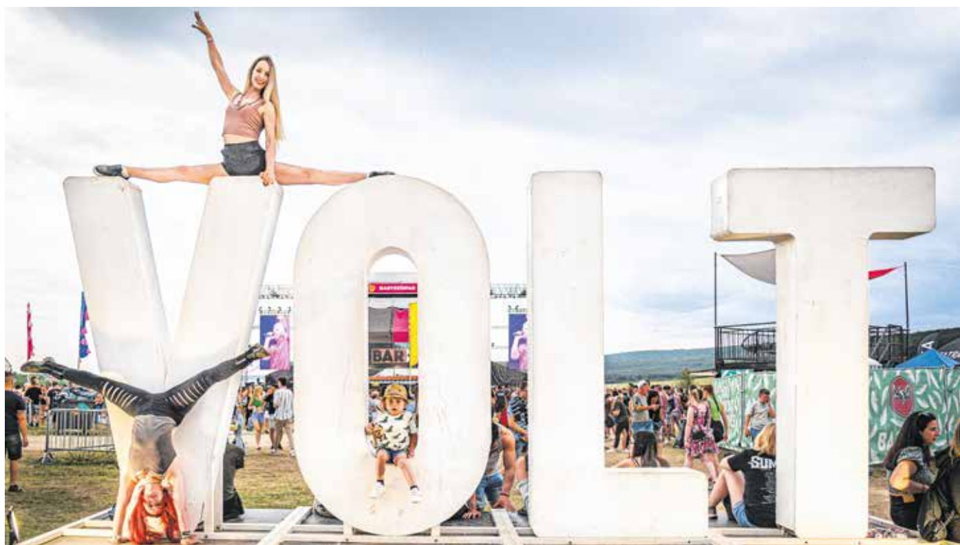
Két év szünet után idén ismét több tízezer fiatal szórakozott a Lövérékben.