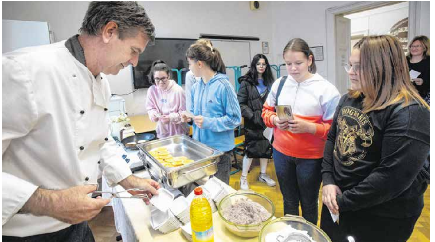
A vendéglátó iskolában amerikai palacsintát is készítettek az érdeklődő diákok.