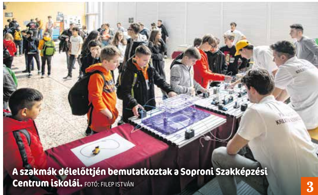
A szakmák délelőttjén bemutakoztak a Soproni Szakképzési Centrum iskolái.