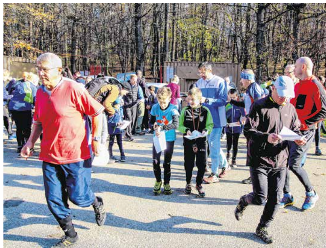
Népszerű volt a hétféligi tájékoztató futóverseny.

A sportszakember hozzátette: ha valaki nem tudta teljesíteni az egyórás limitet,