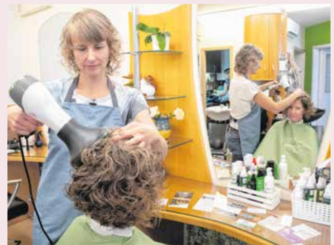
A göndör haj vágása, formázása sok szakértelmet igényel.

A göndör hajúaknak először is szulfátmentes, alkalmanként enyhén szulfátos samponnal ajánlott megmosni a hajukat. Ezután következik a hajtípusnak megfelelő balsam, majd a zselé és egy kis hab. Fokozott törődést igénylő haj esetén hajban maradó balsam használata javasolt. Ha valaki már megtanulta, hogyan tudja otthon kezelni, beszárítani a haját, és megszereti a göndör fürtjeit, akkor érdemes a saját hullámaira szabottan levágnia, mert a göndörségre szabott fazon nem biztos, hogy akkor is jól mutat majd, ha kivásalja a haját.