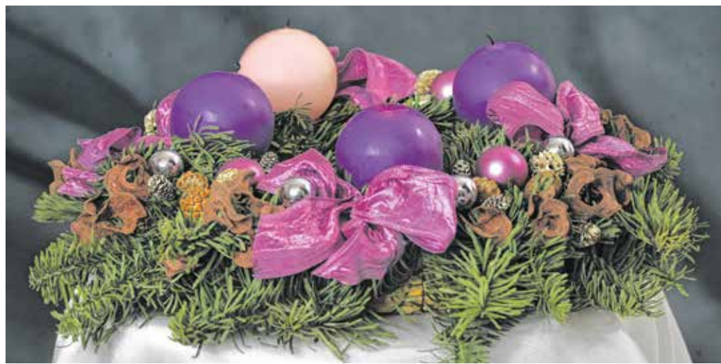
A hagyományos, három lila és egy rózsaszín gyertyával díszített adventi koszorú mindig népszerű.