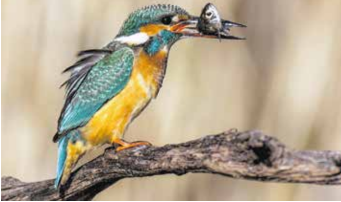
Hipságh Gyöngyi 10 képét, köztük a Szemek címűt is felajánlotta a licitre.