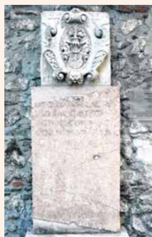
A síremlék jelenleg a Lenckvilla kertjében található.