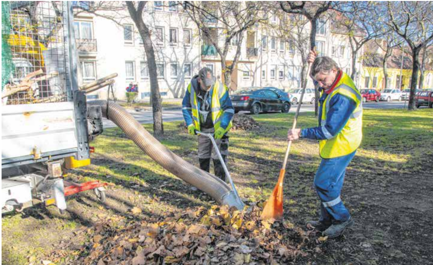
A Sopron Holding Zrt. munkatársai kézi erővel, valamint három önjáró géppel, lombfújókkal és egy mobil lombszívóval gyűjtik össze a lehullott leveleket.