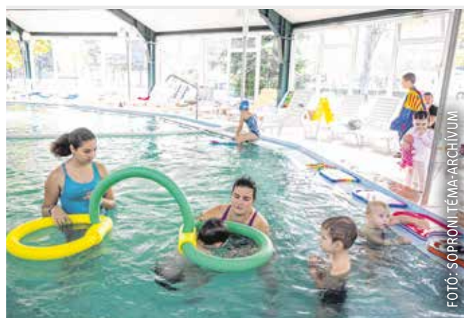
A diabéteszes gyerekek is élménydús programokon vehetnek részt – sikeres volt a cukorcsigás úszásoktatás.

együttműködni, illetve nemcsak az ellátottjaink fejlesztését végezni, hanem az érintett családokat még hatékonyabban segíteni – emelte ki Haász Sándor, az alapítvány elnöke. – A fiatalok szülei igazi példaképek, szükségük van arra a visszajelzésre, hogy nagyon fontos, amit csinálnak. Lényeges célkitűzésünk egy gondozóház kialakítása, amely mind a szülőknek, mind az érintett