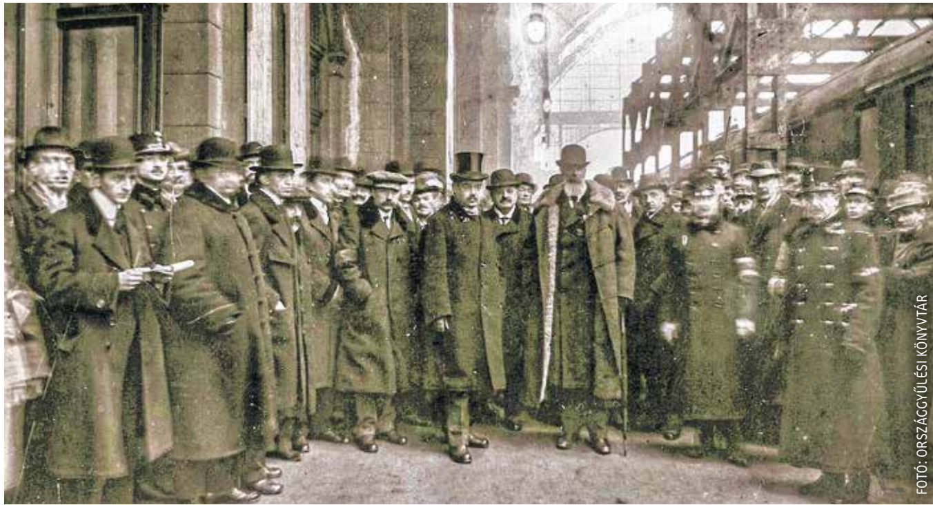
Az Apponyi Albert által vezetett magyar békelegáció búcsúztatása a Keleti pályaudvaron 1920. január 5-én.

hipnotizálták a párizsi döntéshozókat, de ebben a kérdésben nem jutottak eredményre. Az antant országai minden igyekezetükkel megpróbálták elgáncsolni a cseh politikuskok tervét, mely ha megvalósul, ki tudja, mekkora szláv hatalom alakult volna Közép-Európában, melyre az oroszok is könnyen szemet vehettek volna. A dolog méregfogát azzal lehetett kihúzni, hogy a területet Ausztriának adják. A cseh-délszláv korridor úgy már nem lehetett volna az amúgy