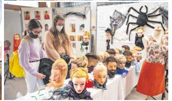
Sopronban négy iskolában, öt helyszínen ismerhették meg testközelből a különböző szakmákat az érdeklődő fiatalok.