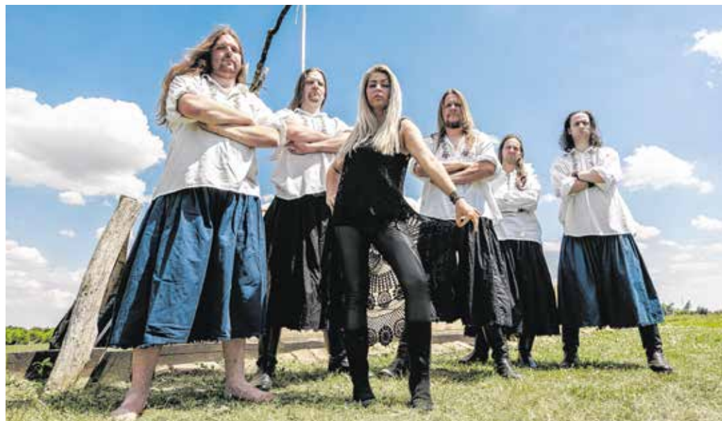
A Dalriada már 12 lemezt adott ki – a decemberi koncerten ezekről hallhat dalokat a közönség.