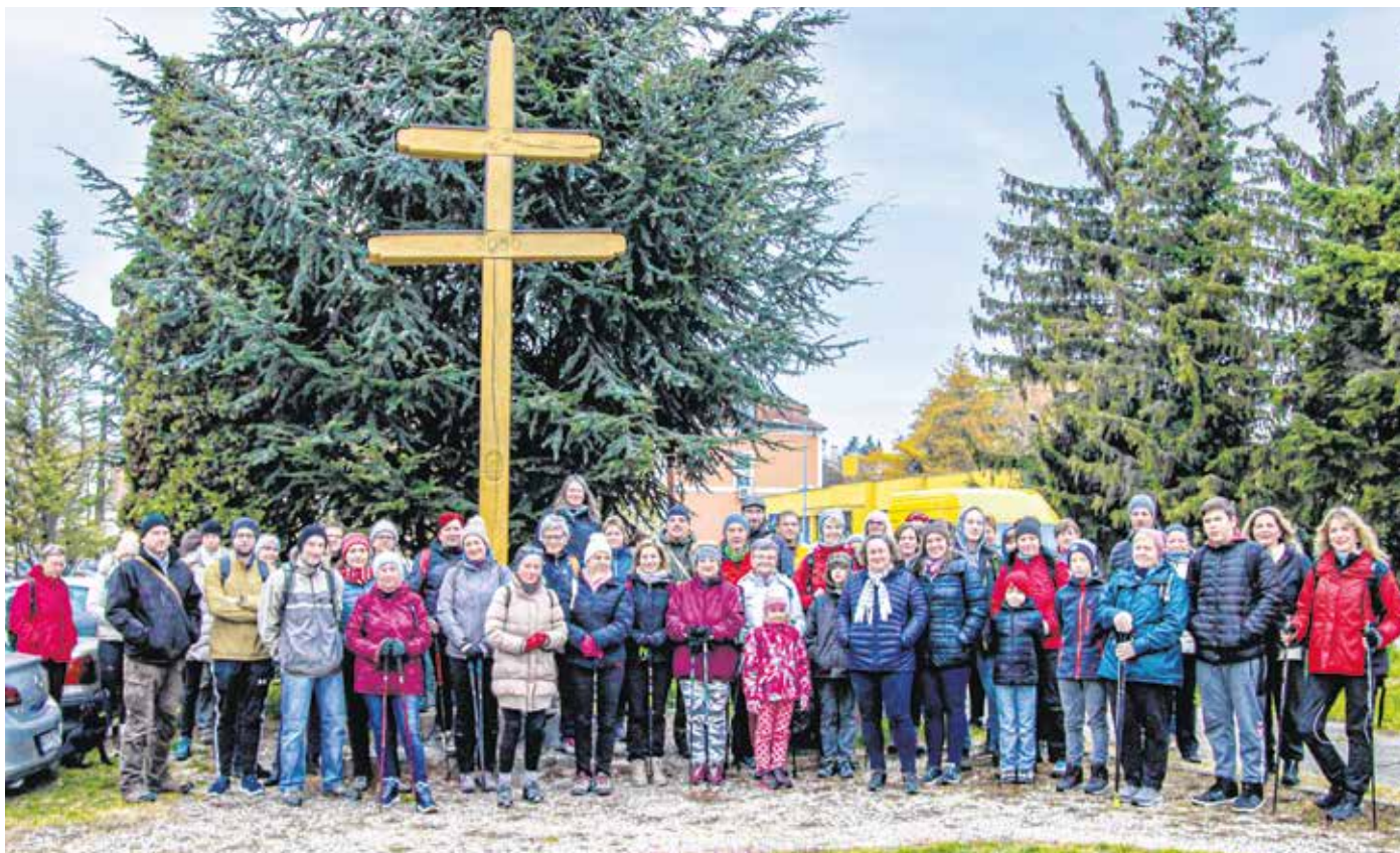
A szombati Téli sportok emlékei a Lövékben című túra résztvevői a Hajnal térről indultak.