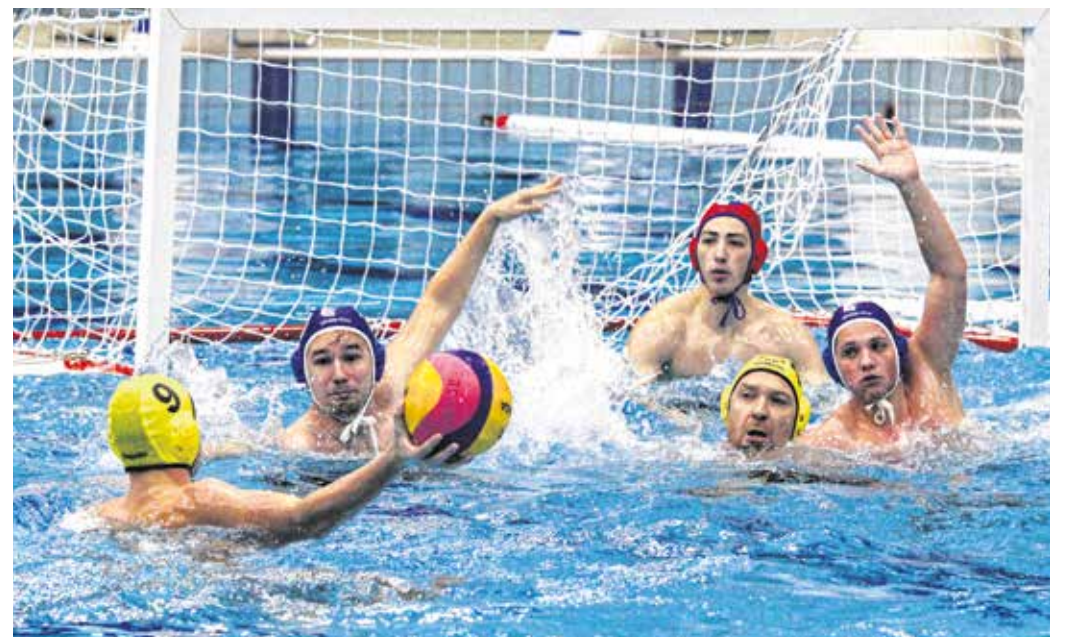
A Soproni Vízilabda Sport Egyesület lényegében az ifjúsági csapatával játszik az ob II-es felnőtt bajnokságban. A cél így is a 3–4. hely megszerzése.

A játékos-edző hozzátette: nagyon fontos a soproni fiatal pólósoknak, hogy tapasztalatot szerezzenek a felnőtt bajnokságban is. Az ob II-t négy csoportra osztották, amelyben öt vagy hat csapat küzd egymással. A Soproni Vízilabda Sport Egyesület hatcsapatos csoportba került, a cél pedig, hogy a középmezőnyben végezzon az alapszakaszban, amelyet bajnoki középmezőnyben, majd rájátszás követ.