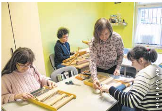
Rendszeresen tartanak fejlesztő foglalkozásokat a fiatalok a Hova Tovább Alapítvány önkéntesei.

15 éve alakult meg az alapítvány, amely a fogyatékkal élő kamaszok és ifjú felnőttek, illetve szülei támogatását tűzte ki céljául. Egyre bővebbek a lehetőségeik: a mozgásterápiától kezdve a kézművességen át a