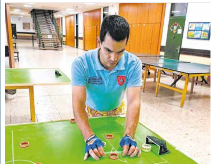
A SMAFC szektorlabda szakosztályának versenyzői már négy szakágban gombfocizhatnak.

A soproni szektorlabda fejlődését jelenti, hogy a jövőben több szakágban is országos, ranglistapontszerzős nagy versenyt rendezhet a SMAFC.