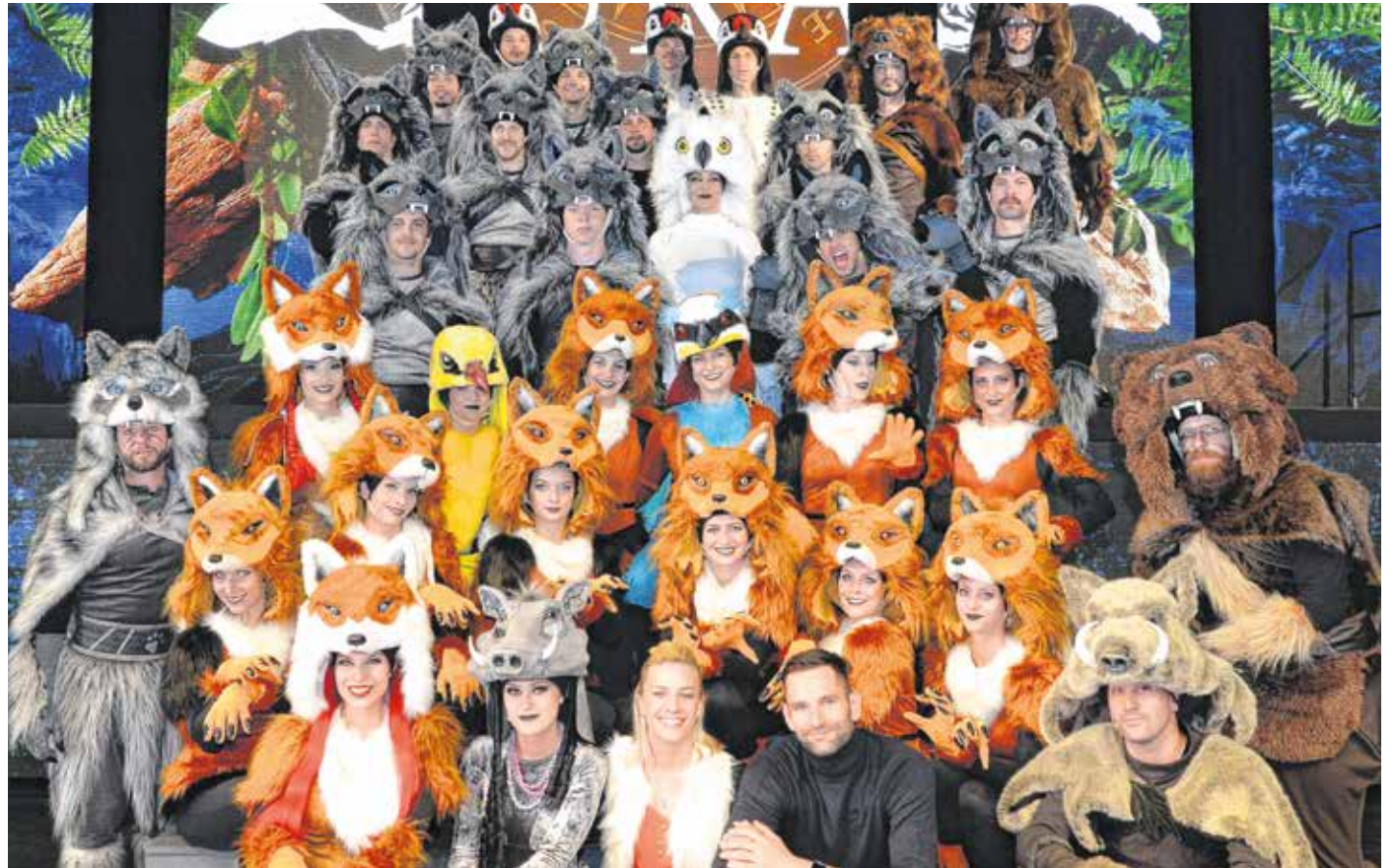
A Vadak ura című nagyszabású családi musical a Soproni Petőfi Színház és a TBG Production közös előadása, július 22-én, 23-án, 29-én és 30-án mutatják be a barlangszínházban.