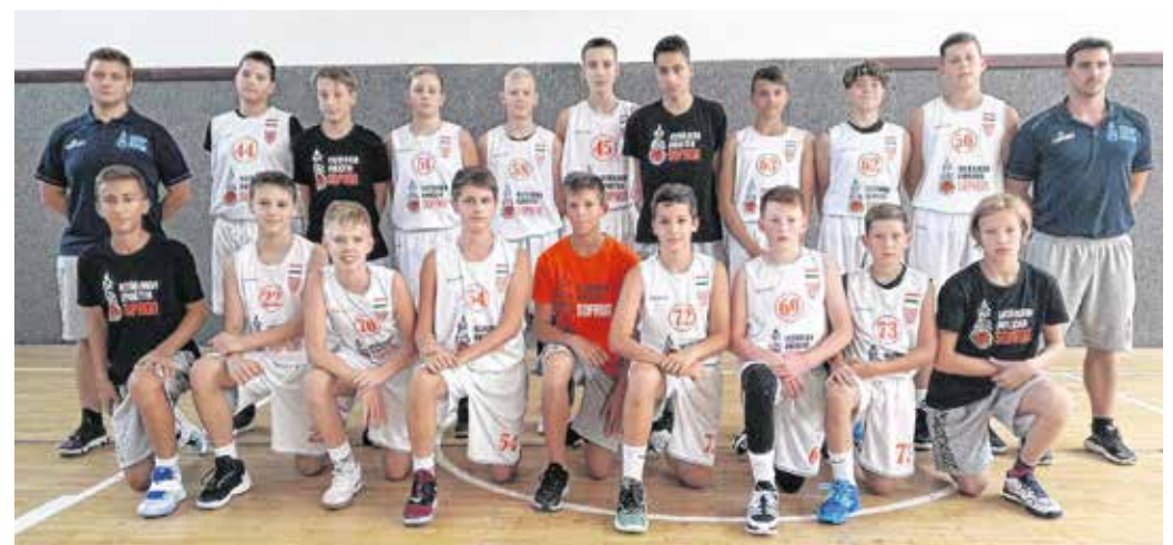
A Soproni Sportiskola négy együttessel vesz részt az U14-es bajnokságban, felvételünkön az A csapat