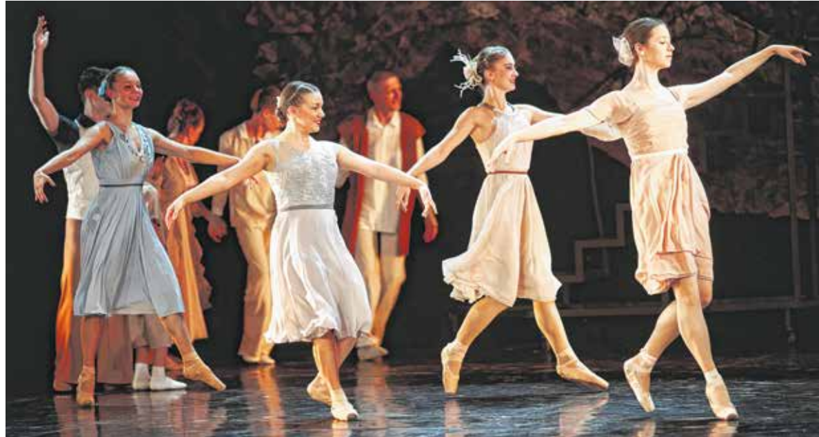
A Sopron Balett folytatja a próbákat, hogy a Stabat Mater táncmű a korlátozások feloldása után azonnal játszható legyen. A tervek szerint a Padlás előadásai is folytatódnak a télen.