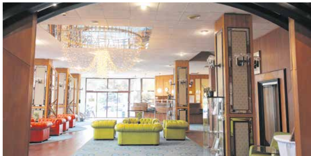
Máskor zsúfolt, most üres a Hotel Sopron fogadótere