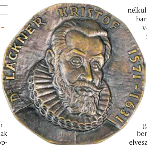
Lackner Kristóf Renner Kálmán (1927–1994) soproni éremművész alkotásán