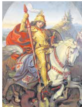
Id. Storno Ferenc Szent György ábrázolása.

A Szent György utca 1. háromemeletes lakóháza