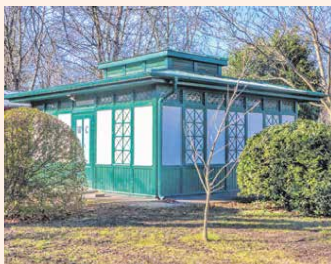
Az Erzsébet-kertben található, jelenleg is működő „zöld ház”.

Ezzel együtt egy új fogalom és foglalkozás is született, a „vécésnéni”. A korabeli rendelet szerint: „Minden egyes nyilvános