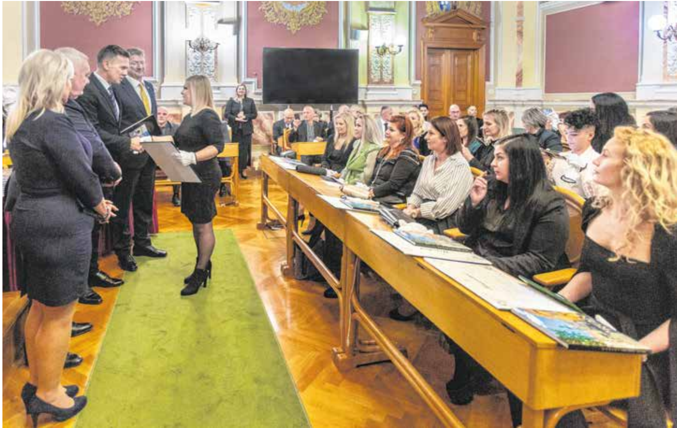
A pénteki rendezvényen a legnagyobb adózók elismerése után harminc új mestert is felavattak.