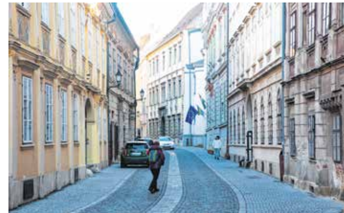
A Szent György utca különleges, két emeletnél magasabb házak barokk stílusú, egységes képét mutatja.

A Prépost-ház a Szent György utca 5. alatt található. A jezsuita rend feloszlása után a Szent György-káptalan prépostjává lett. A Káptalan-vagy Vitnyédy-ház a Szent György utca 7. épülete. Vitnyédy István Sopron jogásza, a város jegyzője, Zrínyi Miklós tanácsadója és bizalmasa volt.