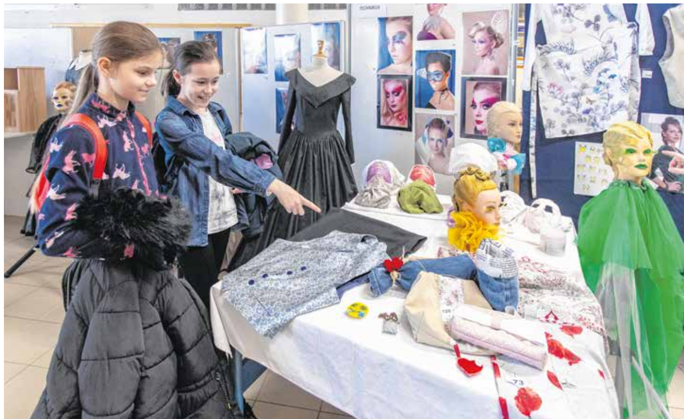
A szakmák délelőttjén az érdeklődő általános iskolások és szülei testközelből ismerték meg az oktatást.

A szakmák délelőttjén Sopron négy középiskolája öt helyszínen nyolcvan programmal várta az érdeklődőket. A múlt csütörtöki program megnyitóján Kuntár Csaba, a Soproni Szakképzési Centrum főigazgatója arra biztatta a tanulókat, hogy a helyszíneket bejárva szerezzenek sok tapasztalatot és élményt, mely később nagy segítségükre lehet szakmájuk kiválasztásánál. – Ezt a döntést meghozni majdnem olyan nehéz, mint amilyen nehéz volt Frodónak, a Gyűrűk Ura szereplőjének elvinnie a gyűrűt Mordorba. Kívánom nektek, hogy találjátok meg az álomszakmátokat, melyhez igyekszünk minden segítséget megadni – mondta köszöntőjében dr. Farkas Ciprián.