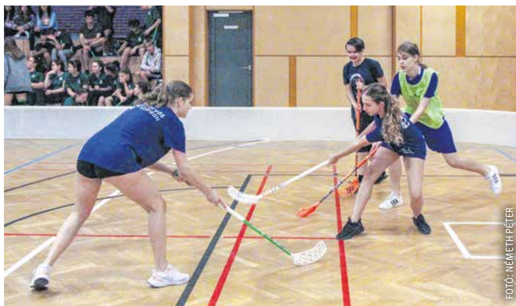
Sopron ismét floorball, azaz teremhoki diákolimpiai döntőknek adott otthont.

korong helyett pedig egy kis méretű labdát kell az ellenfél kapujába juttatni. A jégkorong ellentétben a floorballnál nincs védőfelszerelés a játékosokon, a kispályás verzióban 3–3 mezőnyjátékos alkot egy csapatot, kapus nincs. A teremhokiban a test-test elleni küzdelem nem megengedett, tehát nincsenek olyan látványos ütközések, nincsen lökés vagy szorítás, ami a