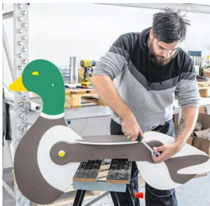
A Németh Greens Kft. újrahasznosított anyagokból készít rugalmas kültéri felületeket, játszótéri eszközöket.

A Németh Greens Kft. újrahasznosított anyagokból készít rugalmas kültéri felületeket, például sportpályák, játszótérek gumiborítását, napelennel működő okosbútorokat, valamint magyar faanyagból játszótéri eszközöket. – Nagyon fiatalos, innovatív a csapatunk, két irodát is bérlünk, hogy mindenkinek legyen kényelmes helye, emellett kihasználjuk a