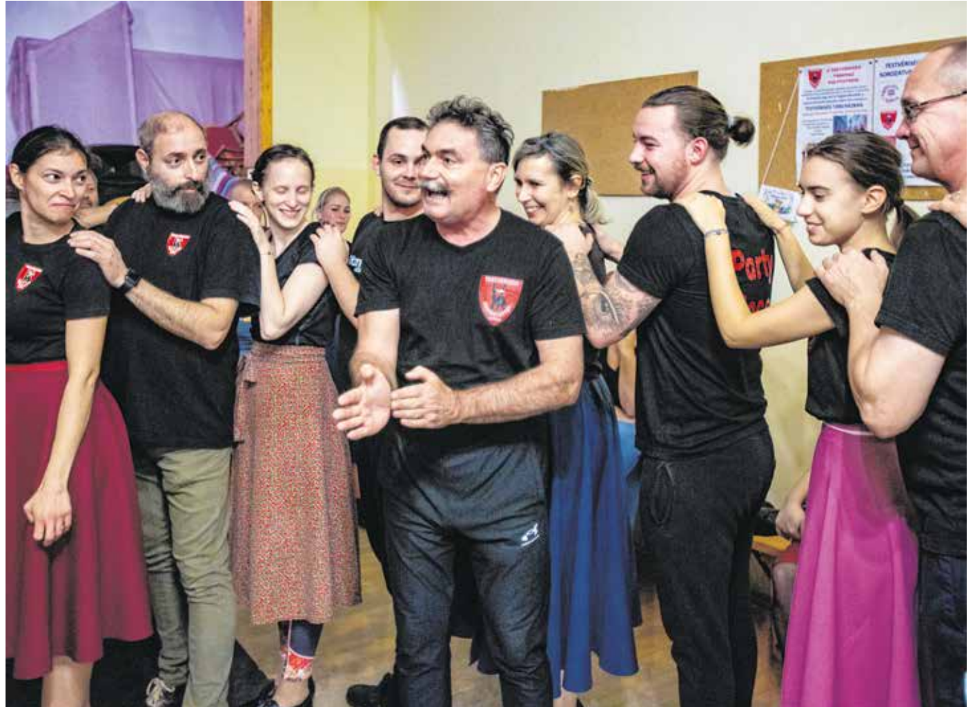
A Testvériség Német Nemzetiségi Néptáncgyűttes már gőzerővel készül a november 25-i fellépésre.

Az ünnepi gálaműsorban a táncgyűttes 60 tagján – a legfiatalabbaktól kezdve a felnőttekig – kívül a már nem aktív tagok is vállaltak szerepet. – A kerek évfordulás eseményünkhöz mindenki szeretne hozzátenni, mert mindannyiunknak fontos ünnep ez. Jubileumi előadásunk Sopron egyik legnagyobb német nem-