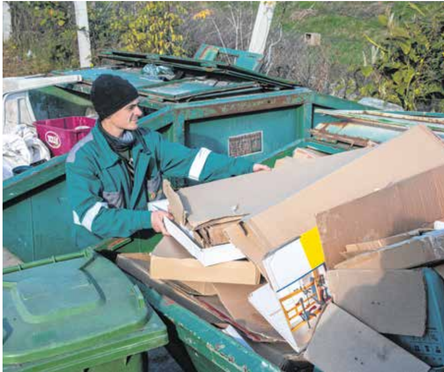
A Harkai úti (balra) és a Pozsonyi úti (jobbra) zöldudvarokban a lakcímkártyával rendelkező magánszemélyek rakhatják le a hulladékaikat.

Talán nem ismert a lakosság körében, hogy minden