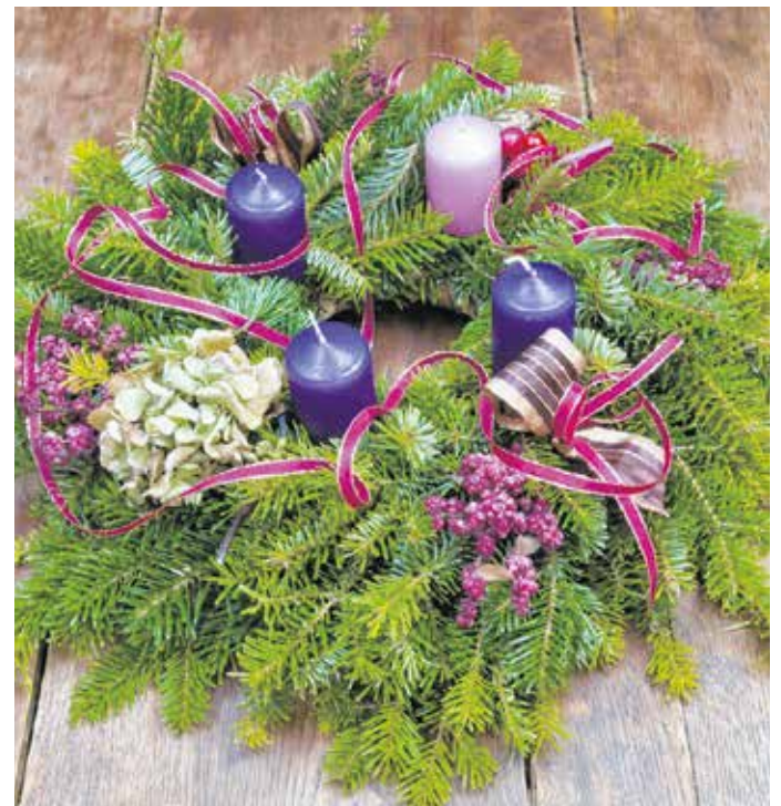
A keresztény szokásoknak megfelelően három lila és egy rózsaszín gyertya díszíti a koszorút.