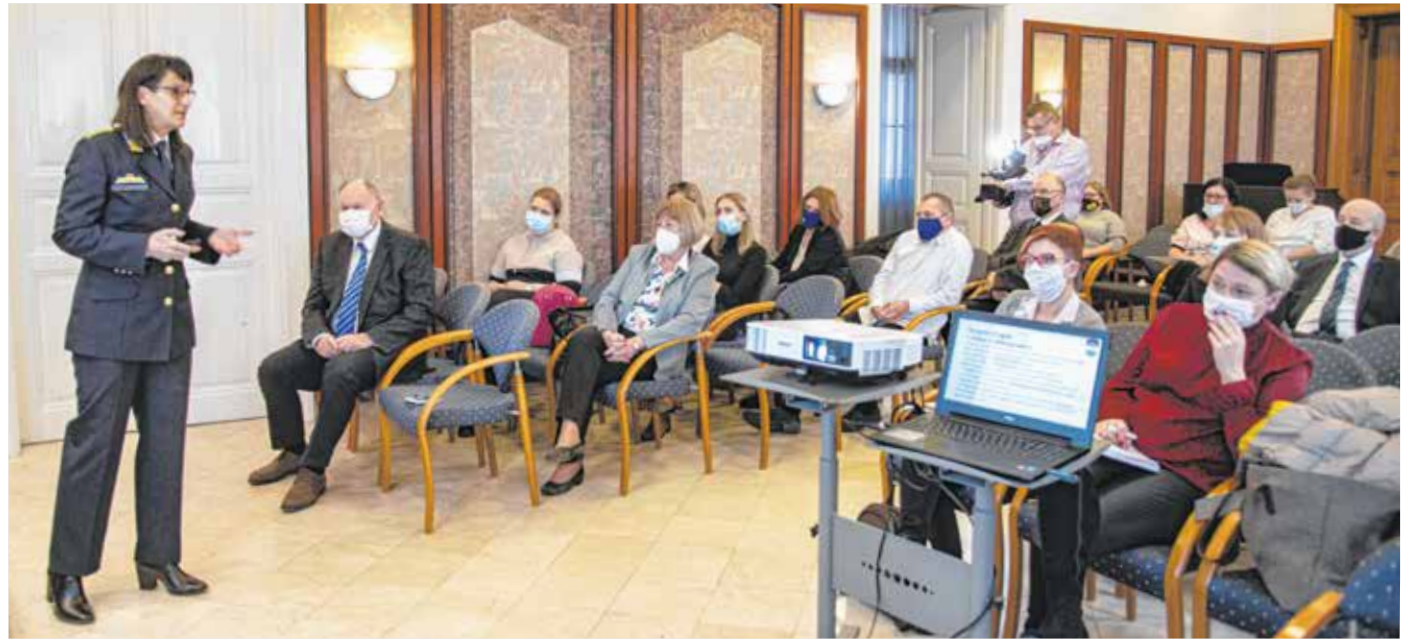
A fórumon soproni pedagógusok, iskolaigazgatók, egészségügyi szakemberek hallgatták meg az előadásokat.