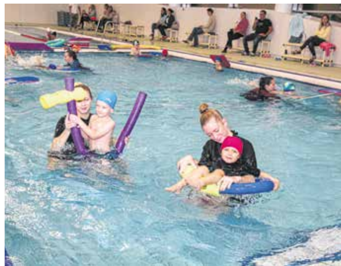
Az Aquarázs egyesületben 3 éves kortól oktatják a gyerekeket.

rendszeresen szervez programokat, fellép a városi ünnepségeken. Tehetségfejlesztő tevékenységét a MŰV-ÉSZ projekt keretében valósítják meg. 2012-ben kiérdemelték a Sopronért Emlékéremet, 2016-ban a Civitas Fidelissima díjat, 2017-ben pedig „Bonis Bona – A nemzet tehetségeiért” díjat kapott a szervezet kiemelkedő tehergondozó tevékenységéért. A Pendelyes a Hagyományok