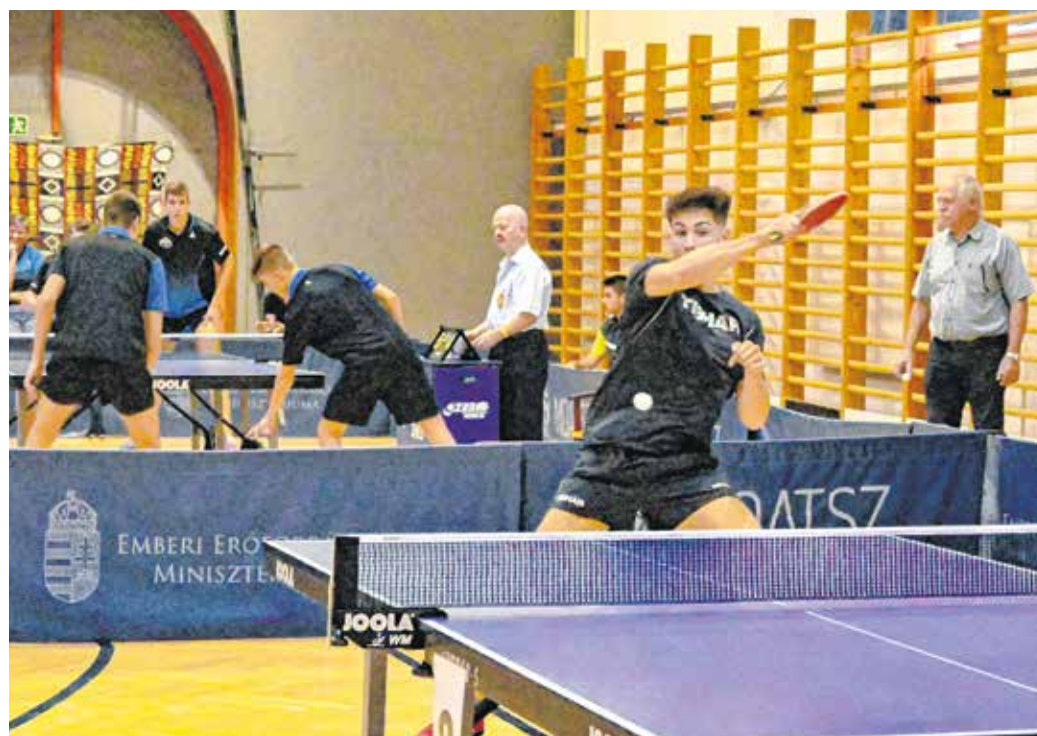
A szervezők egyik célja az asztalitenisz népszerűsítése.