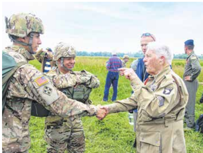
Amerikai ejtőernyős katonák a 101. légi szállítási hadosztály egyik veteránjával.