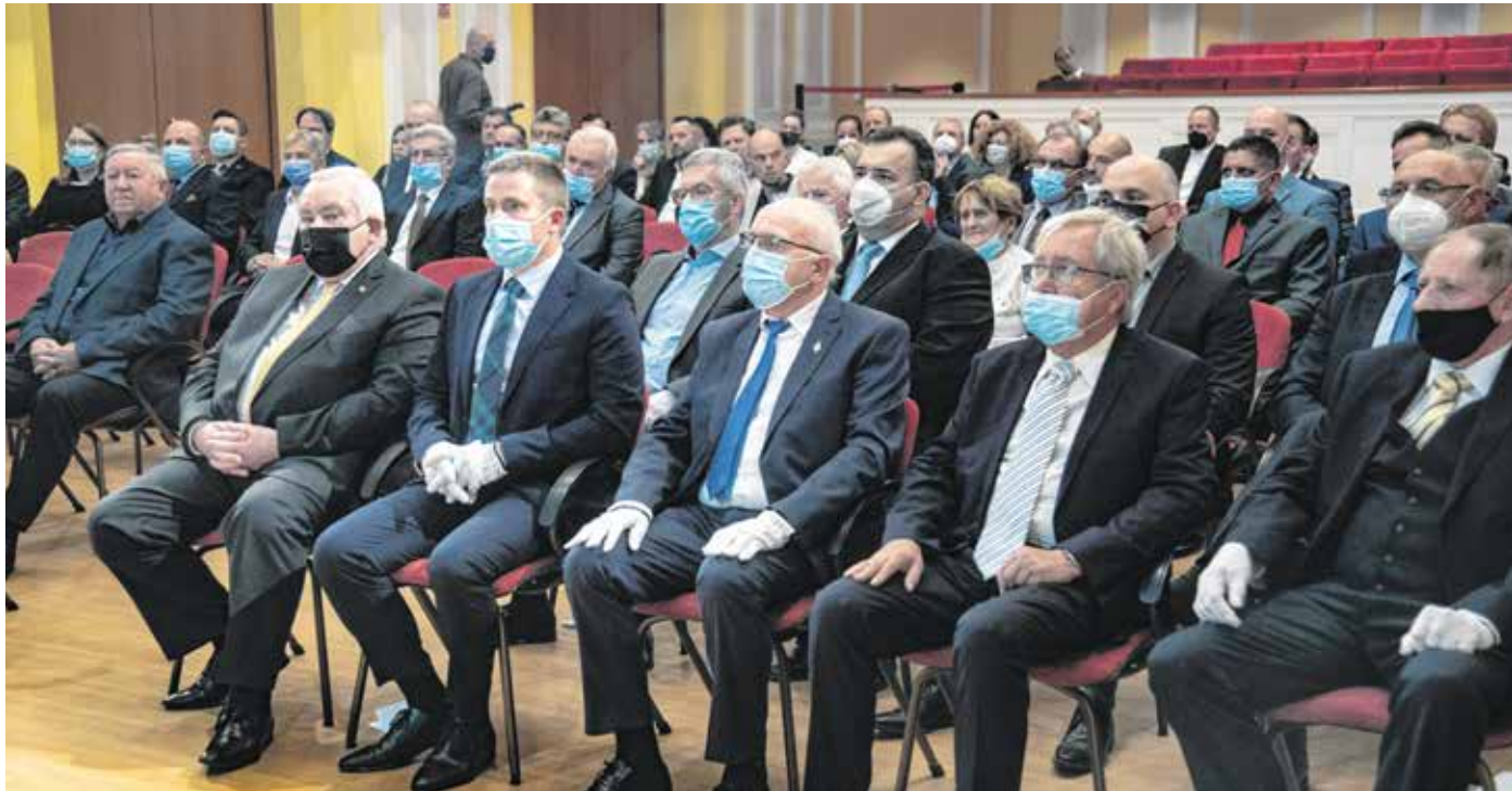
25 éve tiszteleg a város a legnagyobb adózók – az egyéni és társas vállalkozások – előtt.