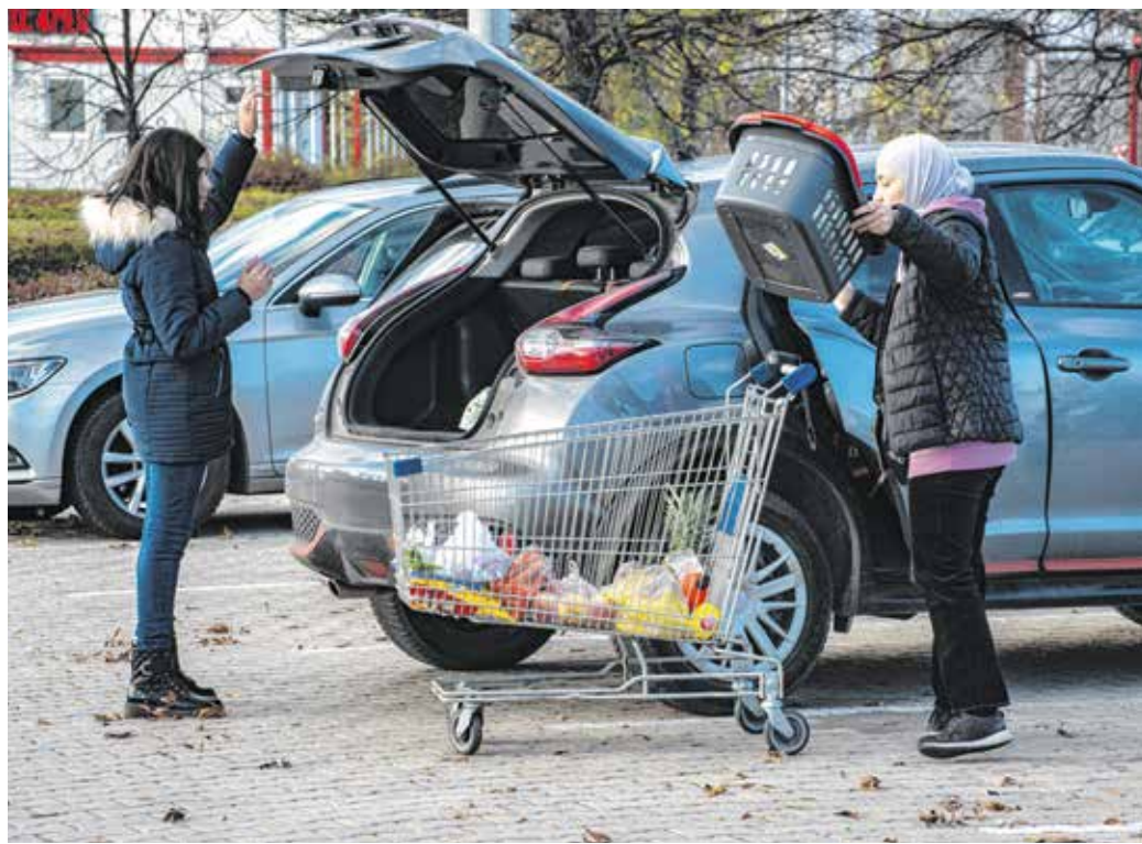
Közeledik a karácsony – fontos, hogy tisztában legyünk vásárlói jogainkkal.