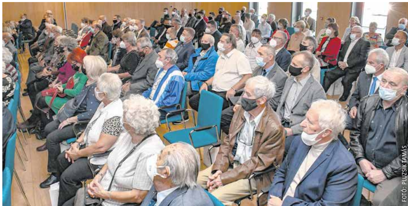
A jubileumi rendezvényen köszöntötték az SVSE legeredményesebb sportolóit, valamint az egyesület volt és jelenlegi tagjait.

– Hogyan működött együtt az elmúlt száz évben a GYSEV és az SVSE?