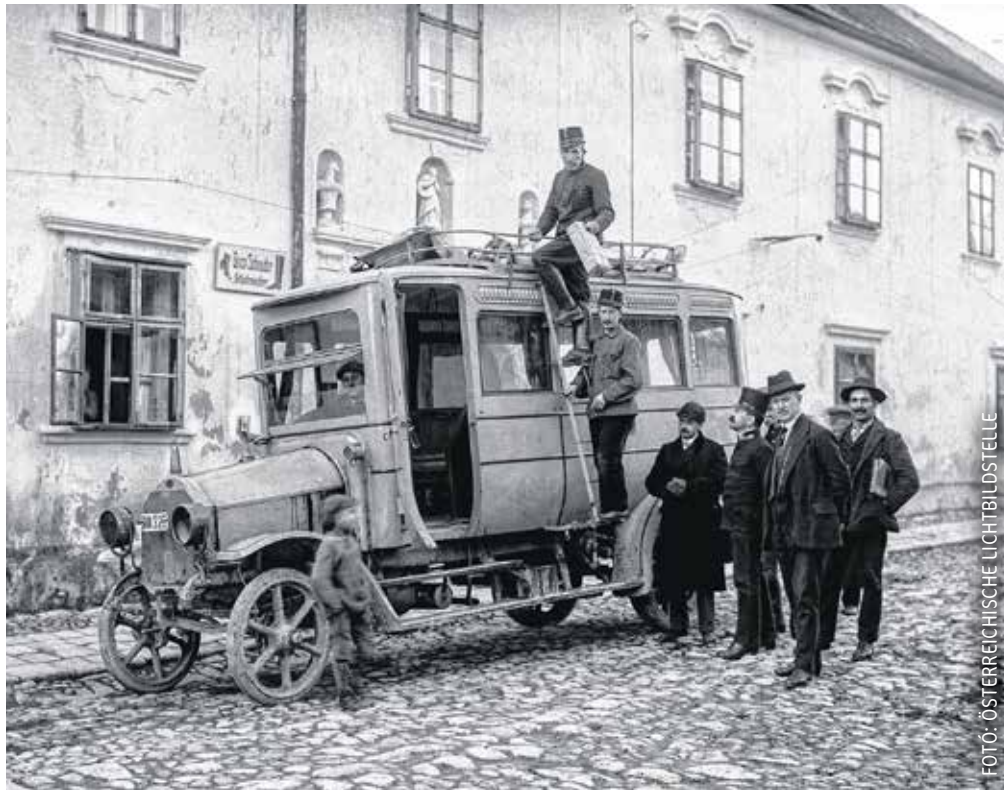
A Burgenland elfoglalása (1921) során rekvirált autóbussz és utasai.

Mint minden, a nemzetközi helyzet akkor is folyton változott. Európában kormányok jöttek és mentek, új elközelések alakultak a régi, tartós érdekek védelmében. A magyar kormány egyelőre nem sokat tehetett, ezért az időhúzásra játszott. Először a szerb hadsereg baranyai