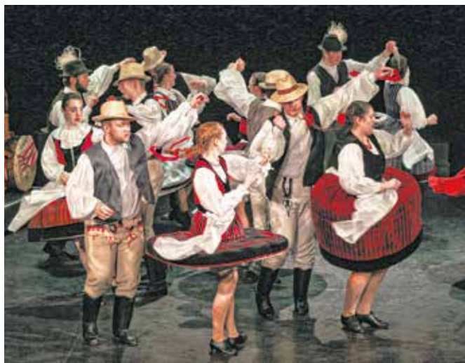
A Pendelyes fennállásának 30. évfordulóját ünnepli.