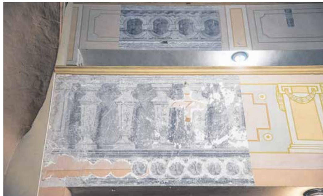
A festőrestaurátor egyenként lebontotta a falon lévő rétegeket, így került elő az 1700-as évekbeli festés.

A restaurátor fantáziáját egy fotó mozgatta meg igazán: ezen szerényen ugyan, de látszott egy, az előbbieknél régebbi falfestés. Szintén