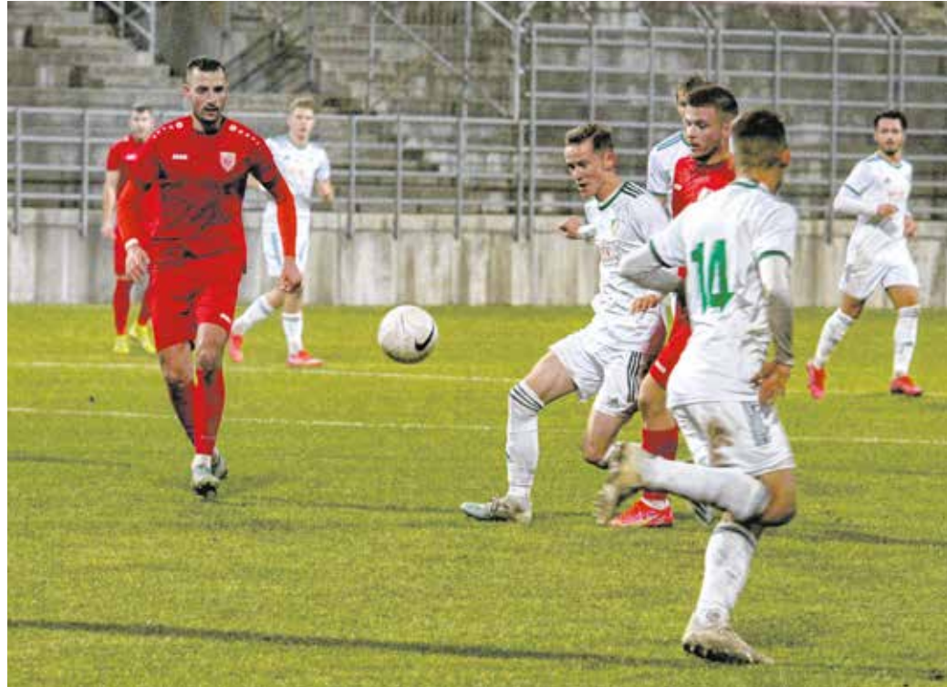
A vezetőedző szerint nem játszott rosszul a Sopron a Győr ellen, viszont nem tudott élni a helyzetekkel, így 2-1-re kikapott.

A fordulás után tovább támadott a hazai csapat, és a több kimaradt ziccer után végül összejött az egyenlítő találat. Később még a vezetés is