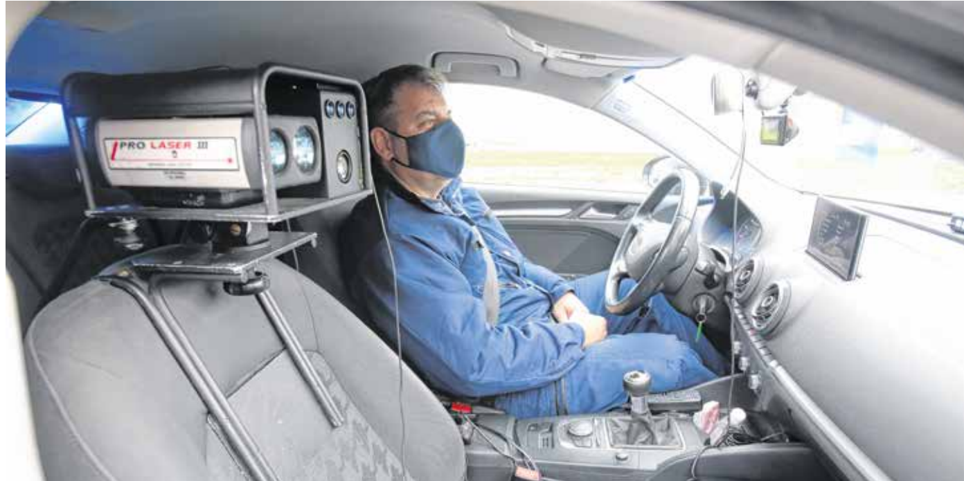
A legmodernebb technikával felszerelt autót egy éve használják a soproni rendőrök