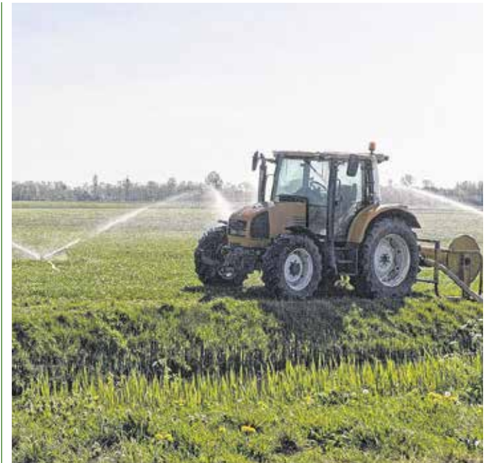
A mezőgazdasági öntözőkutat legálissá tételét is megoldaná az új szabályozás FOTÓILLUSZTRÁCIÓ

A szakember úgy látja: egyéni szinten fontos a helyi termelők és vállalkozások előnyben részesítése, az épületeink szigetelése, az ételkészítés-pazarlásunk és fogyasztásunk csökkentése, a tartós, csomagolásmentes termékek választása.