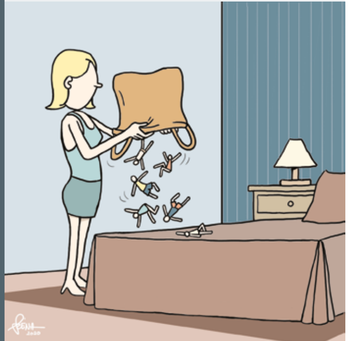
Szénási Ferenc (Széna) soproni karikaturista alkotásai hétről hétre.