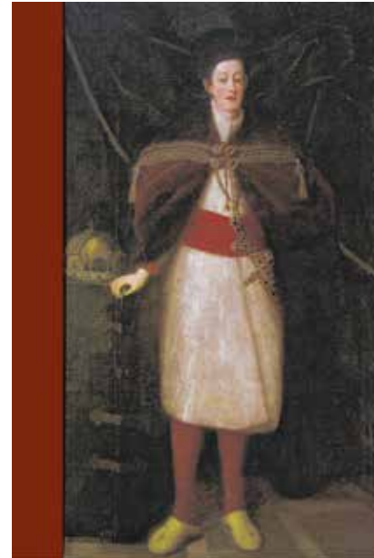
ANNALES ARCHIVI SOPRONIENSIS NO. 2.

– A 2012 óta működő „Lendület” Szent Korona Kutatócsoport legfőbb nemzeti ereklyénk történetjének vizsgálata mellett a magyar koronázások feltárásával is foglalkozik. A 17. században három koronázó országgyűlést (1622, 1625, 1681) tartottak Sopronban. Az 1622 nyárinak 2014-ben már önálló kötetet szenteltünk (Egy új együttműködés kezdete. Az 1622. évi soproni koronázó országgyűlés), ahogy koronánk soproni tartózkodásainak is (A Szent Korona Sopronban). Az új kiadvány e munkák szerves folytatása.