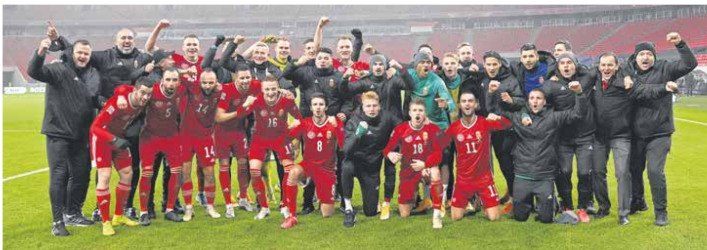
A győztes magyar csapat a labdarúgó Nemzetek Ligája B divíziójában lejátszott Magyarország–Törökország mérkőzés (2–0) végén a Puskás Arénában november 18-án

hiszen nyolc meccsen egyetlen vereség mellett ötször győzött és két döntetlent ért el a csapat. A tréner úgy véli, ahhoz, hogy jobb képességű együttesek ellen eredményes lehessen a magyar válogatott, mindenképpen szükséges bizonyos hátrányokat fizikai és akaratbeli pluszokkal kompenzálni. A szövetségi kapitány szerint ez mindvégig megfigyelhető volt a pályán, és talán ez lehet a legfontosabb tényező, amiből a válogatott erőt meríthet az előttünk álló időszakban is.