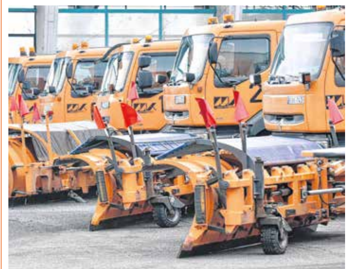
Több mint 1100 munkagépet mozgósíthat az idei télen a Magyar Közút Nonprofit Zrt.

A szakemberek arra kéri az autósokat, hogy nyári gumijukat még a tartós fagyok előtt cseréljék át téli közlekedésre alkalmas, megfelelő minőségű és állapotú abroncsokra. Az őszi és téli hónapokban is érdemes utazás előtt tájékozódni az aktuális forgalmi helyzetekről. A www.utinform.hu oldalon számos hasznos közlekedési információhoz juthatnak a közlekedők, a téli územ alatt néhány óránként országos összehívást is publikálnak a szakemberek az aktuális útviszonyokról, forgalmi helyzetről a weboldalon.