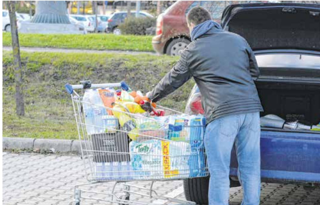
A hétfégi nagybevásárlásnál megtelnek a kocsik – a kezdeményezés szervezői azt kérik, hogy november 27-én senki ne vegyen semmit

A szakember tapasztalatai alapján karácsony közeledtével túl gyorsan döntünk személyi kölcsön felvételéről vagy hitelkártya igényléséről, ugyanakkor átsiklunk a hozzá kapcsolódó feltételek, az apróbetűs részek felett, ami a törlesztés során kellemetlen „meglepetéseket” okozhat. Kisebb