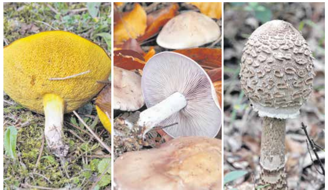
Szemcsésnyelű fenyőtínóru, lila pereszke és őzláb – idén sok gomba termett