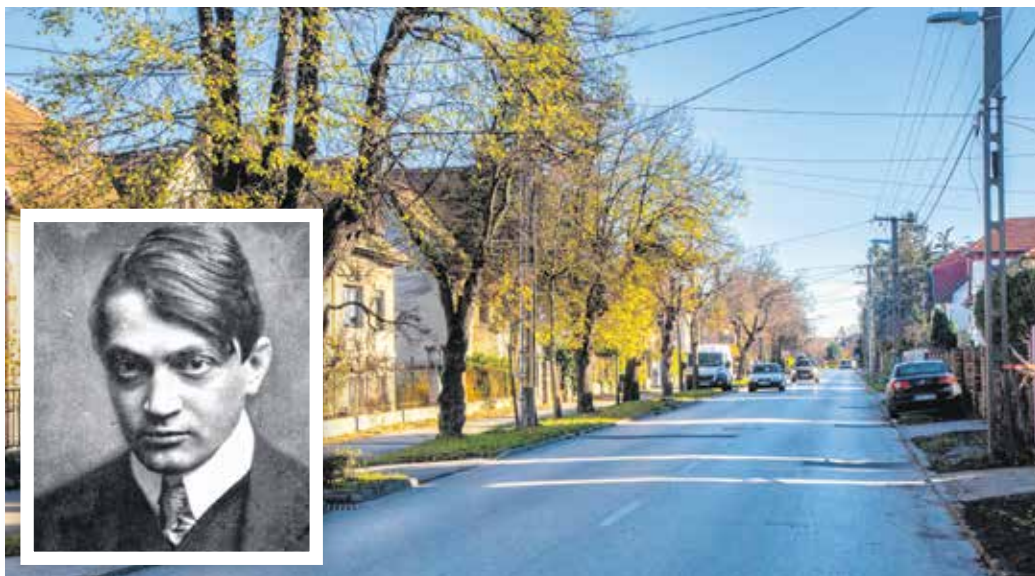
Az Ady Endre utca a Hajnal tértől tart a Frankenburg úti aluljáróig.