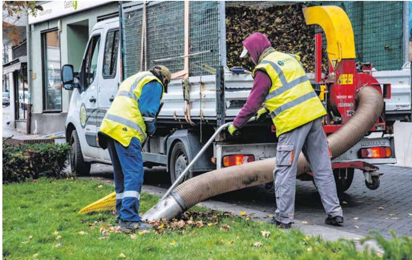
A Sopron Holding Zrt. munkatársai meghatározott ütemterv szerint takarítják a város kezelésébe tartozó közutakat. Egy nagy és egy kisebb seprőgéppel távolítják el az utcákról a lehullott leveleket. FOTÓ: FILEP ISTVÁN

Meghatározott ütemterv szerint takarítják a város kezelésébe tartozó közutakat is, egy nagy és egy kisebb seprőgéppel távolítják el az utcákról a lehullott leveleket. Az