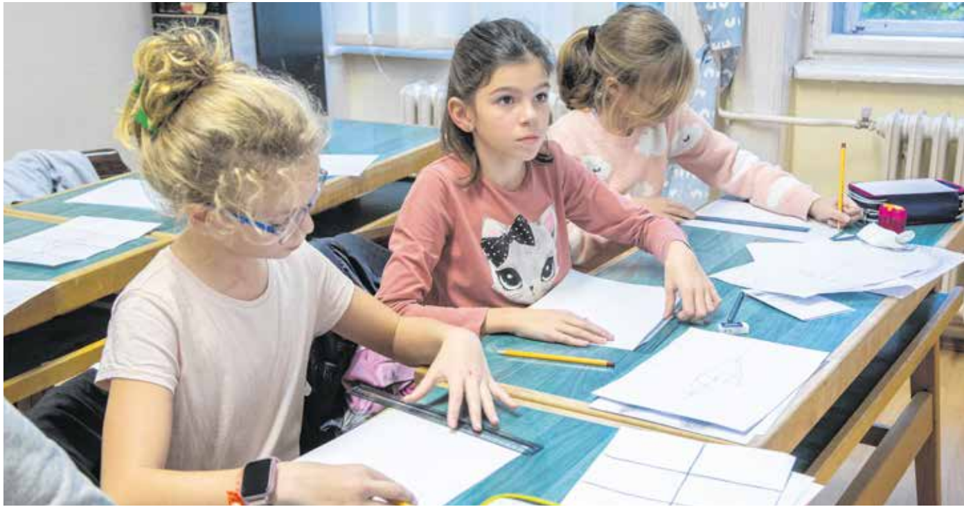
A művészeti tevékenységek jótékony hatással vannak a személyiségfejlődésre és a társas kapcsolatokra is.

Mostanra sok család szembesült azzal, hogy a gyermek ugyan nagyon élvezi az összes különórát, de a tanulásra nem marad ideje; kimerült, szorong, szétszórt. Ilyenkor összeül a családi kupaktanács, el-