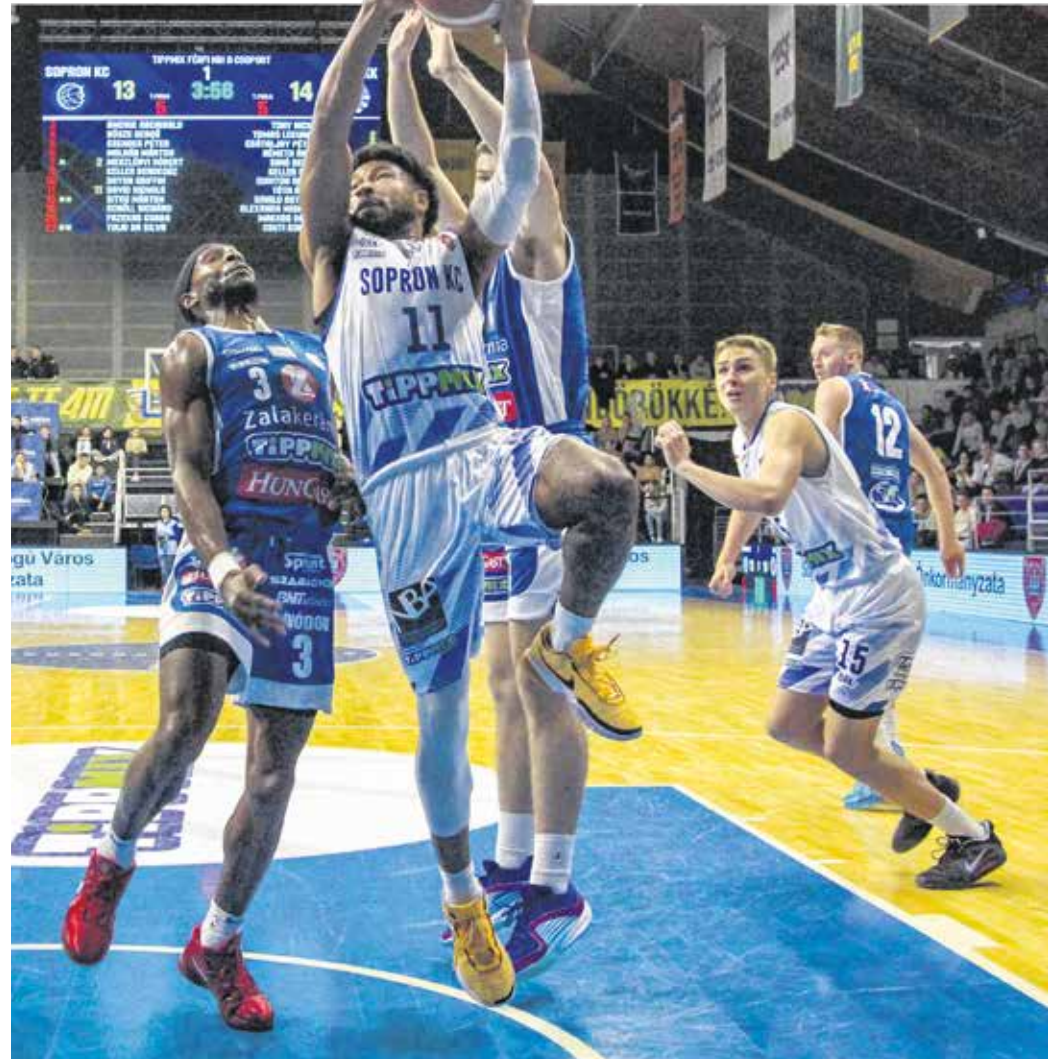
Jó első félidő után fájó vereséget szenvedett a Zalaegerszeg ellen a Sopron KC.

– A céljaink évek óta ugyanazok: szeretnénk a play offba kerülni, azaz a legjobb nyolc hely valamelyikén végezni a bajnoki alapszakaszban. Ez az elmúlt években rendre sikerült is, most sem vagyunk messze ettől, egy-két győzelem hiányzik. Azonban van egy másik lényeges elvárás is: nagyon sokat kell dolgoznia az új vezetőedzőnek azon, hogy a fiatal, soproni játékosok meghatározott koncepció alapján beépüljenek a csapatba, hiszen ezek a fiatalok jelentik a soproni profi kosárlabda jövőjét.