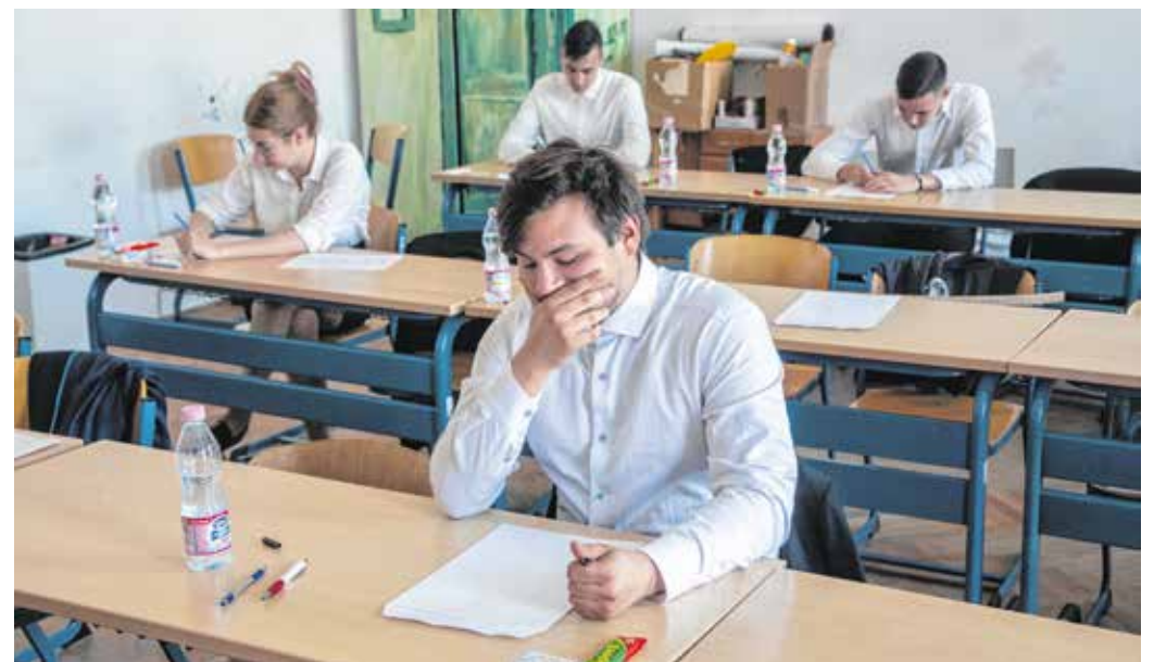
Az érettségi pontszámítás alap- és osztatlan képzés, valamint felsőoktatási szakképzés esetén továbbra is 500 pontos rendszerben történik.

A 2024-ben induló felsőoktatási képzésekre jelentkezők több új pontszámítási szabályra készülhetnek. A felsőfokú intézmények dönthetnek az 5. érettségi és az 5., esetleg 6. pontvívó tantárgyról is. A kötelező tantárgyak – magyar nyelv és irodalom, történelem, matematika, idegen nyelv – mellett a felsőoktatási intézmények meghatározhatnak egy ötödik, a képzési területhez illeszkedő középiskolai tantárgyat. A pontszámításban változik az is, hogy a jelentkezőknek a 9., 10., 11., 12. év végi bizonyítványukat kell feltölteni, és az egyes egyetemeken egyes szakjai választják ki a számukra szükséges tantárgyakat. Így más egyetemeken ugyanazon szakjain különböző pontszámok lehetnek a minimumok.