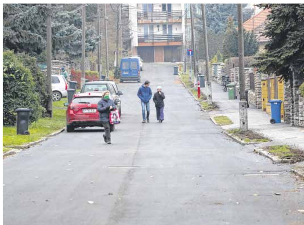
Az Erdész utca lakói örültek a fejlesztésnek, most már sima úton autózhatnak

Megtudtuk, a 250 méter hosszú út felújításának költsége bruttó harmincmillió forint volt.