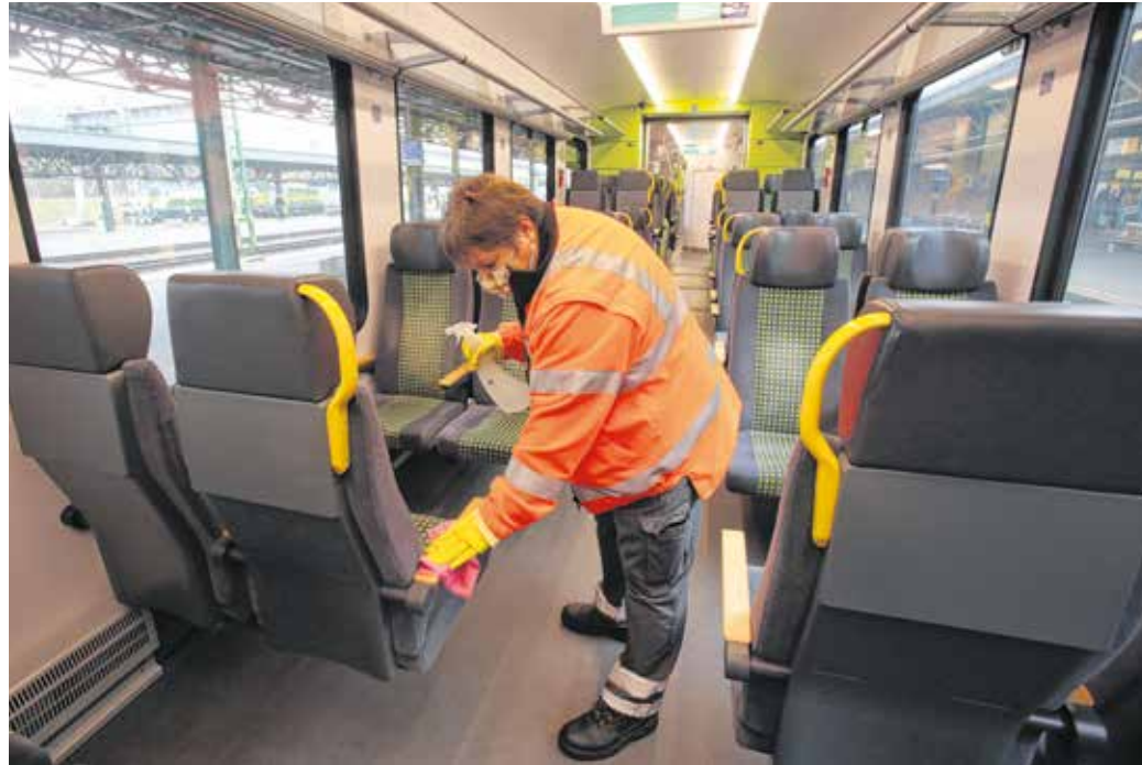
A vonatokat folyamatosan fertőtlenítik, vírusölő vegyszerekkel takarítanak

Mint arról lapunkban korábban beszámoltunk (Magyarország ismét szigorít, Soproni Téma, 2020. november 11.), november elejétől városunkban – a csúcsidőszakokban – a zsúfoltságot csökkentve plusz járműveket állított forgalomba a Volánbusz Zrt. A társaság lapunknak küldött írásos tájékoztatójában kiemelte: a reggeli és délutáni frekvenciát időszakban plusz két busz járja a soproni utakat, folyamatosan figyelemmel kísérik a forgalmat, és amennyiben szükséges, további változtatásokat vezetnek be. Az utasok bővebb információt a www.volanbusz.hu internetes oldalon érhetnek el. A társaság továbbra is fokozottan – minden éjjel és napközben – takarítja az