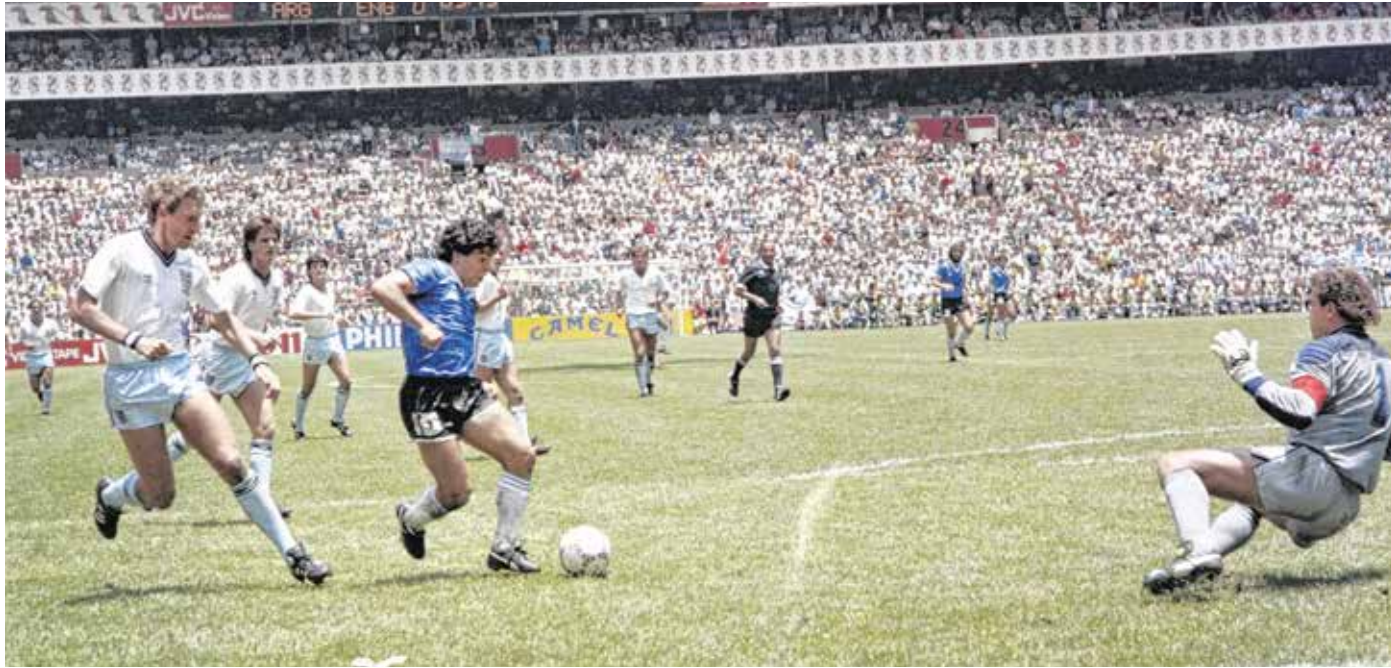
Diego Maradona nagy mérkőzése volt a '86-os mexikói világbajnokságon az angolok elleni