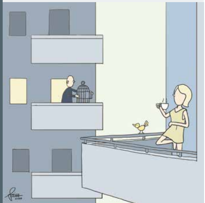
Szénási Ferenc (Széna) soproni karikaturista alkotásai hétről hétre.