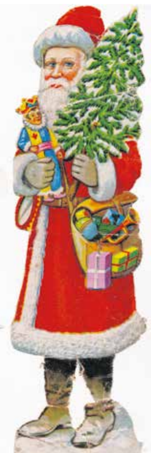
Mézeskalácsra való színes nyomat a 20. század első feléből.