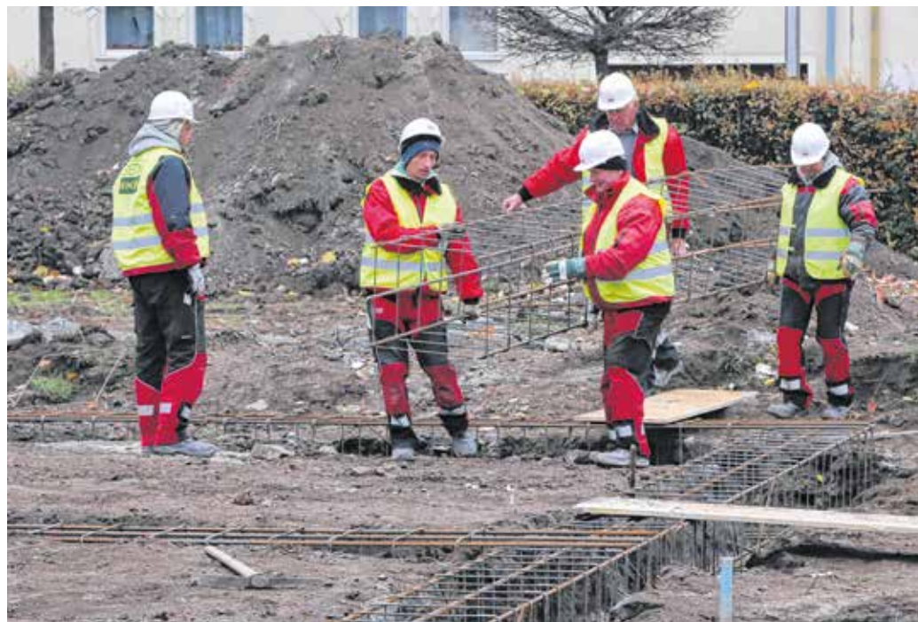
Bővül a Százszorszép Bölcsőde – a munkák már megkezdődtek, a tervek szerint jövő szeptemberre készül el a két új csoportszoba

– A kormányzat politikájához hasonlóan a soproni önkormányzat számára is a gyermek és a családok boldogulása az első, ennek elengedhetetlen eleme, hogy a gyermekeink jó és korszerű körülmények között nevelkedhessenek – mondta dr. Farkas Ciprián polgármester Csizsár Szabolcs alpolgármester jelenlétében. – Magyarországon folyamatosan nő a gyermekvállalási kedv, ezért is fontos, hogy a korszerűsítések mellett új férőhelyekkel bővüljenek a soproni bölcsődék és óvodák. A Százszorszép Bölcsődében most egy új, különálló szárny épül. Az 1981-ben átadott létesítmény épületenergetikai felújítása három évvel ezelőtt valósult meg, ennek köszönhetően csökkent az