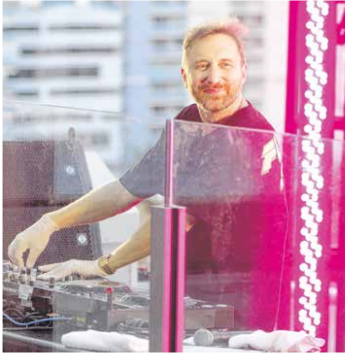
David Guetta az egyik legnépszerűbb dj – elégedett volt a soproni operatőr munkájával

– Egy nagyon komoly előkészítési szakasszal kezdődik, ami bizonyos szempontból fontosabb, mint a forgatás. Ekkor szüretlik meg a pontos koncepció