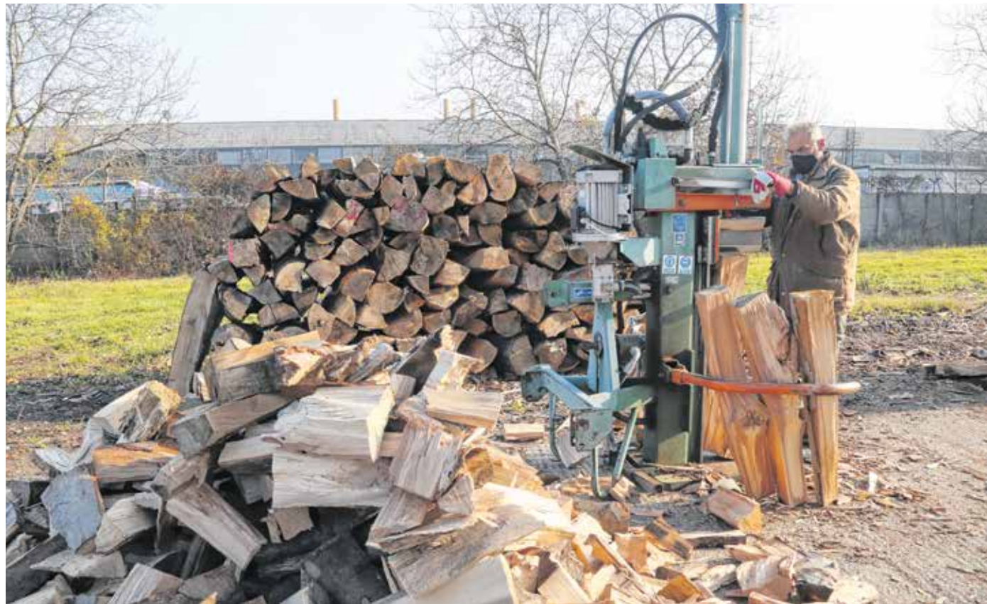
A TAEG Zrt. valamennyi tűzifának kivágott fa helyére új csemetét ültet

Évről évre feltűnnek olyan hirdetések, ahol csalók állnak a háttérben, akik a piaci árnál