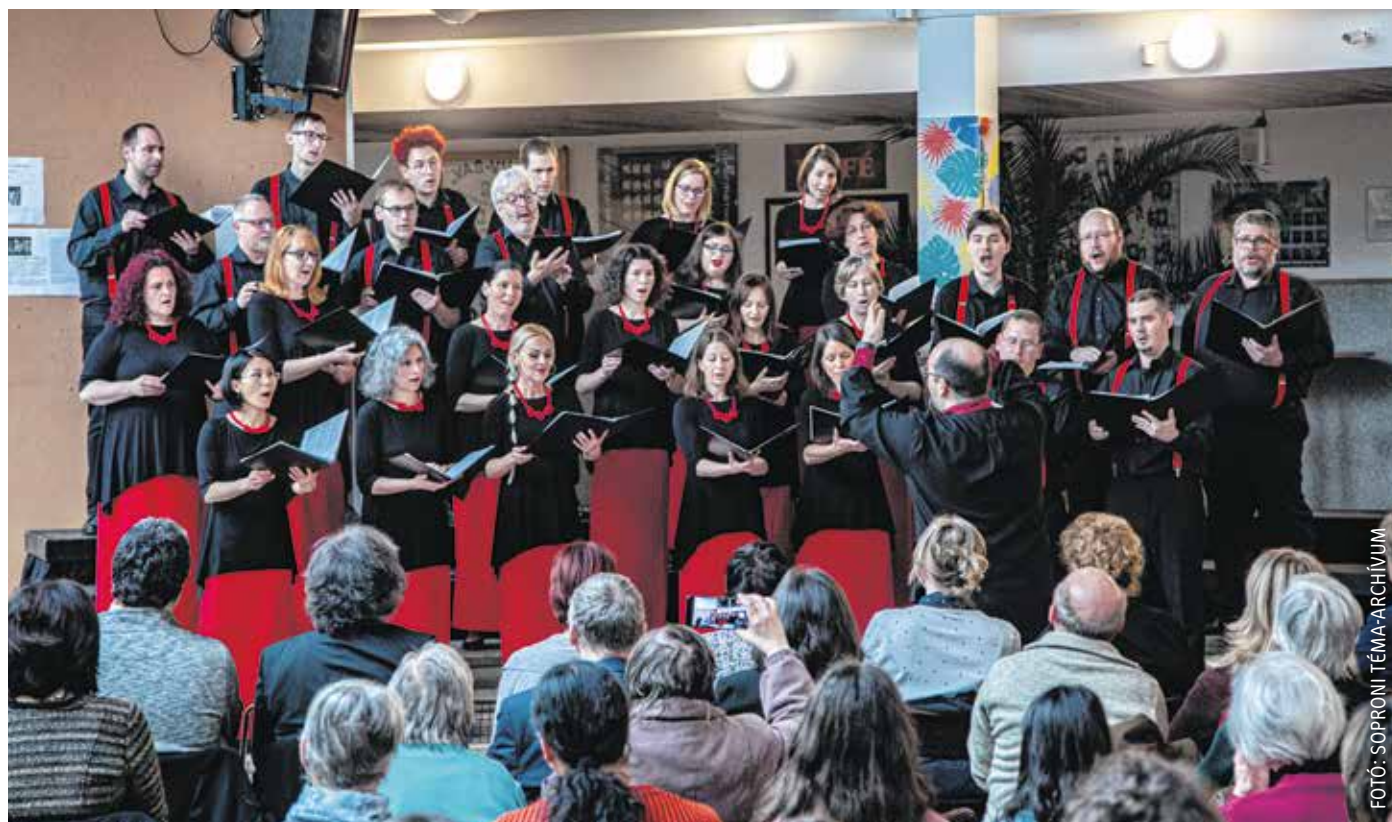
A Kórus Spontánusz nagy utat járt be az elmúlt 22 évben – a sokszínű repertoár és a magas színvonalú előadásmód nem változott.

Ahogy a Kórus Spontánusz Sopron zenei életének meghatározó együttese, úgy az 1938-ban alakult Vox Humana Énekkar is fogalom