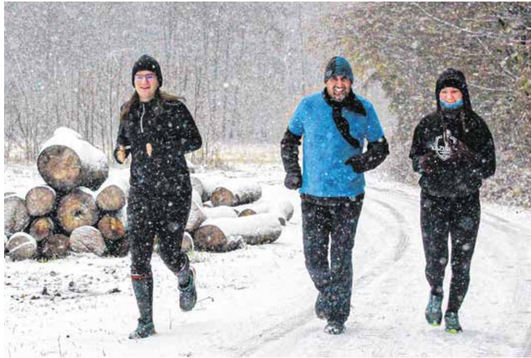
A havas idő nem szegte a sportolók kedvét – idén is népszerű volt a Mirelit Kupa.

– Az idei évben összesen 8 versenyt rendeztünk, kisebbeket és nagyobbakat egyaránt. Fontos hangsúlyozni, hogy nem csupán a tájékozódási futóknak szerveztünk megmérteket, volt például évindító túránk is. Idei rendezvényeink közül kiemelem a húsvéti tojáskereső versenyt, amit gyerekeknek rendeztünk meg a botanikus kertben. A Sopron Trail terepfutóverseny idén is a legnagyobb létszámot hozó sporteseményünk volt, mintegy háromszázötvenen vettek részt a viadalon. A versenynapárban tájékozódási kerékpárverseny is szerepelt.