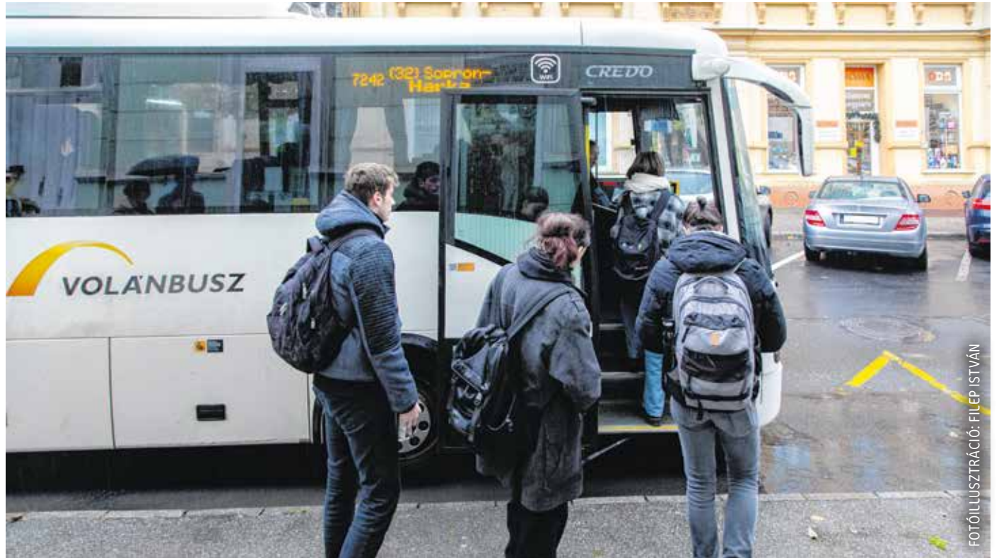
A buszmegállók területileg jól helyezkednek el, közel vannak az iskolákhoz. A szakemberek szerint az átalakítás után diákbarát lesz Sopronban a buszközlekedés. Az új menetrend jobban alkalmazkodik a helyközi járatokhoz és a vasúti menetrendhez is.