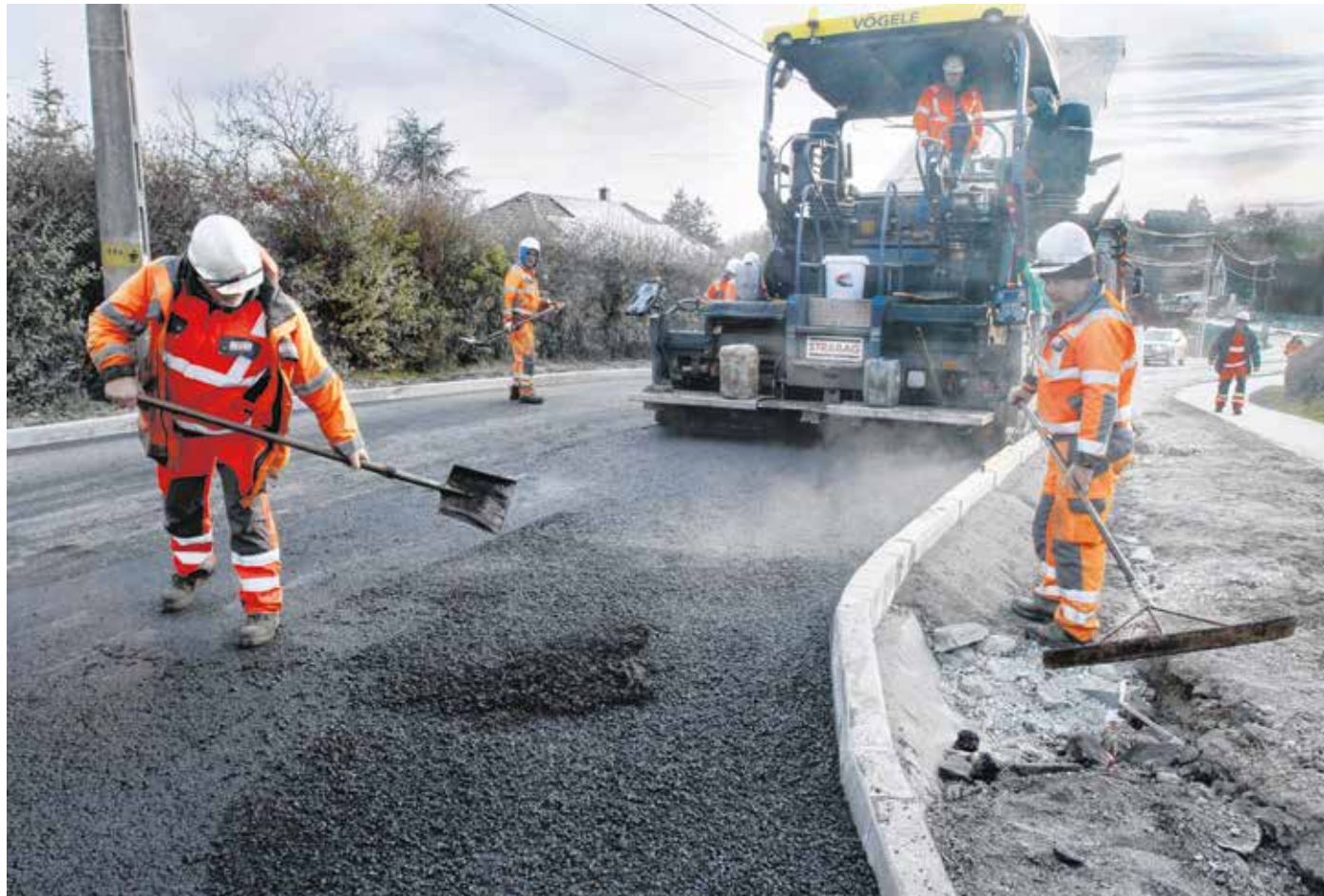
A Virágvölgyi út felső részén dolgoznak jelenleg a szakemberek – itt 400 méteres szakasz újul meg