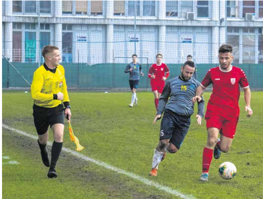
Az SC Sopron 2–1-re nyert hazai pályán a THSE–Szabadkikötő csapata ellen