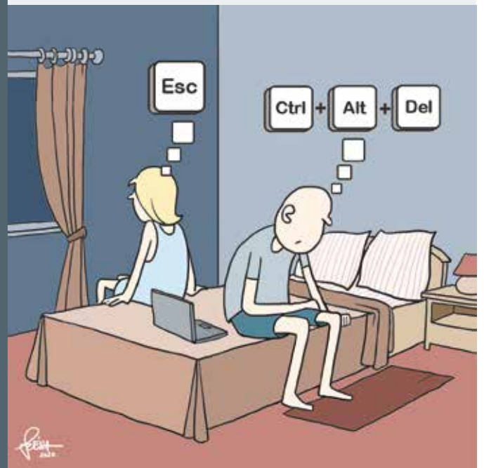
Szénási Ferenc (Széna) soproni karikaturista alkotásai hétről hétre.