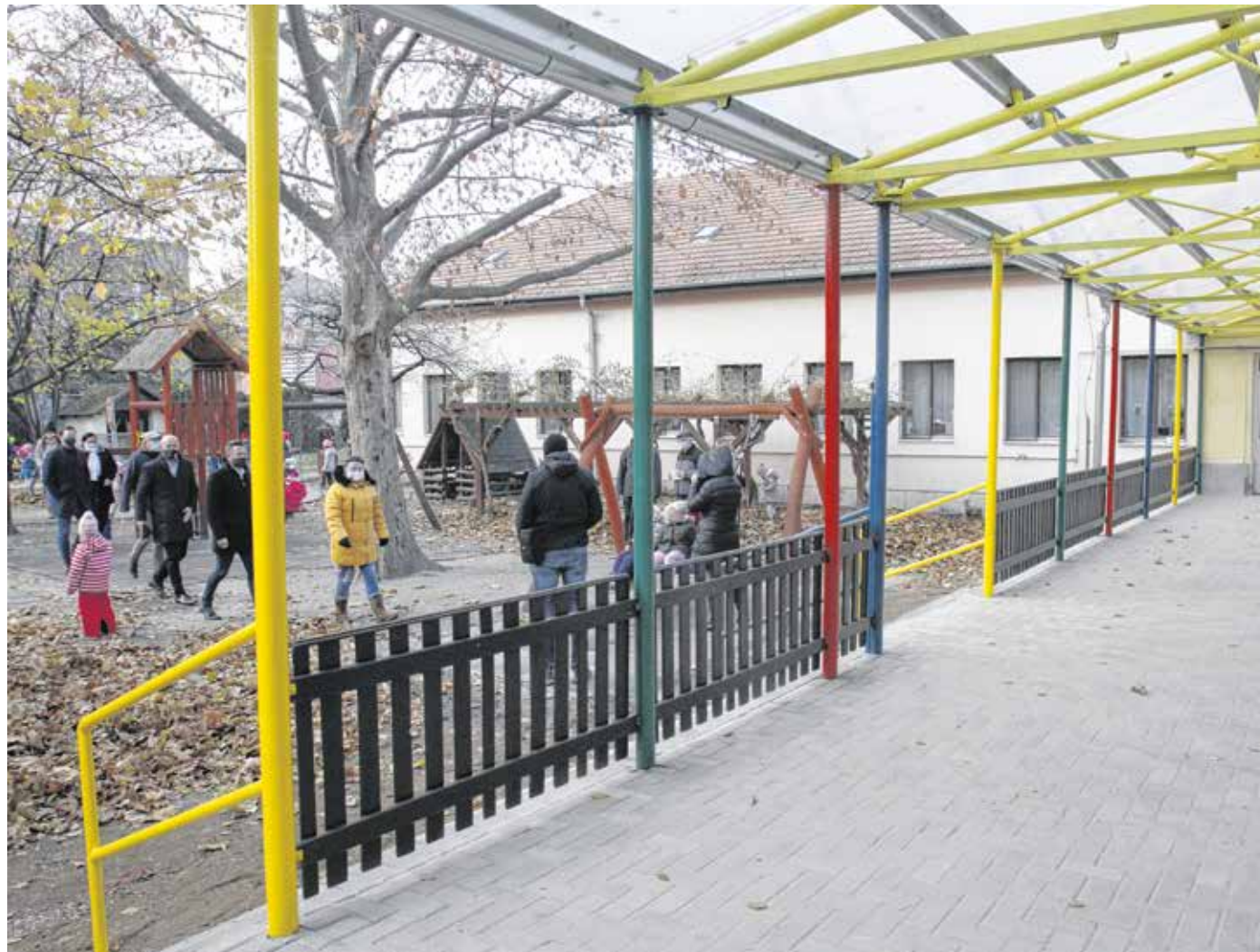
Az udvari fedett teraszt is korszerűsítették a Dózsa György utcai óvodában