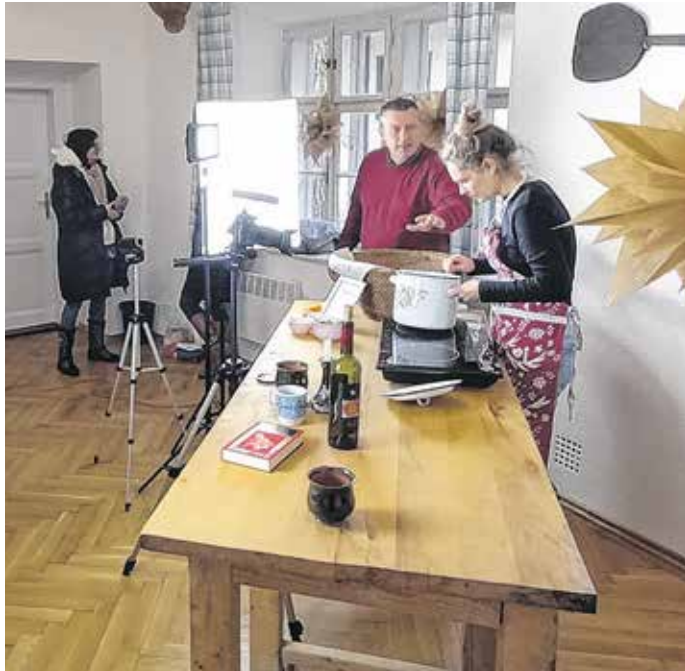
A Soproni Múzeum munkatársai az adventi videók forgatása közben

hogyan kell a finom házi szaloncukorhoz, de forraltbor-receptet is kaphatnak a nézők, illetve betekínhetnek tradicionális karácsonyi sütemények elkészítésébe. Az összeállításokat a múzeum YouTube-csatornáján teszik közzé advent hétvégéin, és elérhetőek a múzeum facebook-oldalán is.