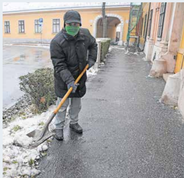
A tulajdonosok dolga a járda takarítása – erre télen különösen figyeljünk!