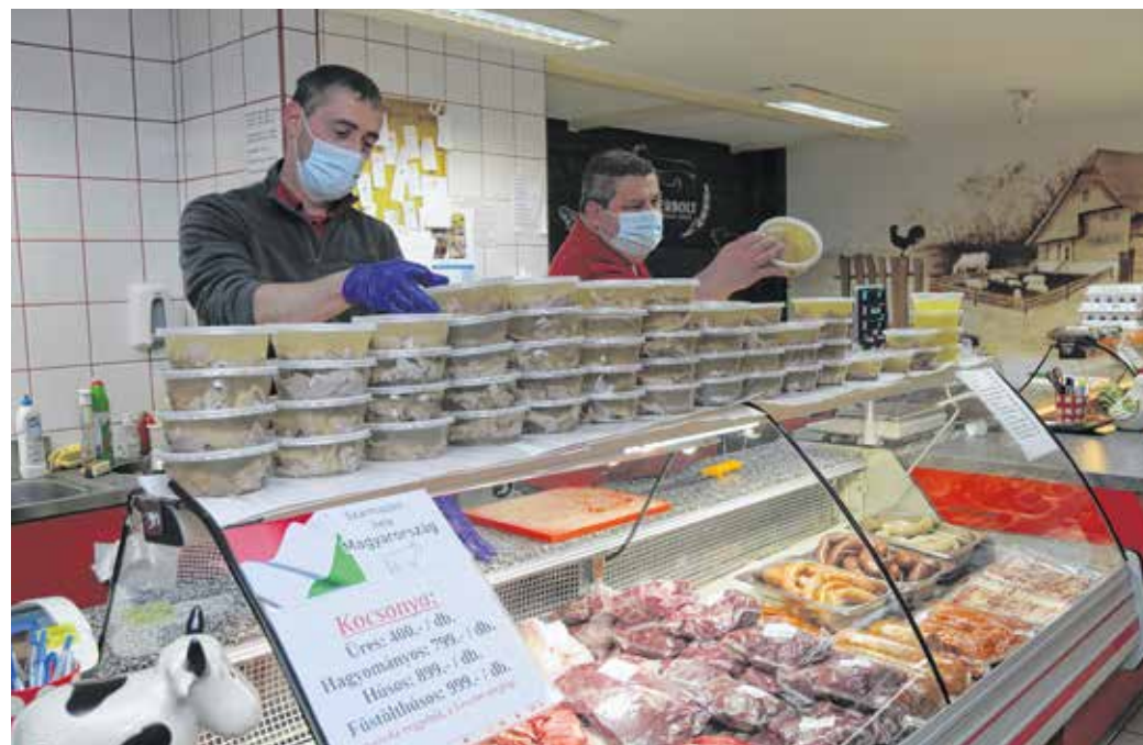
Gazdag a kínálat a soproni henteseknél – az általunk megkérdezett szakemberek szerint a hazai hússok, illetve hűskészítmények jó minőségűek

A rendszer kétszintű: alap- és aranyfokozata van. Az alapfokozatra bárki pályázhat, aki élelmiszert állít elő, vagy saját márkás terméket forgalmaz. Az aranyfokozatra csak azzal a termékkel lehet pályázni, amely a Nébih által koordinált, összehasonlító termékmustrán a legjobbak között szerepel. A védjegyek a