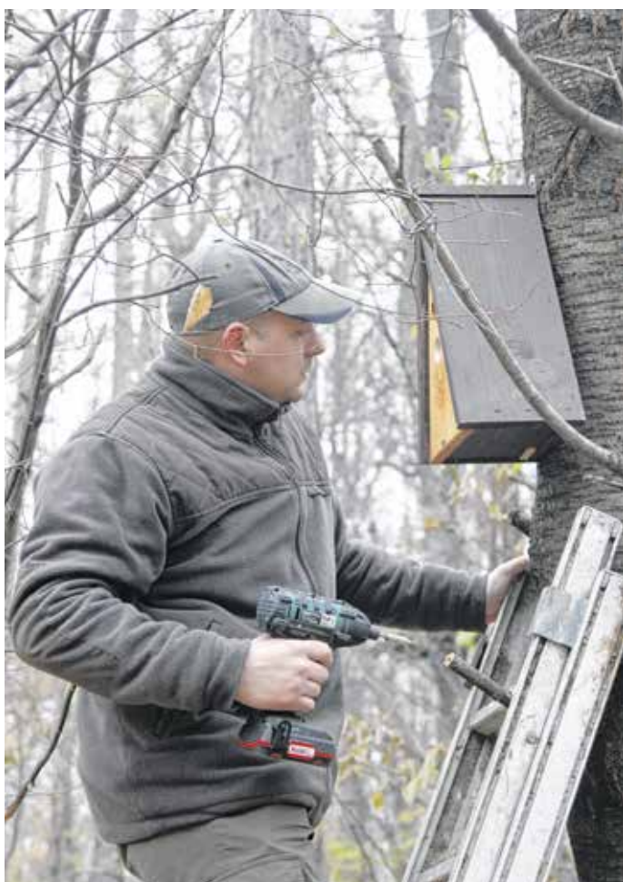
A madárkarácsony-túra állomásainak egy részén madárodút is elhelyeztek a szervezők – ezzel is felhívják a figyelmet a téli madáretetés fontosságára