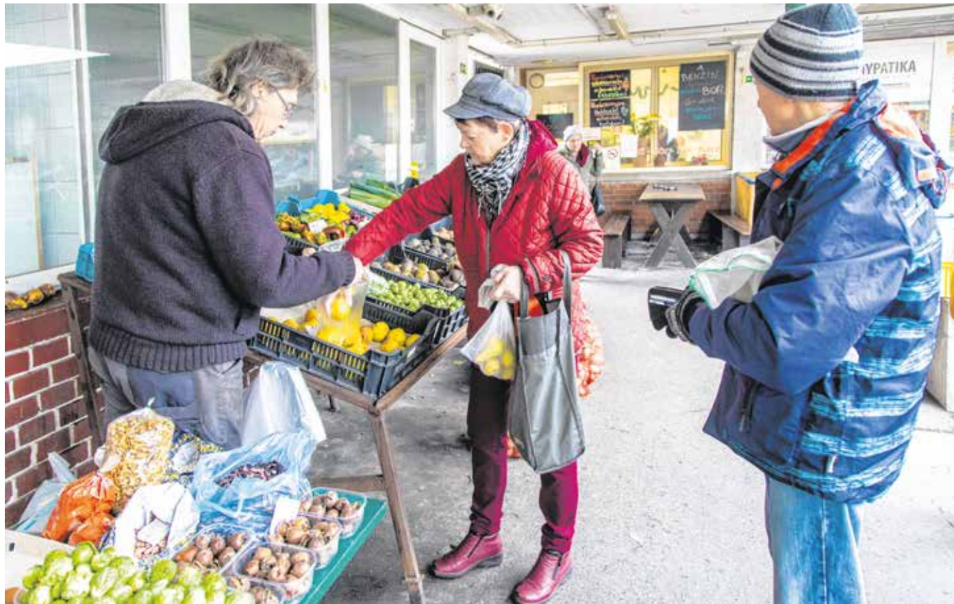
Vásároljunk szezonális termékeket, mert azok ásványianyag- és tápanyagtartalma jóval magasabb!