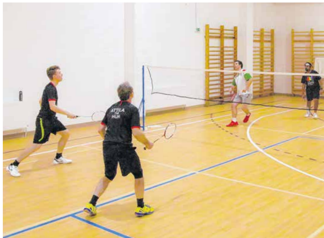
Összesen mintegy negyven tollaslabda-mérkőzést játszottak a hétfői ranglistaversenyen. A soproniak több dobogós helyezést is szereztek.

A sportvezető hozzátette: történelmi megmérettetést rendeztek múlt hétfőn az új