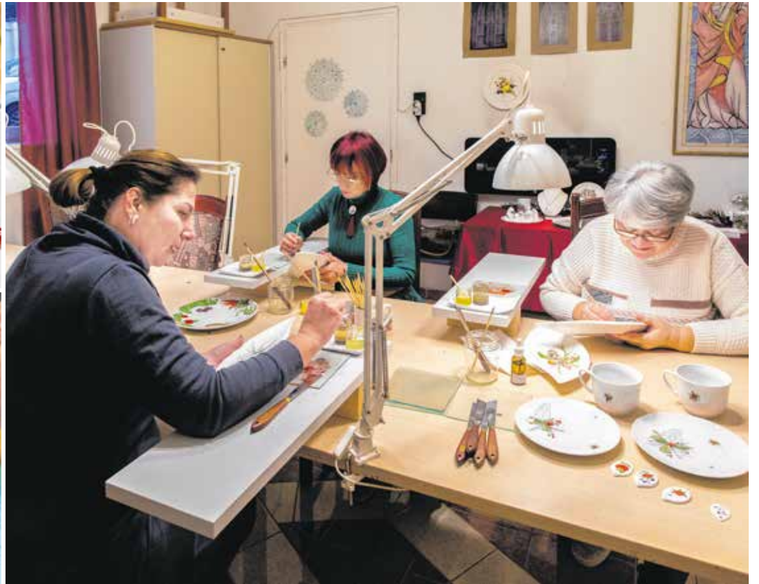
Az adventi foglalkozásokon mézeskalácsot díszítettek, valamint porcelánt és üveget is festettek a résztvevők.