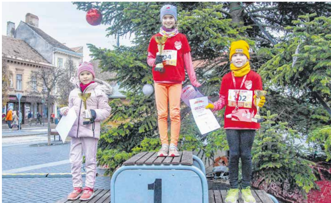
A hűség napi futáson a kategóriák első három helyezettjét serleggel és oklevéllel köszöntötték.

A hűség napi futáson külön indultak a gyerekek és a felnőttek. Előbbieket két kategóriába sorolták: 9 év alatti, illetve 9 és 13 év közötti korosztályok versenyezhettek egymással. A felnőttek esetében 14 és 44 év közötti, valamint 45 év fölötti kategóriákat