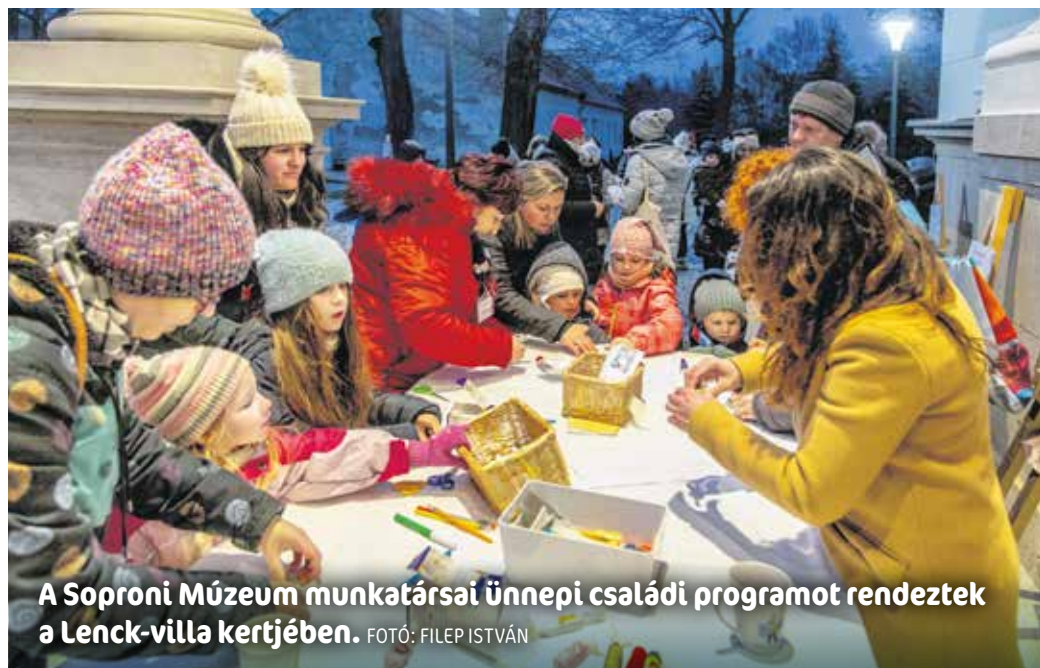
A Soproni Múzeum munkatársai ünnepi családi programot rendeztek a Lenck-villa kertjében.