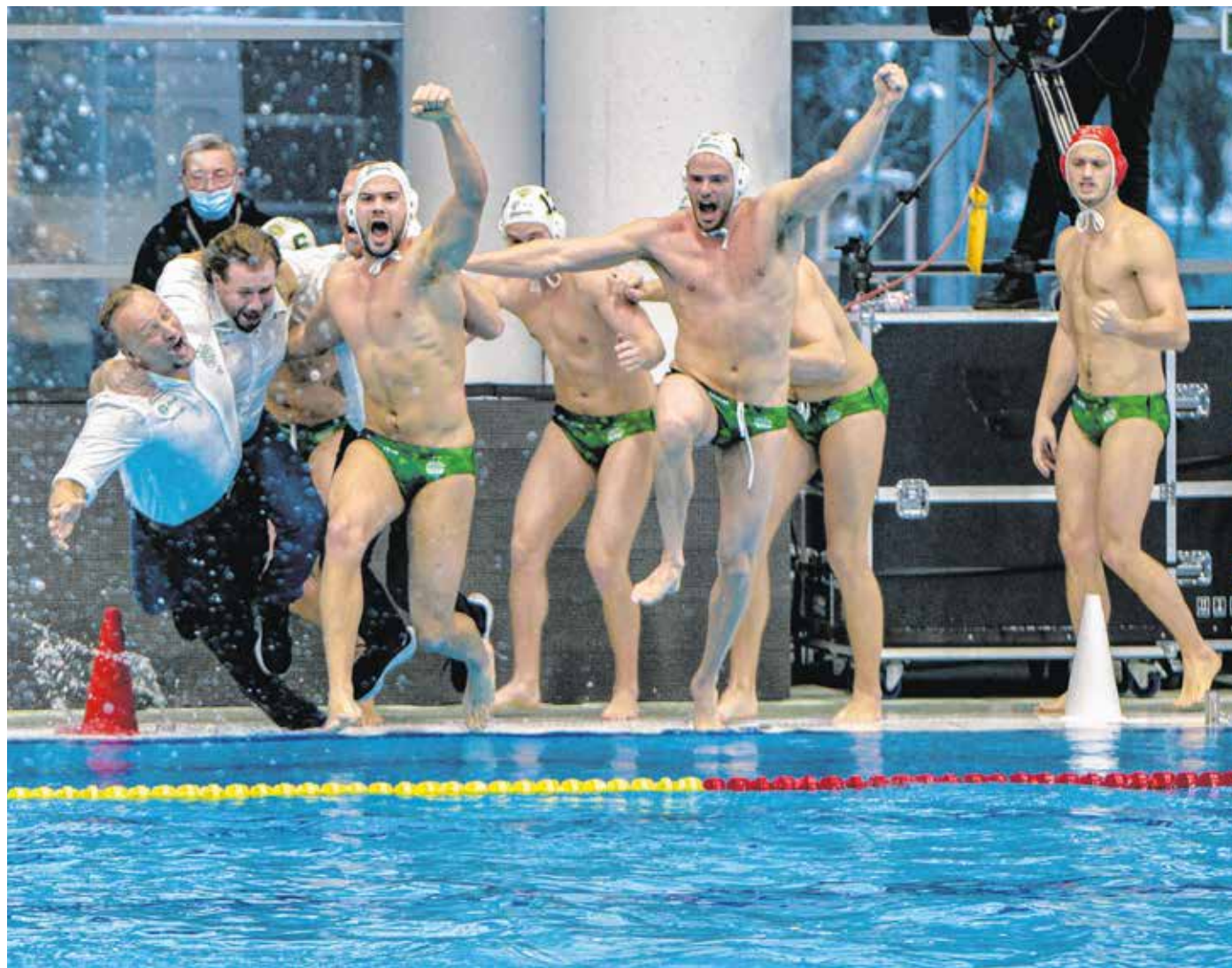
A Ferencváros játékosai ünneplik győzelmüket a BENU férfi vízilabda Magyar Kupa döntőjében a soproni Lóver uszodában. A Ferencváros címét megvédve 12-9-re győzött a Szolnok ellen a finálében.

A meccs valódi demonstráció volt a vízilabdásport számára: gyönyörű gólokat, parádés védéseket láthatott a nagyszámú, felváltva