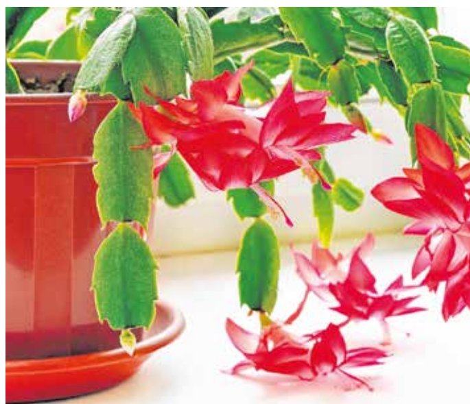
Az év túlnyomó részében világos helyen kell tartani a karácsonyi kaktuszt.