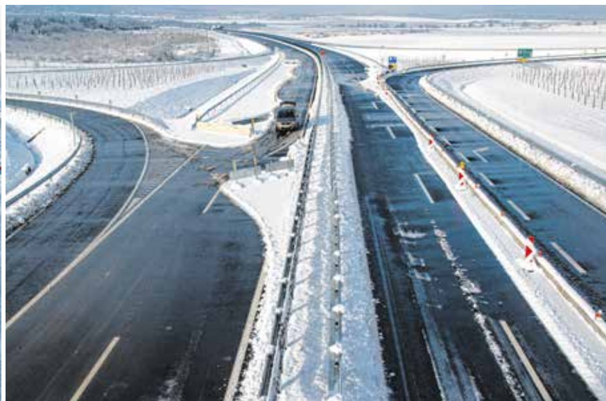
Az autósok már múlt héten birtokba vették az M85-ös új szakaszát.