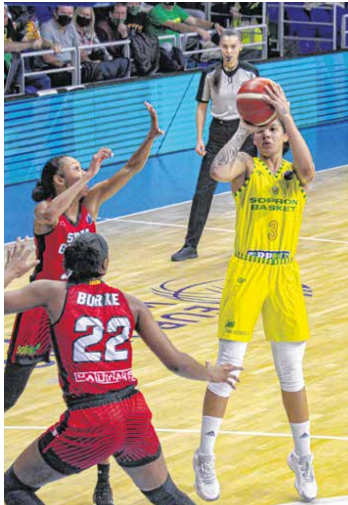
A Sopron Basket a Spar Girona ellen kikapott (felvételünkön), a Szekszárd elleni csúcsrangadót viszont megnyerte a csapat.

– A Gdynia nagyon jól szervezett együttes, a legerősebb csoportellenfeleinkkel is kielezített meccseket játszottak. Mindenképp nehéz meccsre számíthatunk, de nagyon szeretnénk nyerni hazai környezetben.