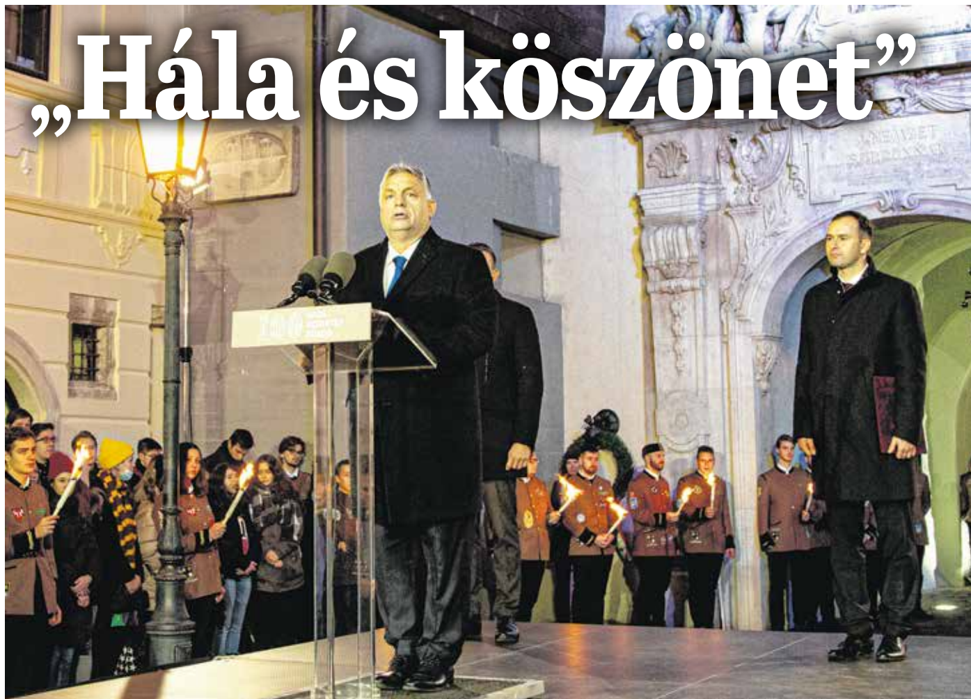
Ha erősek leszünk és összefogunk, akkor most nemcsak Sopron és környéke, hanem egész Magyarország együtt szavaz majd, és talán Európa szíve is megdobban – mondta Orbán Viktor.