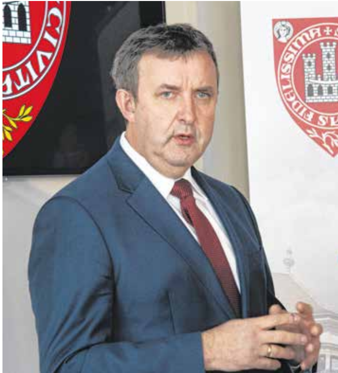
Palkovics László soproni sajtótájékoztatóján a vállalkozások fejlesztésének jelentőségéről is beszélt, illetve arról, hogy a vasúti fuvarozás szerepe a következő években még tovább nő.

– A kormány megkezdte a felsőoktatás átalakítását, amelynek a része volt az is, hogy a Soproni Egyetem önállóvá vált – hangsúlyozta az innovációs és technológiai miniszter. – Ennek hatására idén a korábbi 2,5–3-szorosára nőtt az intézmény