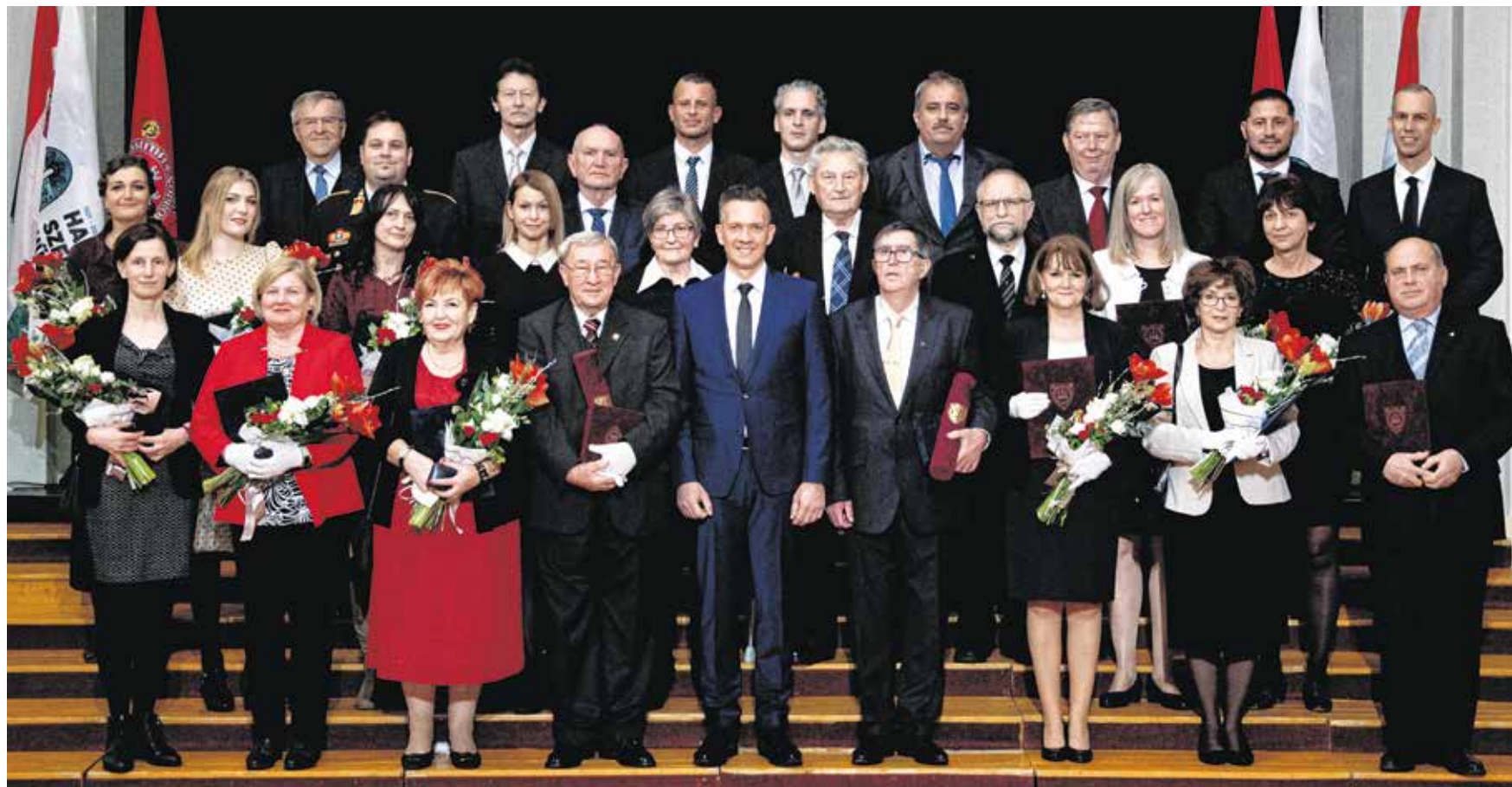
A hűség napi ünnepségen vette át elismerését valamennyi kitüntetett, névsorukat megtalálják december elseji újságunkban.