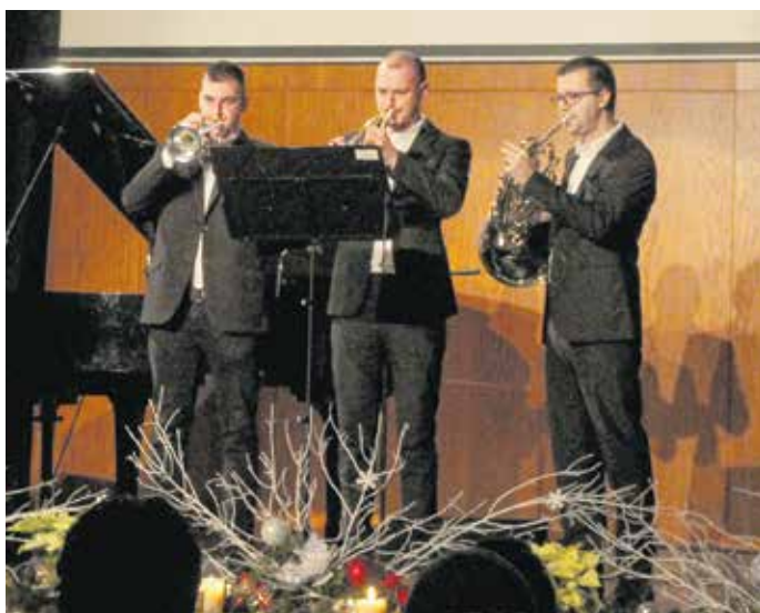
A centenáriumi program adventi koncerttel zárult a Liszt-központban.

Az ünnepi program a Liszt-központban egy adventi koncerttel zárult, ahol az egyetem vezetése mellett szintén részt vettek a város előljárói, valamint a történelmi egyházak képviselői.