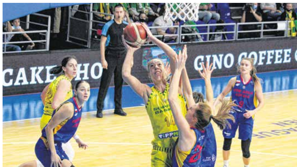
A Sopron Basket biztosan győzött az Arka Gdynia (felvételünkön) és a Vasas elleni meccsen is.