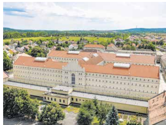
1886-ban nyitották meg a 700 fő befogadóképességű intézetet.

is bemutathatta az új intézményt. „Villanyvilágítást már volt alkalmunk látni, de ilyen óriási kiterjedésben, minő a fegyintézet, még soha. Egy pillanat alatt, mintegy varázslásra, az egész fegyintézet 686 zárkájában kigyúlt a szép fehér fény.” – írta Németh Ferenc a Sopron című újságban. Hivatalosan 1886 novemberében nyitották meg a 700 fő befogadóképességű intézetet, ahol az elmúlt évtizedekben a köztörvényes bűnözők mellett a magyar történelem jeles személyiségei is megfordultak. Például a későbbi bíboros, a nyilasok által elhurcolt Mindszenty József 1944 karácsonyán a börtön kápolnájában három volt magyar miniszterelnök, gróf Esterházy