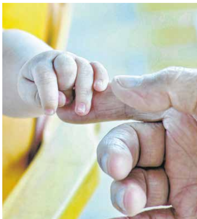
A Várva Várt Alapítvány elsődleges célja, hogy mindenki a saját otthonában tudja nevelni gyermekét. FOTÓILLUSZTRÁCIÓ

– Az alapítvány rengeteg babaruhával és pelenkával segít nekünk, ha nem lenne, kiságyat és babakocsit is tudnánk adni. Az önkénteseknek kiönthetem a lelkem, meghallgatnak és tanácsot adnak