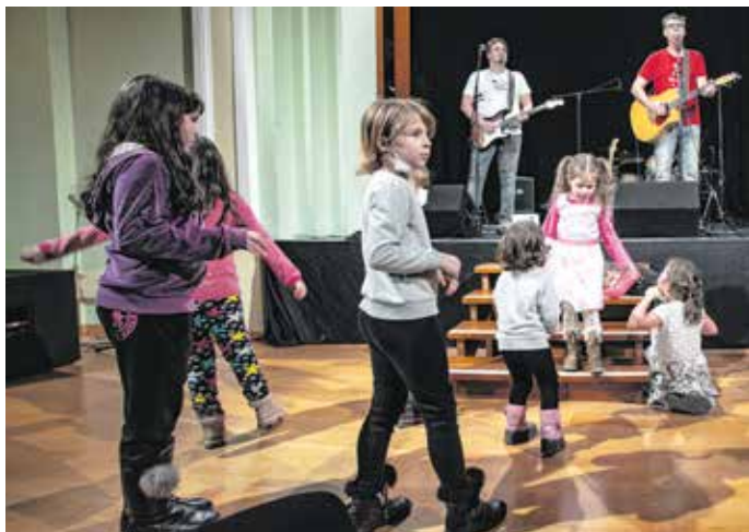
Hatodik éve szervez karácsonyi ajándékozást rászoruló gyerekeknek az önkormányzat.