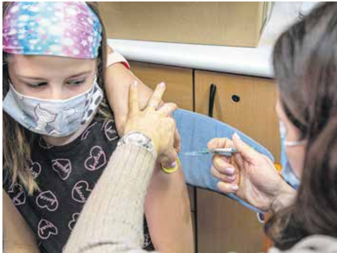
A kisgyerekek is Pfizer-vakcinát kapnak.