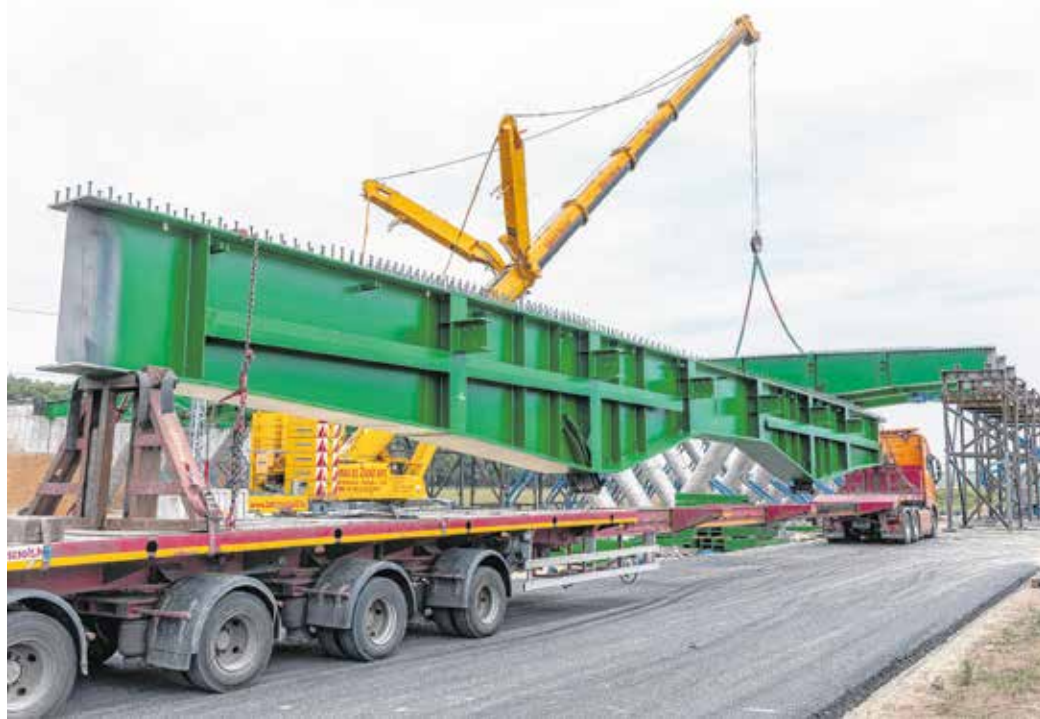
A vadátjáró híderendéit emelték be Nagycenknel 2020 májusában

Szeptemberben aztán újabb, fontos állomáshoz érkezett a beruházás (M85: ütemesen haladnak, Soproni Téma, 2020. szeptember 23.). Ekkortól tereltek a 84-es főútvonal teljes forgalmát az M85-ös gyorsforgalmi úthoz tartozó Sopron-kelet-csomóponton keresztül.