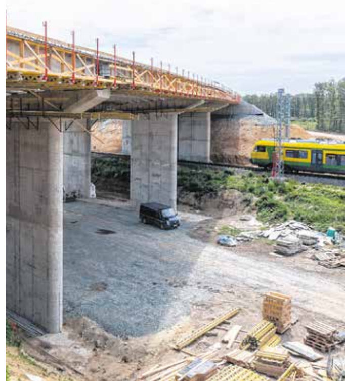
Épül a vasúti felüljáró Kópházánál