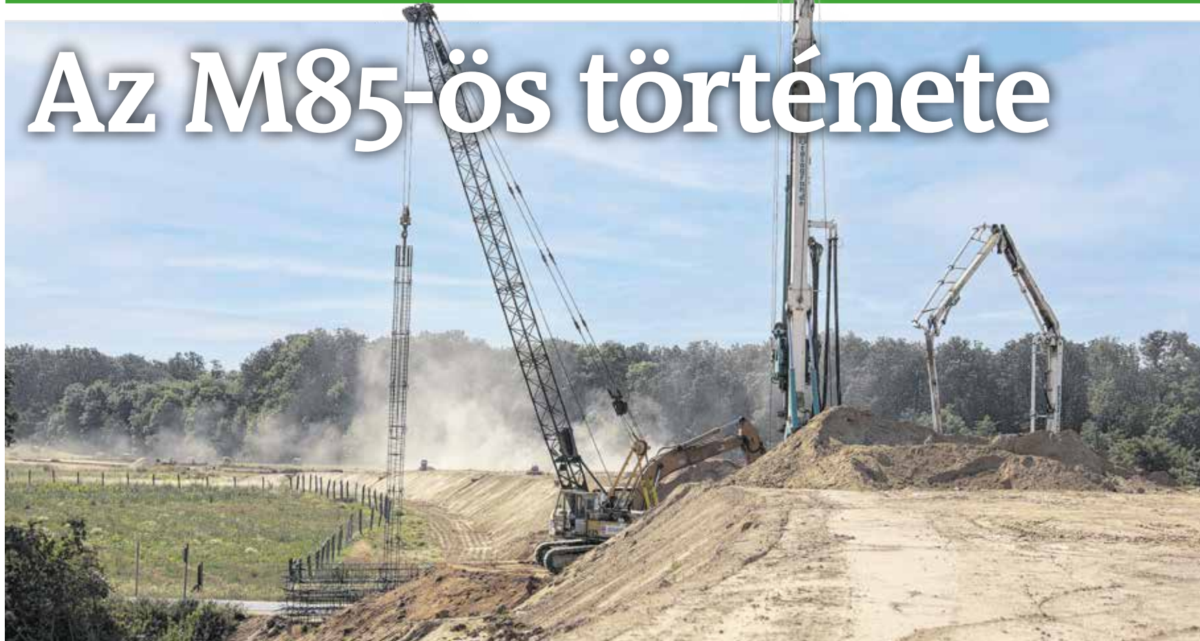
Cölöpözés Kópháza térségében. 2019 nyarán így nézett ki az épülő gyorsforgalmi út.