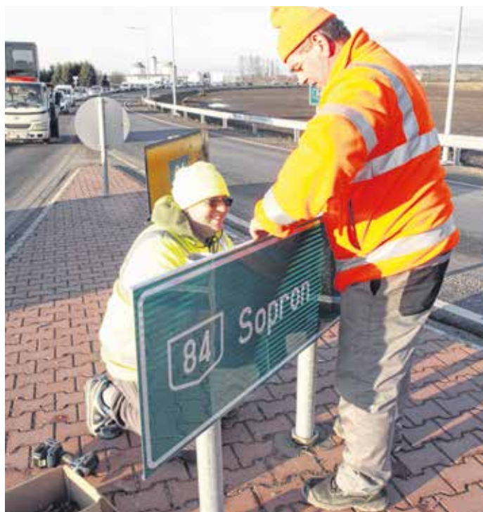
Irány Sopron! Városunk is bekapcsolódott az országos gyorsforgalmiút-hálózatba.