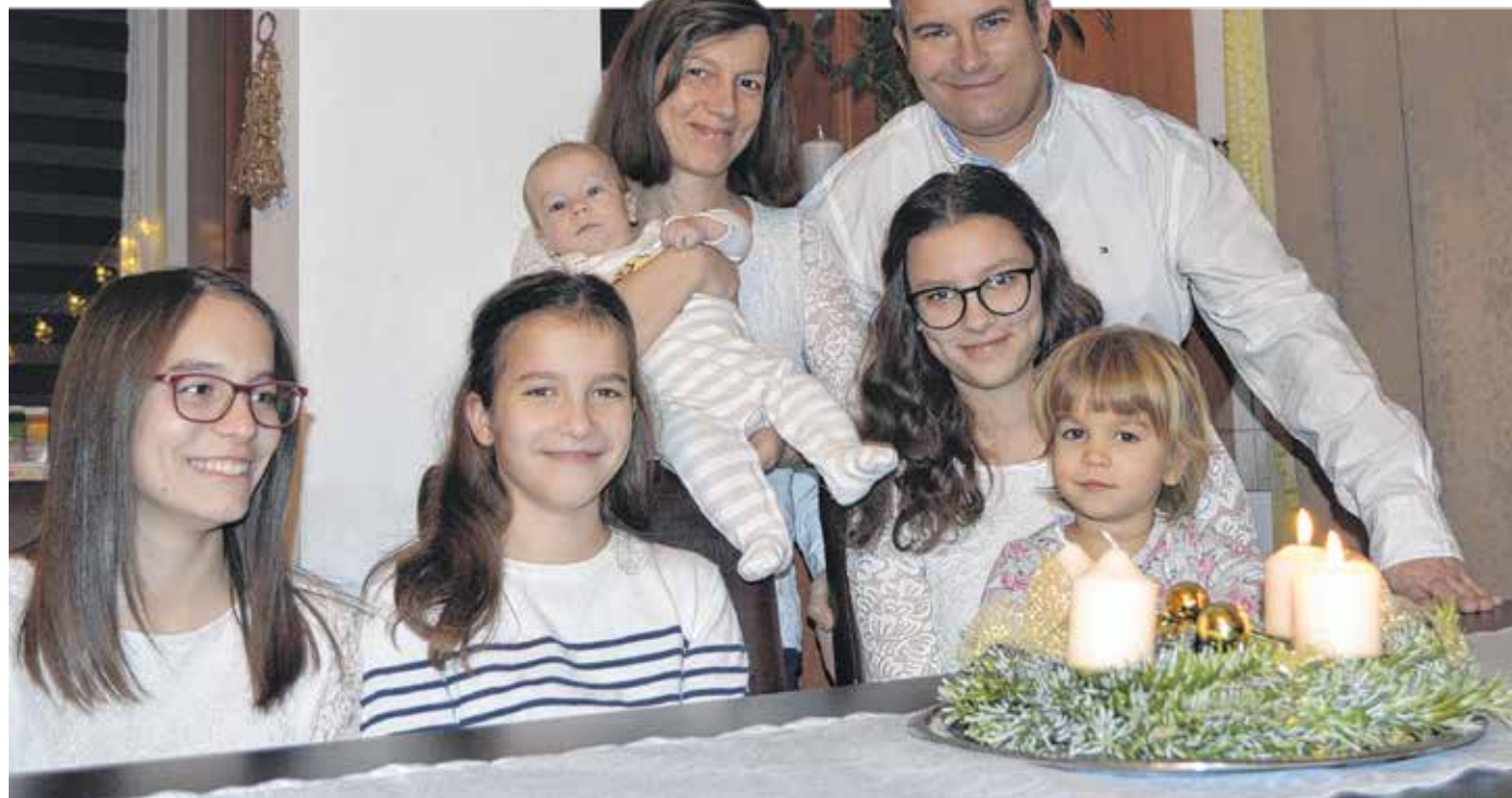
A Kis család idén is igyekszik a karácsony igazi csodáját megteremteni

– Az igazi adventhez hozzátartoznak a roráték, igyekezünk